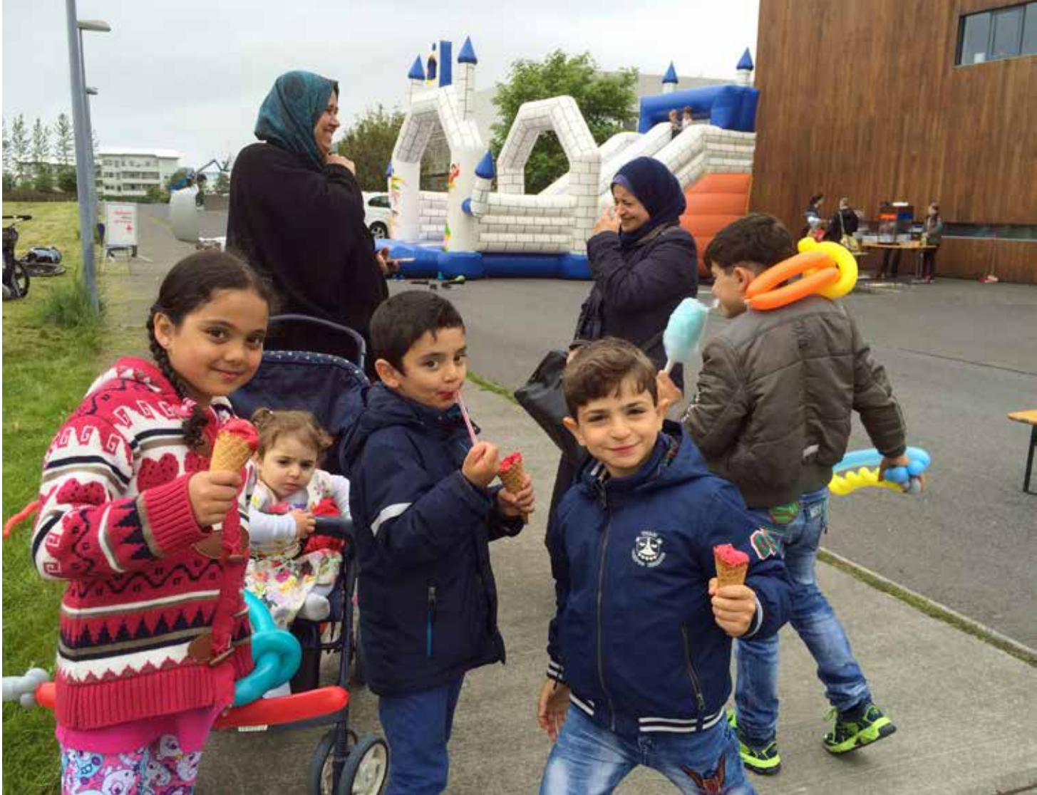
Hlutverk Rauða krossins í móttöku flóttafólks snýr fyrst og fremst að félagslegri virkni og gagnkvæmri aðlögun að íslensku samfélagi. Hér eru flóttafjölskyldur á sumarahátíð sjálfbóðaliða Rauða krossins í Reykjavík – og njóta sín augljóslega vel.