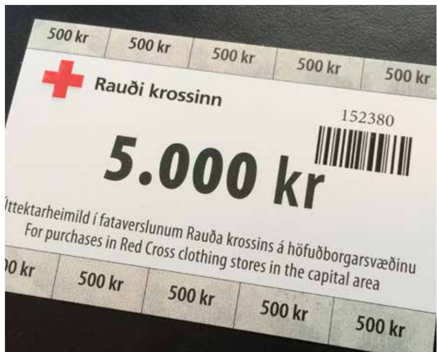
Fatakortin eru númeruð og notendur geta framvísað þeim eins og um reiðufé væri að ræða í fataverslunum Rauða krossins á höfuðborgarsvæðinu.