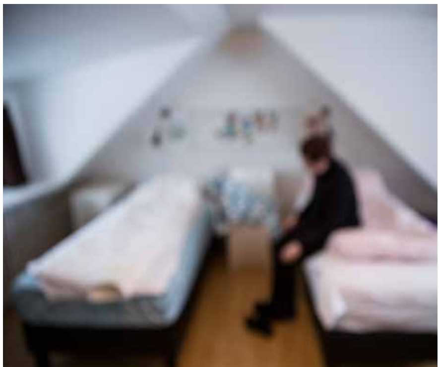
Rúmlega 100 konur komu í Konukot á árinu og nutu aðstoðar starfskvenna og sjálfboðaliða í hlýlegu umhverfi.

Hlutverk sjálfboðaliða í Konukoti er afar mikilvægur hluti starfseminnar. Á árinu störfuðu 73 sjálfboðaliðar í Konukoti og