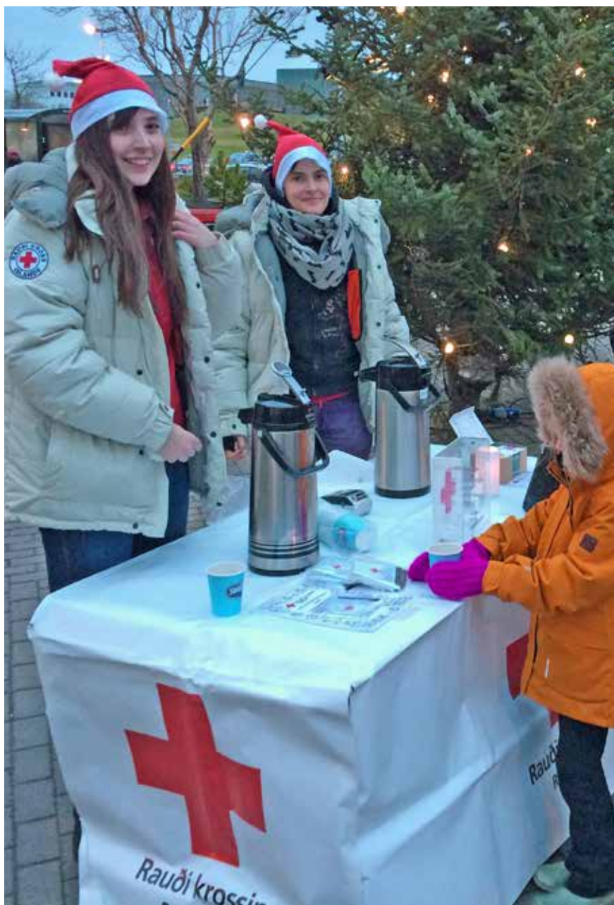
Árleg kakósöla sjálfböðaliða Rauða krossins setur svip á miðbæ Reykjavíkur á aðventunni.

Nýr samningur Rauða krossins í Reykjavík við Reykjavíkurborg um rekstur Konukots var undirritaður á árinu og reksturinn þannig tryggður til næstu þriggja ára. Árið áður var gerður samningur um rekstur Vinjar. Velferðaráðuneytið styrkti Rauða krossinn í Reykjavík á árinu og ber þar hæst framlög til Vinjar og skaðaminnkunarstarfsins í Frú Ragnheiði.