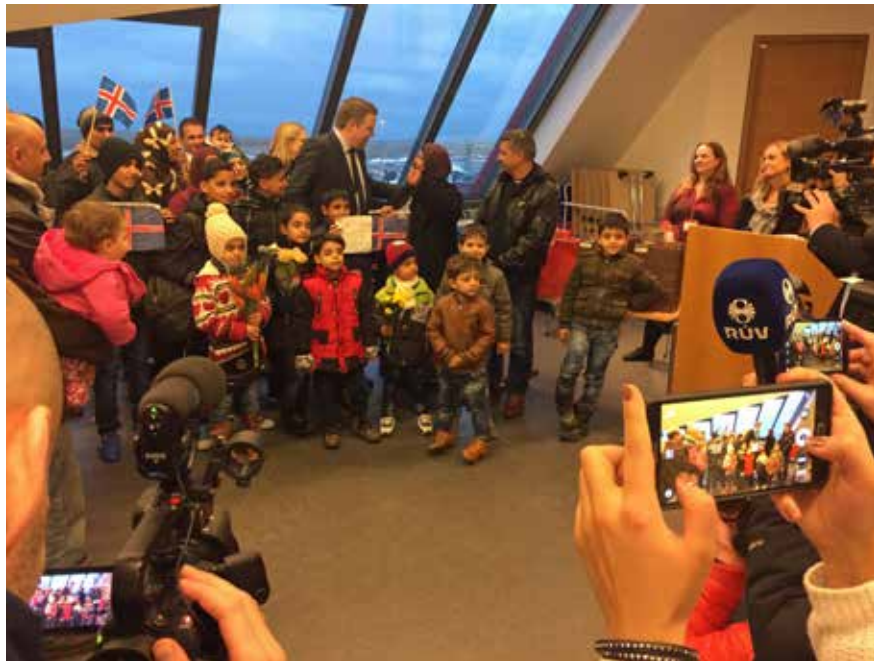
Sýrlenska flóttafólkinu til furðu og ómældrar ánægju var móttaka í Leifsstöð þar sem forsætisráðherra Íslands tók á móti því við komuna í janúar 2016.