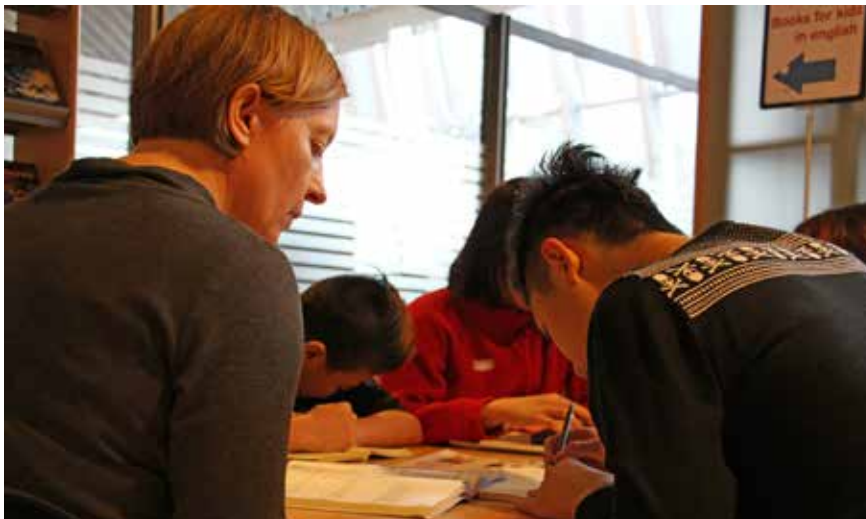
Í Kringlusafni er heimanámsaðstoð Rauða krossins bæði fyrir börn í yngri og eldri bekkjum grunnskólans.

Heilahristingur er heimanámsaðstoð fyrir grunnskólanema, framhaldsskólanema og fullorðna. Um er að ræða samstarfsverkefni Rauða krossins í Reykjavík, Borgarbókasafns og skóla- og frístundasviðs Reykjavíkurborgar.