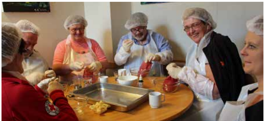
Sláturgerð er einn af árlegum viðburðum í Vin, sem vekur mikla lukku, bæði þegar slátrið er tekið og þegar þess er neytt.

Sjálfbóðaliðar hafa tekið þátt í daglegum störfum, þrífum, eldamennsku, samveru og að minnsta kosti þrír þeirra hafa haldið uppi sérverkefnum svo sem námskeiðum í athvarfinu. Í samvinnu við Fangelsismálastofnun hafa samfélagsþjónar komið til aðstoðar við daglega starfsemi.