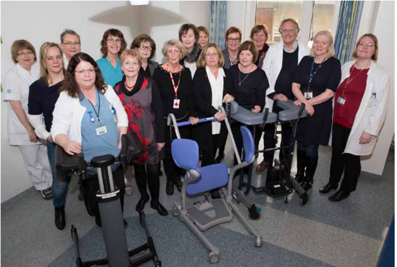
Sjálfbóðaliðar Kvennadeildar afhenda æfingataeki til starfsfólks á öldrunardeildum á Landakoti.