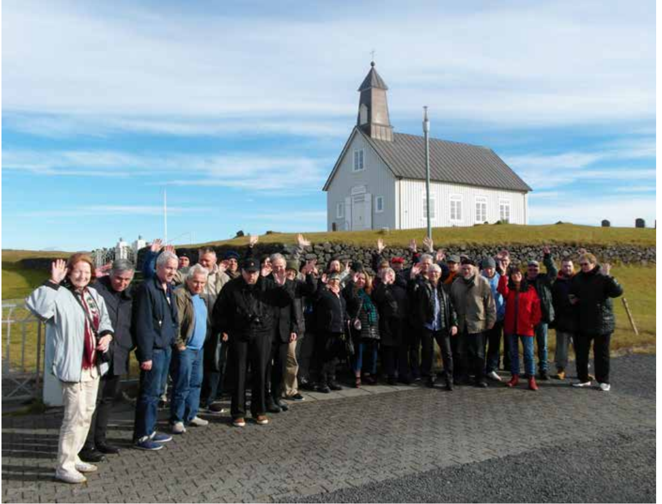
Ferðir innan og utan lands eru vinsælar meðal gesta. Meðal annars var farið í vel sóttu haustferð um Suðurstrandaveg. Hér er hópurinn með Strandakirkju í bakgrunni.

Hluti virkninnar á sér stað utan hússins góða við Hverfisgötu. Þannig hafa gestir Vinjar til dæmis séð um skákkennslu í Hlutverkasetri vikulega, setið í undirbúningsnefnd um skipulag fyrir alþjóðlega geðheilbrigðisdaginn og verið í samstarfshópi úrræðanna sem Geðhjálp stýrir. Á árinu voru þrjú gestir Vinjar tilnefndir í notendahóp mannréttindaskrifstofu Reykjavíkur.