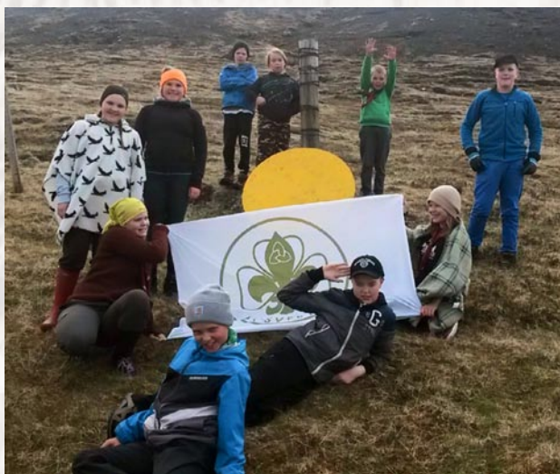
Mosverjar mættir á Vormótið í Krýsuvík í þessu fina veðri. Allir spenntir fyrir dagskránni sem er framundan.

12. – 14. júní | Vormót Hraunbúa í Krýsuvík. Eins og mörg undanfarin ár fóru fálkaskátar í Mosverjum á skátamót í Krýsuvík. Veðrið lék við okkur og fór vel um mannskapinn í tjöldunum. Á dagskránni voru póstaleikir, varðeldur og hið viðfræga Arnarfellshlaup. Allir komu næstum því sólbrenndir heim eftir góða helgi.