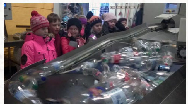
Drekaskátarnir og Græna túrbótalningarvél

Að lokinni skoðun í slökkvistöðinni lá svo leið okkar í Skátamiðstöðina í Hraunbæ 123, en þar fengum við að skoða Túrbótalningarvélina hjá Grænum skátum. Nú vita allir drekaskátar í Mosverjum hvað verður um dósirnar sem lenda í dósakassanum okkar.