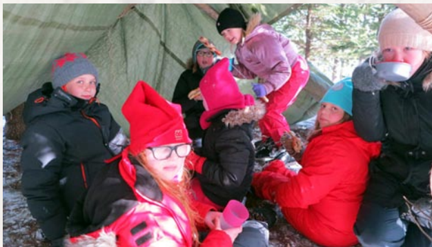
Útivistarofurhetjur slógu upp ofurhetjuskýli

Fálkaskátasveitin Smyrlar í Mosverjum fóru á Úlfjótstvatn í sveitarútilegu um nýliðna helgi. Mikið fjör var í útilegunni sem var með ofurhetjubema. Skátarnir mættu í ofurhetjubúningum og nutu helgarinnar í botn.