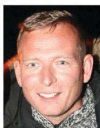
Pistill úr Mosfellingi, mars 2015.

Þessi hátíðarfundur var stórskemmtilegur og greinilega mikil gróska í skátahreyfingunni hérna