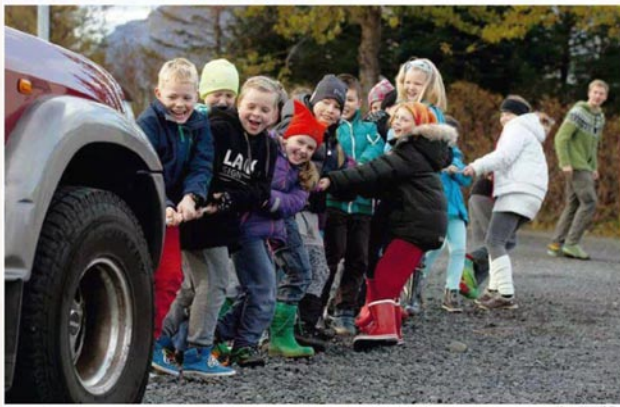
Affraunir ungra skáta í skátafélaginu Mosverja í Mosfellsbæ