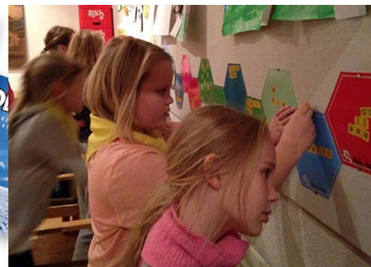
Drekaskátarnir í Mosverjum njóta þess að gera árangur sinn sýnilegan.

Hluti af nýrri dagskrá sem skátarnir hafa verið að innleiða undanfarið ár er hvatakerfi, en það eru verkefnaspjöld fyrir skátana til að gera sýnilegra það sem þeir gera. Nú í haust voru spjöldin og límmiðarnir tilbúnir og hafa verið tekin í notkun hjá fjölmörgum skátasveitum.