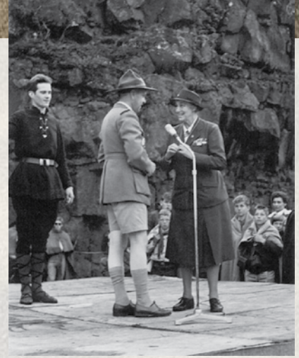
Olave Baden-Powell heiðursgestur mótsins og Páll Gíslason mótsstjóri á varðeldapalli á Landsmóti skáta á Þingvöllum 1962

„Með hverju námskeiði sem lokið var og þekkingu náð fengum við merki til viðurkenningar árangrinum, hvort