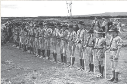
Skátapiltar á Landsmótinu 1962

„Í skátunum lærði maður hvernig ganga ætti um umhverfið og náttúruna, löngu áður en orðið náttúruvernd var upp fundið”.