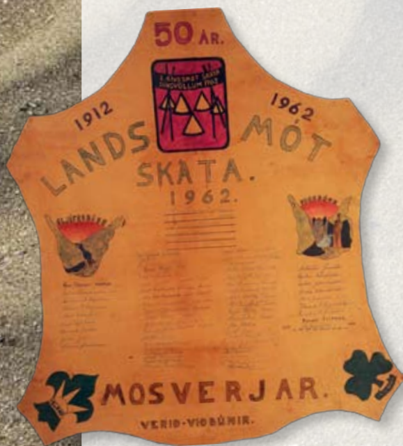
Skinn Mosverja frá Landsmóttinu 1962

Ein fyrstu verkefni Mosverja var að binda saman trönur og skrifa á skinn sem notuð voru á skátahátíðinni á Þingvöllum 1962. Skinnið fannst mörgum árum síðar uppi á háalofti Kaupfélagsins ásamt öðrum munum eins og fána félagsins. Undir þeim fána og fána lýðveldisins var skundað á Þingvöll, með klútana, axlarborðana og böndin í axlarflipunum.