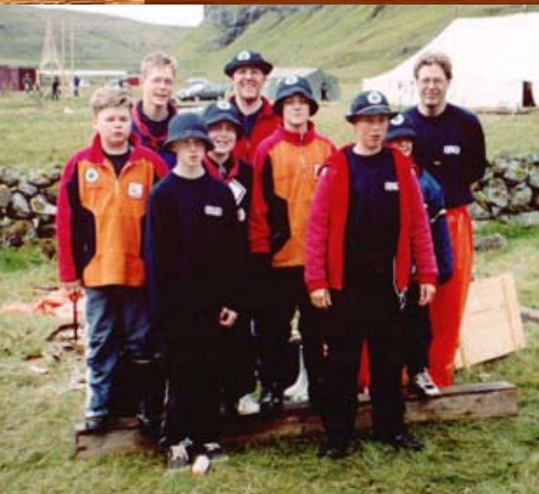
Mosverjar á skátamóti í Færeyjum árið 2002