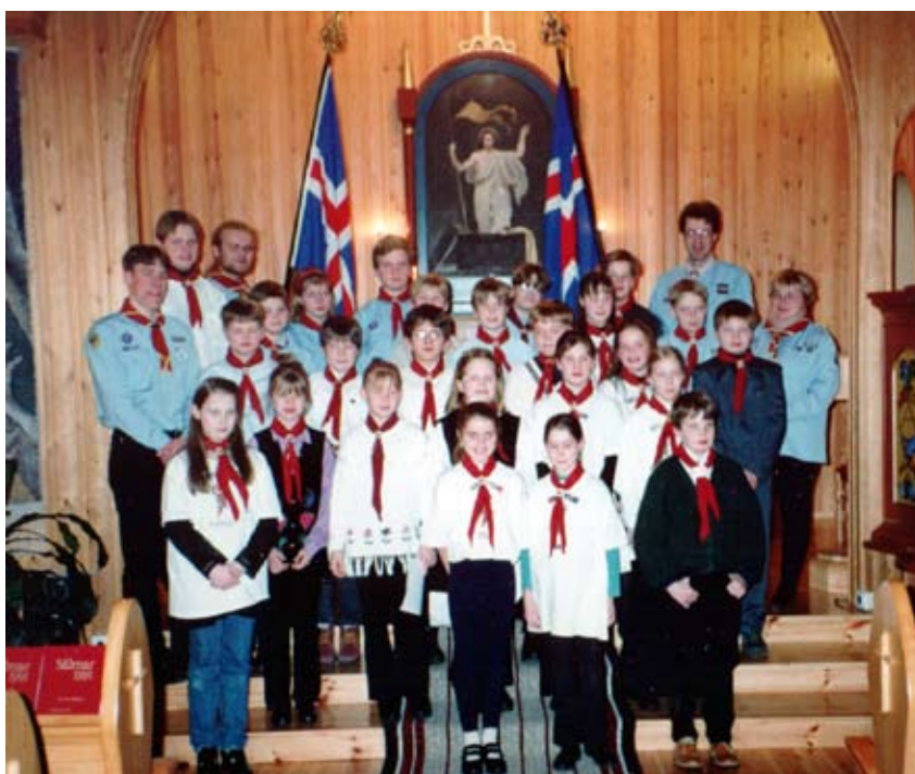
Mosverjar vígðu nýliða við hátíðlega athöfn í Lágafellskirkju um árabíl

Stefna Mosverja er nú sem áður að standa fyrir fjölbreyttu og öflugum skátastarfi. Á nýliðnu starfsári hefur margt verið gert sem hefur styrkt skátastarfið í Mosfellsbæ. Á árinu var þess minnst að 100 ár eru liðin síðan skátastarf hófst á Íslandi og minntust skátar þeirra tímamóta á ýmsan hátt. Skátarnir í Mosverjum hafa ekki látið sitt eftir liggja í þeim efnum og tóku meðal annars þátt í afmælislandsmóti skáta á Úlfjótavatni síðastliðið sumar. Mosverjar fögnuðu einnig 50 ára afmæli félagsins með sérstökum hátíðarfundum á Baden Powell deginum 22. febrúar 2012. Um þetta og margt annað sem drifið hefur á daga okkar má lesa hér í þessu riti ásamt því að dregnar eru upp svipmyndir frá starfsárinu 2011 – 2012.