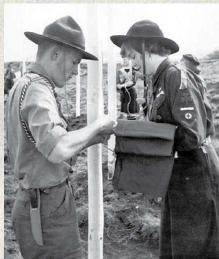
Landsmót skáta Þingvöllum 1962

fámennis í sveitinni. En það gekk vonum fram og starfið fór vel af stað. Þau systkinin eru sammála um að dugnaður föður þeirra hafi skipt verulegu máli í því sambandi, því ekki var það þannig að hann hefði lítið að gera, með tíu manna heimili og í krefjandi starfi.