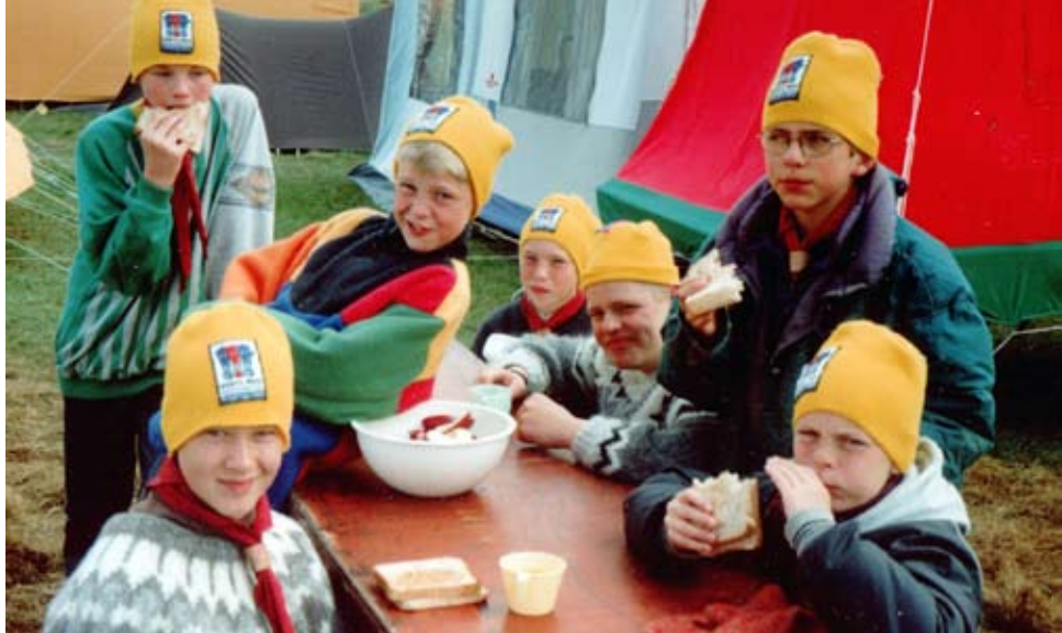
Mosverjar á lýðveldismótinu 1994

Starfið hefur verið allgott á undanförunum árum og margt verið gert. Við höfum einbeitt okkur að starfinu hér í Mosfellsbænum sem er orðið mjög fjölbreytt. Samstarfið við Mosfellsbæ hefur gefist vel og aukist ár frá ári og enn fremur hafa Mosverjar hafa tekið þátt í öðrum skátaviðburðum á Íslandi. Þar hafa landsmót skáta verið vel sótt auk þess sem Mosverjar byrjuðu að sækja skátamót á erlendri grund. Við höfum nú farið til fjölmargra landa, m.a. á tvö jambooreemót- stóra afmælistótið á Englandi 2007 og til Svíþjóðar 2011 svo dæmi séu tekin. Margir einstaklingar hafa komið við í Mosverjum á sinni þroskabrot og ekki má heldur gleyma þeim fjölmörgu fullorðnu einstaklingum, foreldrum og öðrum sem hafa lagt starfinu lið á einhvern hátt.