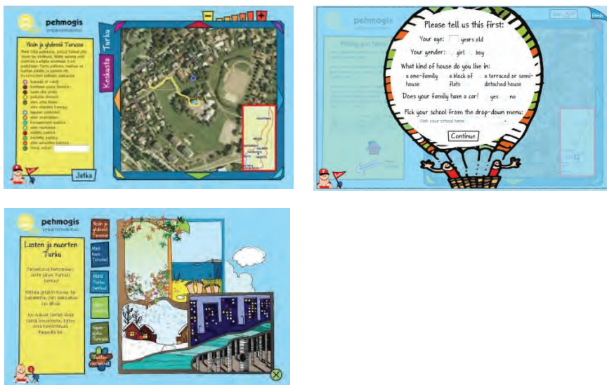
Mynd 1 SoftGIS-hugbúnaður fyrir börn og unglunga í Turku ( www.softgis.fi/turku ).

SoftGIS-aðferðinni hefur verið beitt til að skrá daglegar upplifanir og atferli íbúa út frá staðarupplýsingum. Þannig má koma upplifunum íbúanna til skila. Þær tengjast nærumhverfinu og skipulagslausnum sem þegar hafa verið framkvæmdar. Upplýsingar um upplifanir á afmörkuðum svæðum eru miklu verðmætari í skipulagsvinnu en svör frá íbúum sem fengin eru með hefðbundnum aðferðum 22 . Með því að nota softGIS-aðferðina á netinu næst til mun fleiri íbúa en ella. Aðferðin hefur verið notuð á sjö stöðum með ólíka markhópa, t.d. til að kanna hvernig íbúar meta gæði og öryggi búsvæðisins og tengsl barna og unglunga við umhverfið. Um 4000 Finnar hafa tekið þátt í softGIS-könnuninum. Aðferðin hefur einnig vakið töluverða athygli erlendis 23 .