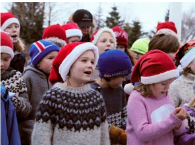
Tíundi grænfáninn í höfn.

Skólinn hefur í gegnum tíðina unnið að ólíkum þeimum og verkefnum sem tengjast áherslum sjálfbærni. Hann hefur t.d. tekið fyrir áttþaga og landslag, lýðheilsu og hnattrænt jafnrétti, unnið gegn matarsóun og dregið úr vistspori sínu með því að minnka úrgang og molta lífrænan úrgang. Útinám er mikilvægur hluti af skólastarfinu sem og tengsl við nærsamfélag skólans.