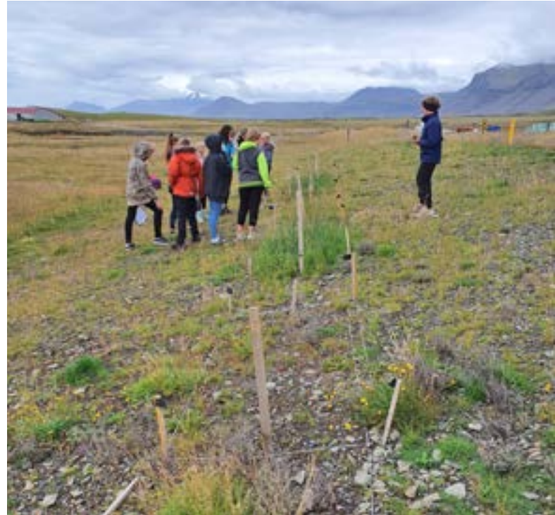
Hautið 2020 tóku nemendur út gróðurinn í tilraunareitunum og sáu að mikill munur var á gróðri innan og utan reita – og milli reita.

Skítatilraunin verður eitt verkefnanna í Náttúra til framtíðar sem er nýtt námsefni um vistheimt og náttúruvernd fyrir unglingastig og framhaldsskóla sem nú er í smíðum á vegum Vistheimt í skólum og verður gefið út í samstarfi við Menntamálastofnun síðar á árinu.