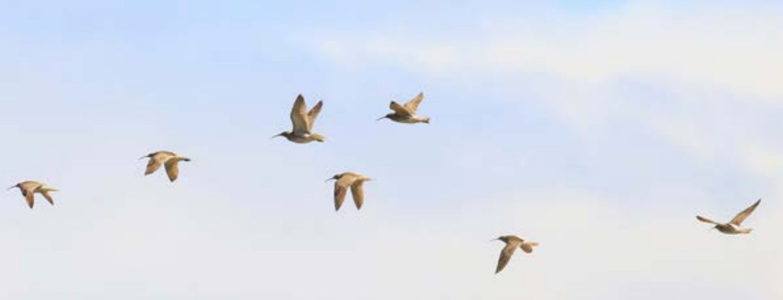
Spóinn flýgur 6.000 km leið frá V-Afríku í einum rykk.

Hjá spóa og nokkrum öðrum tegundum vaðfugla hefur þróast langt viðstöðulaust farflug af þessu tagi. Metið eiga lappajaðrakanar sem verpa í Alaska en hafa vetursetu á Nýja Sjálandi en þeir fljúga um 11 þúsund kílómetra án viðkomu og tekur flugið rúma viku. Þessi ótrúlegu farkerfi hafa þróast á löngum tíma og eru skólabókardæmi um einstæða aðlögun lífvera að umhverfi sínu. Mikið flugþol, hæfileikar til að rata og halda átt yfir kennileitalausu úthafinu og fínstilltar tímasetningar atburða yfir árið eru allt flóknir eiginleikar sem spila saman. Þessir hæfileikar, sem hafa þróast á löngum tíma, gera spóum kleift að nýta sér til hagsbóta jafn ólíkar aðstæður og finnast á hvítum ströndum V-Afríku og Markarfljótsaurum.