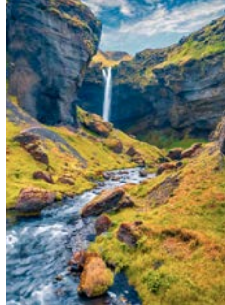
Kvernufoss er í ánni Kvernu sem fellur fram Skógaheiði.

Landvernd nýtir kæruréttinn sem samtökunum er tryggður með Árósa- og EES samningunum með það að markmiði að styrkja umhverfis- og náttúruvernd í landinu. Það hafa samtökin gert undanfarið í auknu mæli í samstarfi við umhverfisverndarsamtök í heimabyggð. Með því móti nýtur Landvernd góðs af þekkingu heimamanna auk þess að styðja við samtök þeirra – og veitir stjórnvöldum um leið öflugra aðhald en ella.