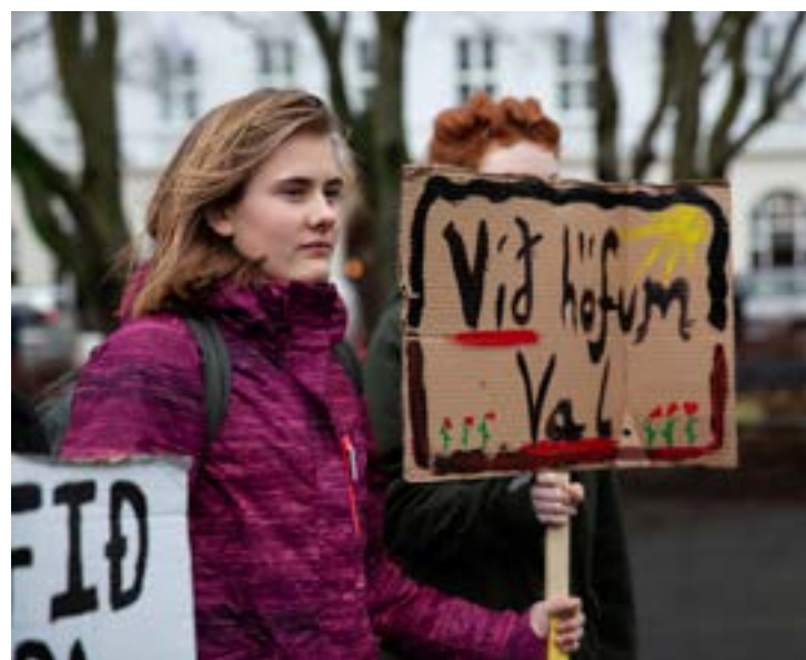
Loftslagsverkföll í Reykjavík.

Margt er í húfi og það virðist sem það sé tregða við að taka stór skref því við erum hrædd við að gera mistök í baráttunni og umbyltingunum sem eru að eiga sér stað. Alicia Garza, einn af stofnendum Black Lives Matter hreyfingarinnar, sagði eitt sinn að við yrðum að hafa frelsi til að gera ný mistök í stað þess að endurtaka söguna. Sem betur fer er sköpunargleði eitt besta einkenni mannsins og við höfum allt til þess að skapa og innleiða róttækar lausnir út frá sameiginlegri ást á umhverfinu, fólki og plánetunni allri.