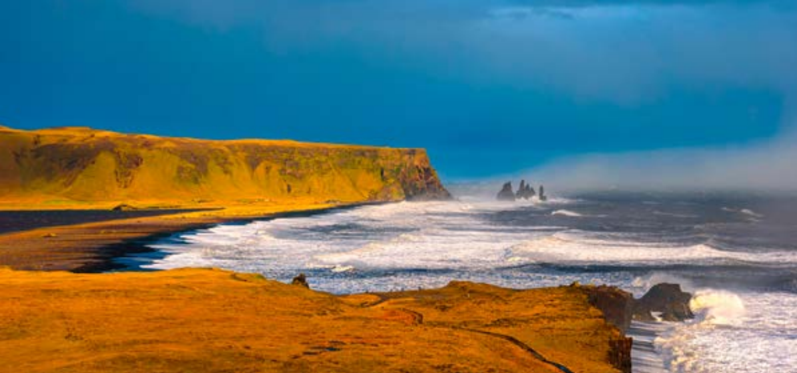
Reynisfjall og Reynisdrangar

til uppbyggingar og skipulags á móti hávaðagróðanum af ferðamönnum.) Hvað hafa mörg ómetanleg svæði orðið fyrir óafturkræfum skaða vegna ágangs? Er virkilega ekki í bígerð að hafa fjöldatakmarkanir á svæðunum sem mest hafa skemmst, þegar ferðamennskan kemst aftur á skrið