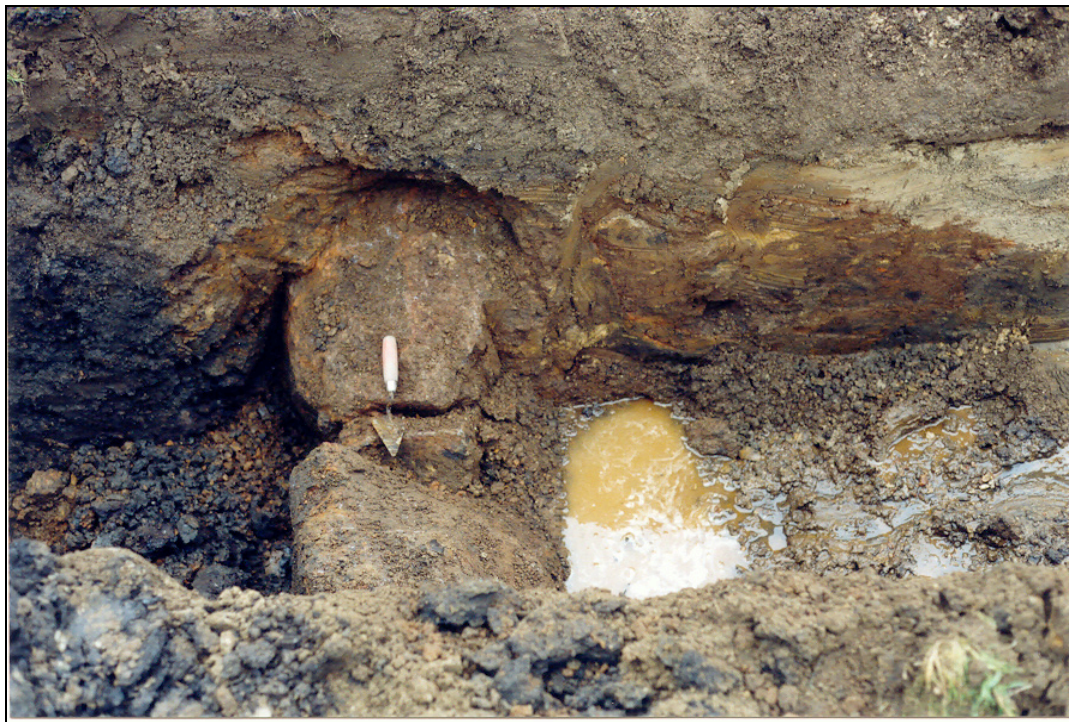
Mynd 2. Efsti veggur í prufuholu 4. Sjá má torfið hægra megin við grjóthleðsluna (múrskeið ofan á hleðslunni). Ofan á hluta torfsins (t.h.) teigir sig gjóskan frá 1362.

Ekki var farið út í nákvæmar rannsóknir á rituðum heimildum um staðinn, sem eru býsna fátæklegar í sjálfu sér, og ekki reynt að grafast fyrir um hið rétta nafn býlisins, en nefnd hafa verið nöfnin Salthöfði, Bær, Bæjarstaður og Vindás. Það litla sem til er í rituðum heimildum benda til að bærinn hafi heitið Bær. Um þann bæ segir í Blöndu I: „Bær er sagt bygð heitið hafi fyrir austan bæinn Fagurhólsmýri, en fyrir vestan Salthöfða. Þar sést til tópta.“ (1918-20:47). Þetta þýðir að áður en að beitarhúsið var byggt á staðnum hafa menn séð til rústa, en beitarhúsum var gjarnar komið fyrir á eldri rústum svo sem bæjarstaðum og eru þau því vísbending um forn bæjarstaði þegar svo ber undir.