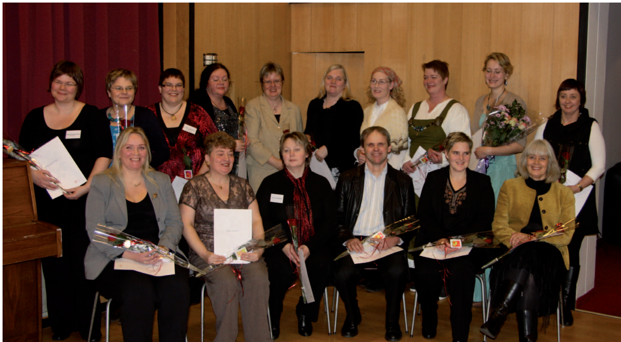
Þátttakendur í verkefninu Vaxtarsprotar á Vesturlandi við brautskráningu í desember 2010.

Venja er að ljúka Vaxtarsprotaverkefninu á hverju svæði með myndarlegri uppskeruhátíð. Á vordögum var haldin sameiginleg uppskeruhátíð Skagfirðinga og Eyfirðinga á Þelamörk og að Breiðabliki á Snæfellsnesi á jólaföstu vegna Vestlendinga. Á þessum hátíðum gera þátttakendur