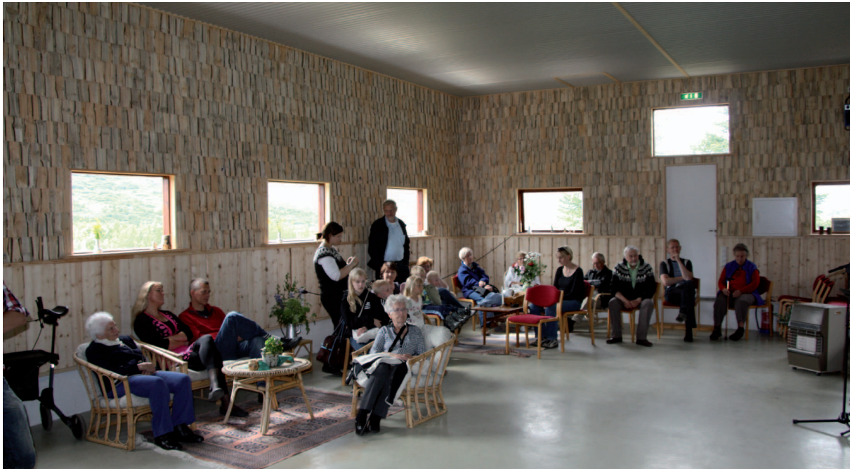
Móttöku- og samkomusalur að Fitjum í Skorradal, klæddur að innan með þilskífum unnum úr eigin skógi ábúanda.