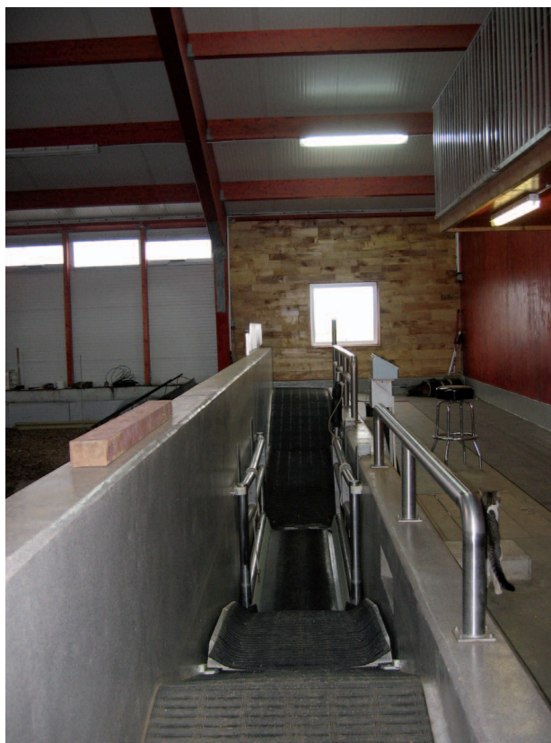
Hestaheilsurækt í Flóanum.

Framleiðnisjóður hefur ekki staðið fyrir viðamiklu kynningarstarfi á starfsemi sinni gegnum árin. Þó hefur hann minnt á tilveru sína með reglubundum hætti í Bændablaðinu auk einstakra auglýsinga. Einnig hefur stjórn sjóðsins gert rækilega grein fyrir störfum sínum og úthlutunum með reglulegri útgáfu ársskýrslu í meira en 20 ár eða frá árinu 1987. Þá hafa önnur tilefni verið nýtt, þegar gefist hafa eða óskað hefur verið eftir kynningu á sjóðnum og starfsemi hans. Einnig heldur sjóðurinn úti vefsíðu á slóðinni www.fl.is þar sem er að finna helstu upplýsingar um sjóðinn, fréttir, ársskýrslur, umsóknareyðublöð o.fl.