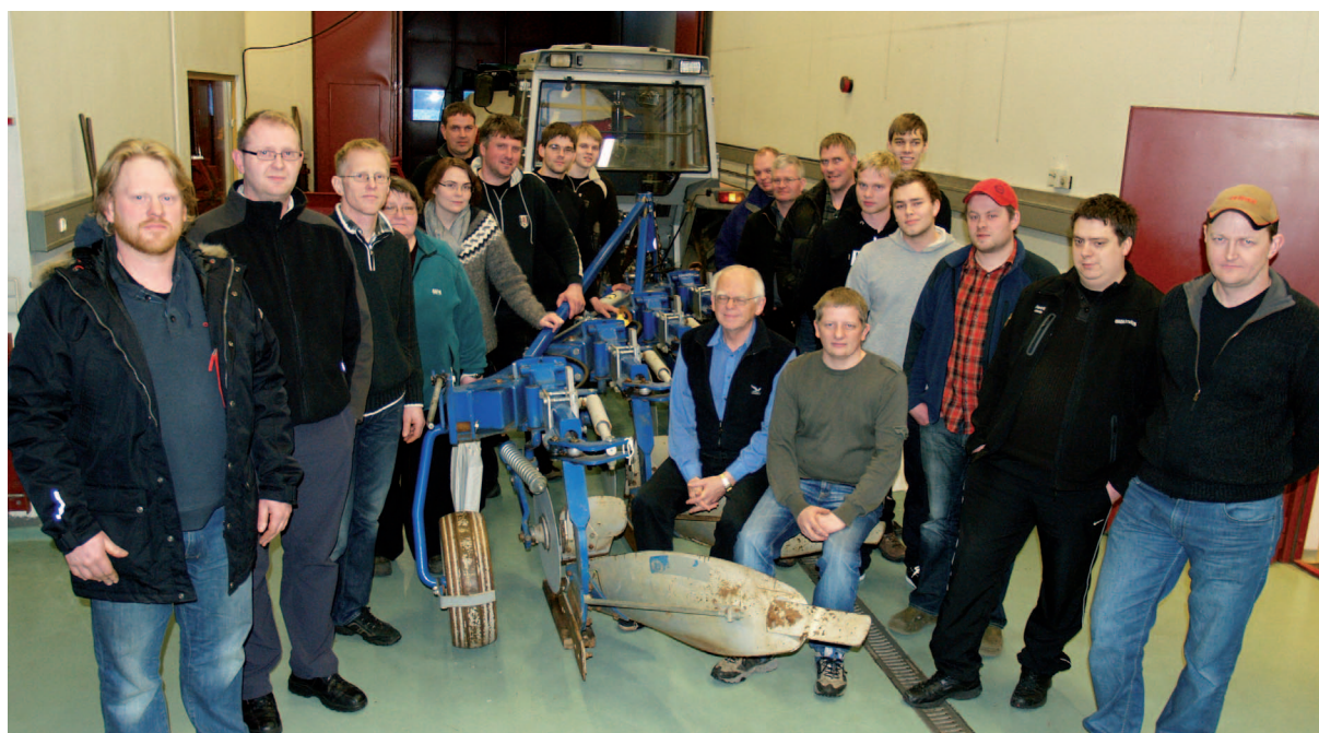
Þátttakendur í Sáðmanninum - námskeiðsröð hjá Landbúnaðarháskóla Íslands.