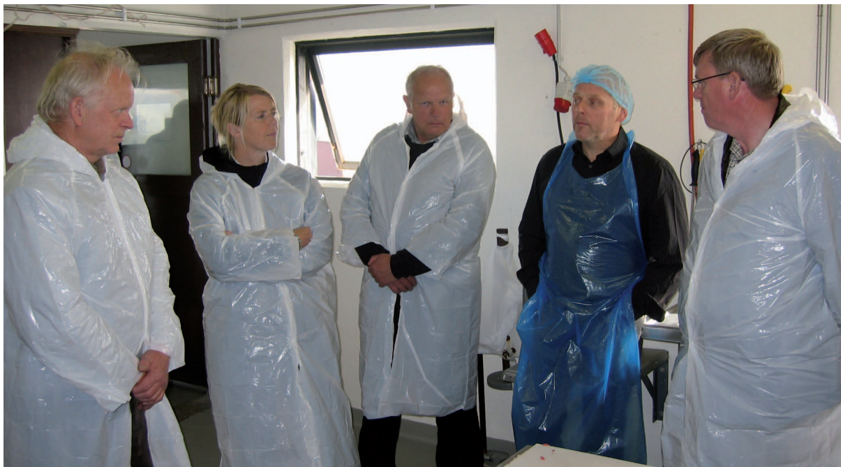
Beint frá býli. Mjólkurhúsinu í Langholstkoti hefur verið breytt í kjötvinnslu.