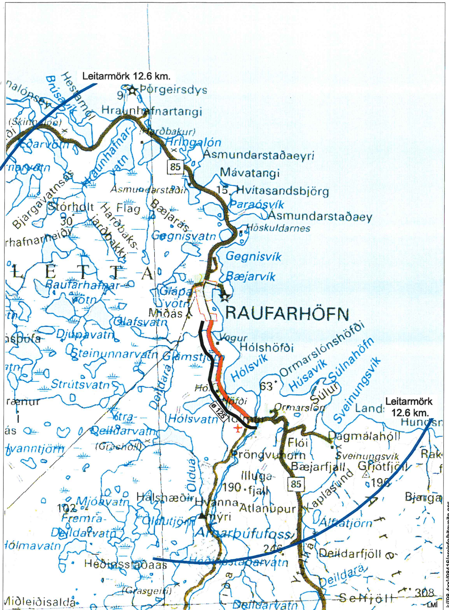
Mynd 3. Raufarhöfn, aðveita.