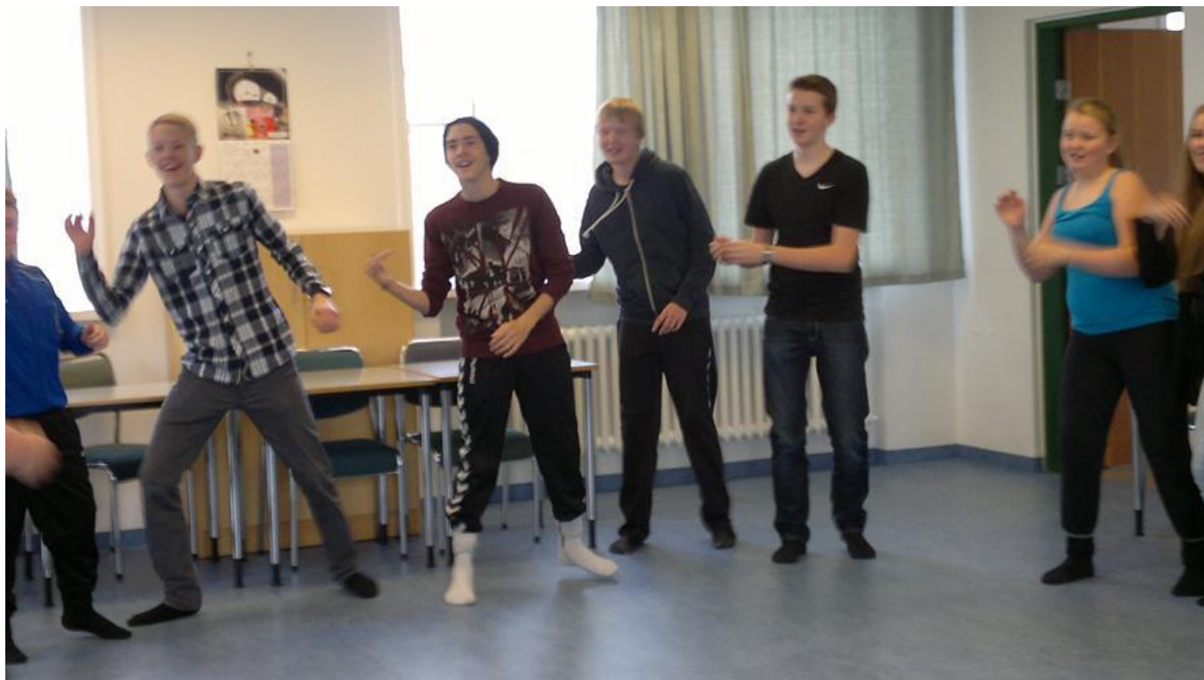
ZUMBADANS UNDIR STJÓRN KENNARA.

Í nýsköpunarhlutanum fá nemendur ákveðið verkefni eða þema til að hafa til hliðsjónar. Nemendur geta fengið frjálssar hendur og unnið út frá þema eða þá að afurðin er ákveðin fyrirfram en leiðin að henni og útlit hennar er undir þeim komin.