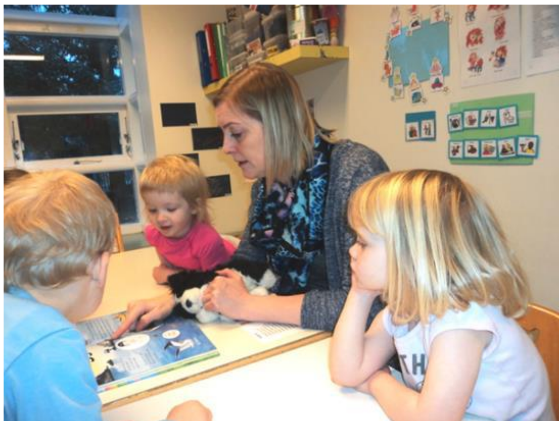
UNNIÐ MEÐ LÆSI Í LEIKSKÓLANUM ÁLFHEIMUM

um málörvun og snemmtæka íhlutun, en skólar og skólapijónusta hafa lagt aukna áherslu á að grípa sem fyrst inn í ef merki eru um einhvern vanda. Hægt er að nálgast lokaskýrsluna á vefsvæði Árborgar, sjá nánar í Árangursríkt læsi í leikskólum Árborgar .