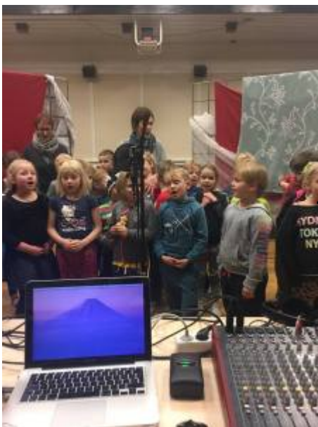
NEMENDUR Í 3. BEKK VIÐ UPPTÖKUR.

Í Grunnskólanum í Borgarnesi eru allir nemendur skólans þátttakendur í verkefninu og tekur undirbúningur jólaútvarpsins þrjár til fjórar vikur. Nemendur yngri bekkja gera sameiginlegan bekkjarþátt og fær hver bekkur úthlutað einum klukkutíma til útsendingar. Þátturinn er hljóðritaður fyrirfram og vinna nemendur undir styrkri leiðsögn kennara sinna sem leggja á sig töluverða vinnu við undirbúninginn. Hér er um fjölbreytta þætti að ræða sem byggjast upp á töluðu máli og söng. Það er alltaf ákveðin eftirvænting og spenna í loftinu meðal nemenda á meðan þátturinn þeirra er sendur út, bekkurinn hlustar saman og enginn má missa af því að hlusta á sjálfan sig og bekkjarfélagana tala eða syngja í útvarpið.