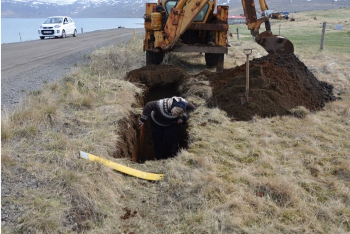
Mynd 6: Birna hreinsar sniðið í skurði 3 (horft til SA).