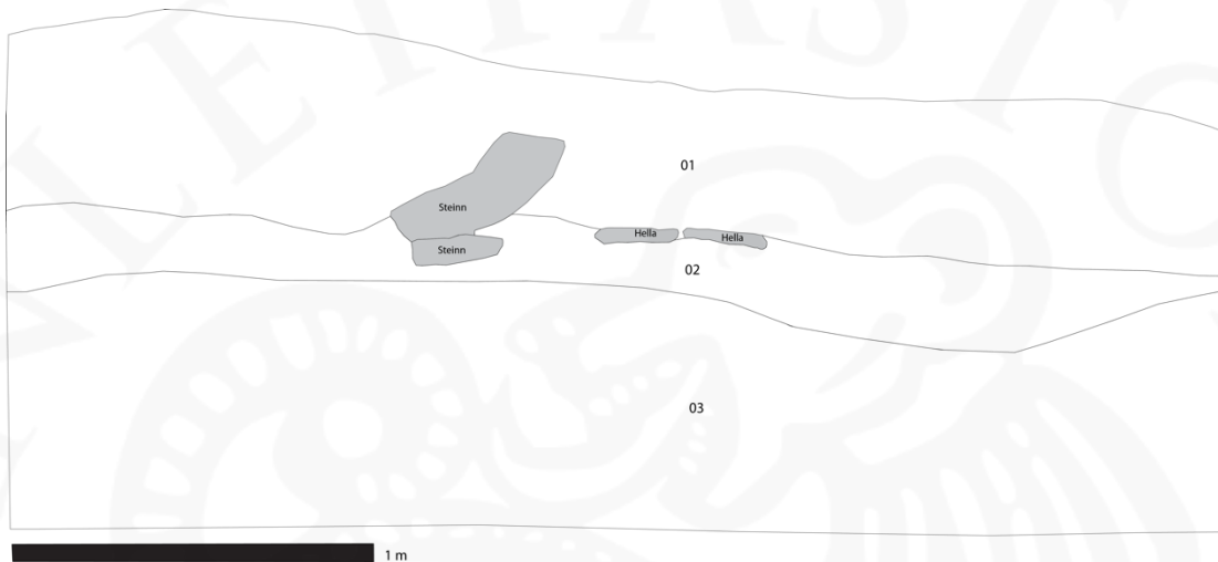
Mynd 3: Vestursnið skurðar 02.

Lag 03: Náttúruleg sjávarmöl, engin mannvist greinanleg.