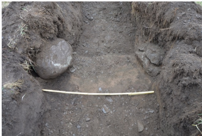
Mynd 2: Mögulegar hleðsluleifar í skurði 1, sem eru mjög raskaðar (mynd tekin í SA).