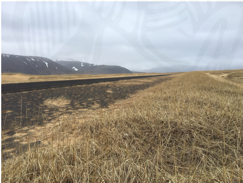
Mynd 8: Horft meðfram flugvelli á fyrirhuguðu vegarstæði til SA.