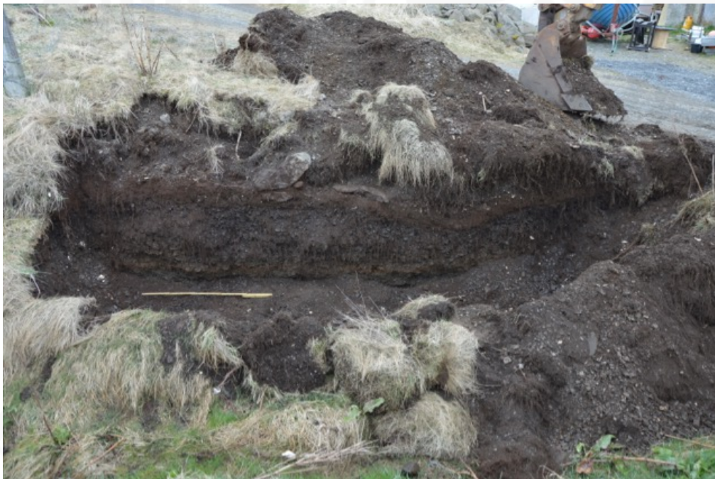
Mynd 4: Skurður 2 (mynd tekin í V).