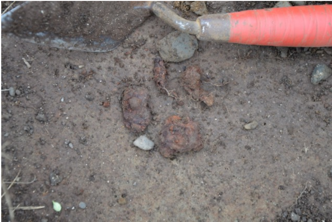
Mynd 5: Rónaglar úr mannvistarlagi 02 í skurði 2.

Í skurði 2 voru ummerki um mannvist í grennd og ekki hægt að staðfesta að komið hafi verið niður á rétt (BA-152:008). Hún gæti hafa staðið fjær vegi eða verið gjöreyðilögð við framkvæmdir. Kol og rónaglar voru í mannvistarlagi 02 sem bendir til þess sem vitað er, að mannabyggð hafi verið skammt frá. Ekki var hægt að aldursgreina þetta lag.