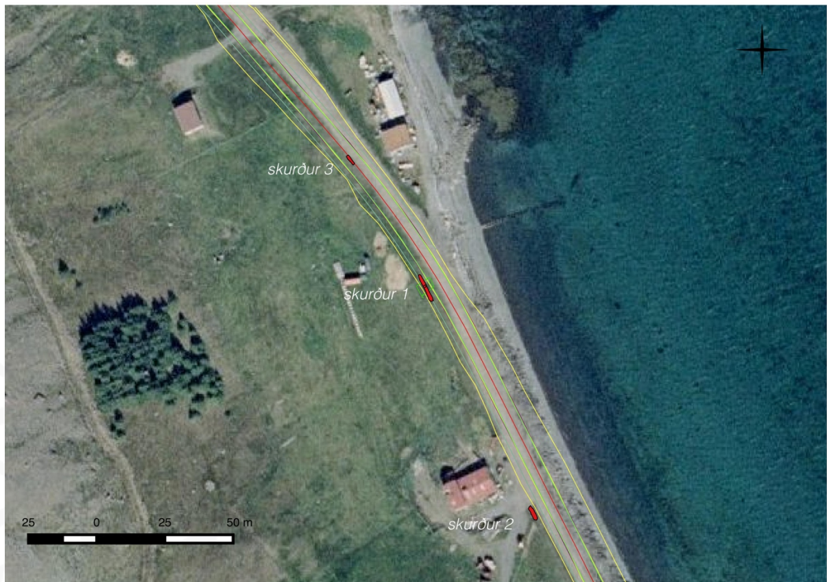
Kort 1: Staðsetning skurða við fyrirhugað vegarstæði