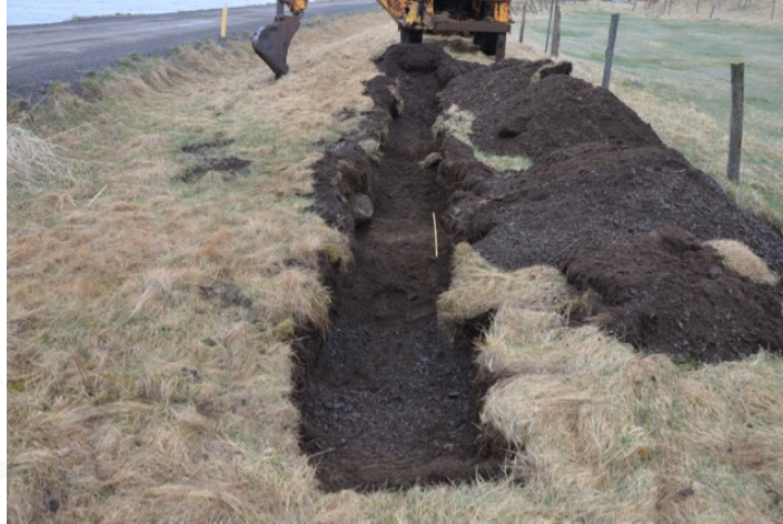
Mynd 1: Skurður 1, skalinn er 1 m (horft í SA).