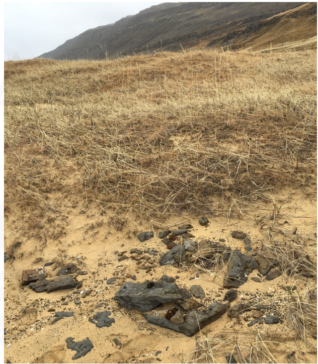
Mynd 9 og 10: Grjót, líklega náttúrulegt, um miðbik svæðis, horft í SV.