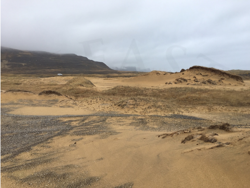
Mynd 7: Sandöldur vestarlega á svæðinu, horft í NV.