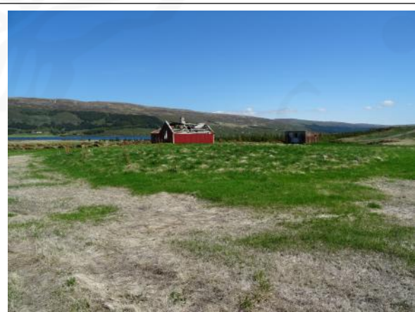
Þúst þar sem útihús 002 var, ofan við íbúðarhús, horft til norðausturs

Samkvæmt túnakorti frá 1918 var útihús um 50 m suðvestan við bæ 001. Engin ummerki sjást um útihúsið lengur en allstór hóll er þar í túninu þar sem ætla má að mannvistarleifar