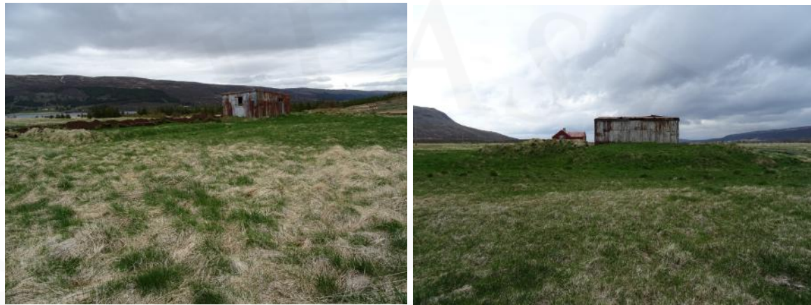
Á vinstri mynd er bæjarhóll 001 og kálgarður, horft til ANA. Á hægri mynd sést ASA-jaðar bæjarhólsins þar sem hann er hæstur, horft til VNV

jörðinni. Þegar aðskráning fornleifa fór fram á jörðinni var verið að grafa skurð fyrir nýrri hitaveitulögn meðfram efri (syðri) brún vegarins og var skurðurinn kominn að vesturjaðri bæjarhólsins en ekki var búið að fara í gegnum hann. Það var gert skömmu síðar og efninu mokað upp á syðri skurðbakkann, upp á hólinn.