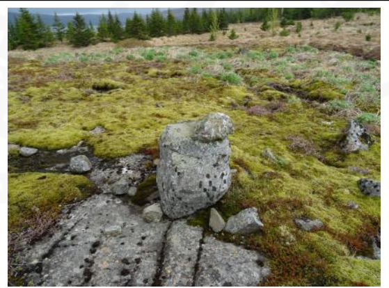
Varða 006 á Vörðuholti, horft til ASA

Holtið er gróðurlítið en syðst er það nokkuð mosavaxið og beggja vegna við veginn og eftir öllu holtinu til norðurs er mikill lúpínugróður.