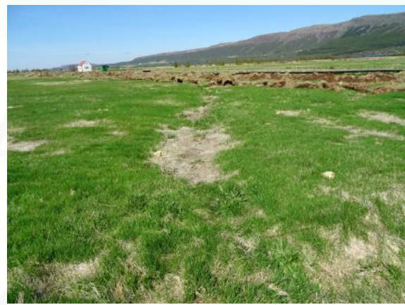
Ummerki um leið 010 í túni, horft til NNV