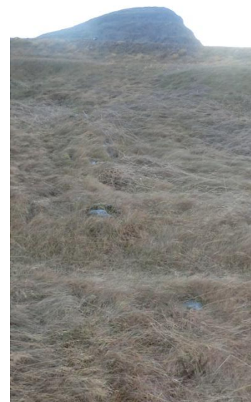
Mynd 7 Sokkið garðlag

Staðhættir Fast við hlið rústar [024] er garður sem liggur fast samhliða rústinni.