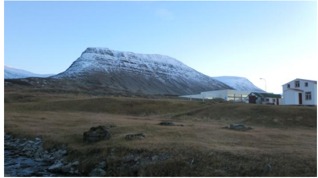
Mynd 3. Leifar rafstöðvarinnar sem reist var árið 1918 og notuð til 1950. Steyptur gafl hússins enn greinilegur.