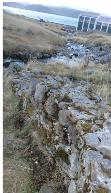
Mynd 2 Minjar frá fyrstu rafstöðinni frá 1911