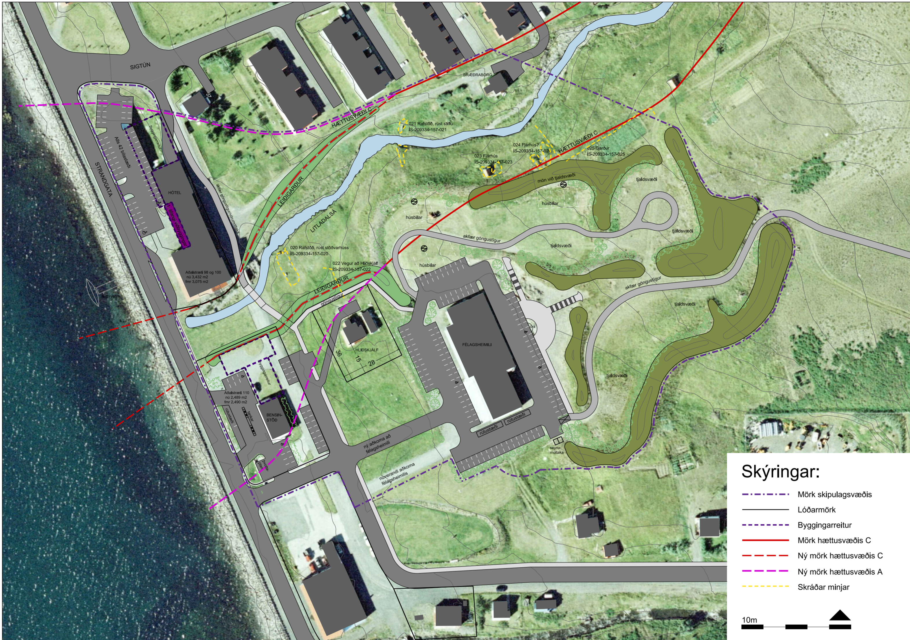
Deiliskipulag hótels og nágrennis, mælikvarði 1 : 1.000