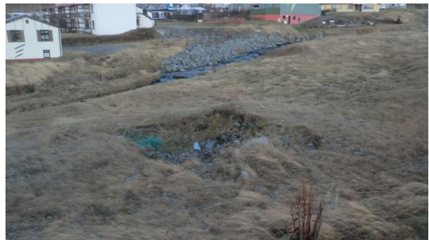
Mynd 7. Niðurgrafin og hlaðin rúst.

öllum líkindum verið útihús. Í frétt í Þjóðviljanum frá 1983 segir Ólafur Helgason „Í gamla daga voru gripahúsin á Geirseyri staðsett við Litladalsá“ 7 .