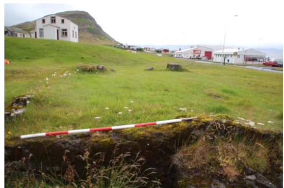
Mynd 3. Leifar rafstöðvarinnar sem reist var árið 1918 og notuð til 1950. Steyptur gafl hússins enn greinilegur.

Rafveitan á Patreksfirði var fullgerð í desember 1918. Aflið er tekið úr svonefndri Litladalsá, sem rennur gegnum þorpið innarlega. Fallhæðin er 55 m. Og vatnsmagnið um 75 litr. á sekúndu. Vatnspípurnar eru um 900 m á lengd, 10 þuml. víðar, og var ætlast til að nota járnsteypupípur í þær en þær fórust á leið til landsins. Það voru síðar keyptar og