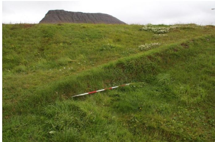
Mynd 5. Upphlaðinn vegur upp í átt að húsinu Hlíðarskjálfi.

Vegurinn var ljósmyndarður og mældur inn með Trimble pro uppmælingartæki. Vegurinn er samtíma húsinu Hlíðarskjálfi.