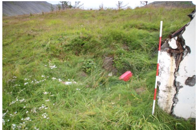
Mynd 6. Útihús og hlaðið hólfi til hliðar.

Staðhættir: Um 100 metra norðaustur af grunni rafstöðvarinnar og 20 metra suðaustur af Litladalsá er fjánhús. Í frétt í Þjóðviljanum frá 1983 segir Ólafur Helgason „Í gamla daga voru gripahúsin á Geirseyri staðsett við Litladalsá“ 6 .