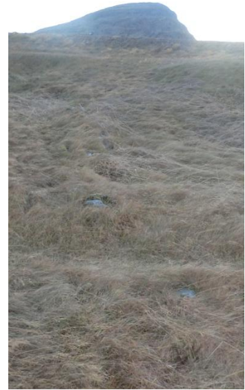
Mynd 8. Sokkið garðlag.

Staðhættir: Fast við hlið rústar [024] er garður sem liggur samhliða rústinni.