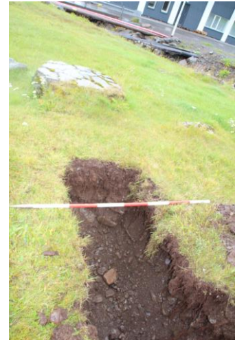
Mynd 4. Skurður við grunn rafstöðvar.

Minjalýsing: Grunnur þessarar rafstöðvar er enn merkjalegur á yfirborði. Steyptur gafl næst Litludalsá er 1 ½ metri á hæð. Grjót úr undirstöðum hússins er líka á yfirborði. Húsið hefur verið ílangt og er grunnurinn 16 metrar á lengd og 5 metrar á breidd.