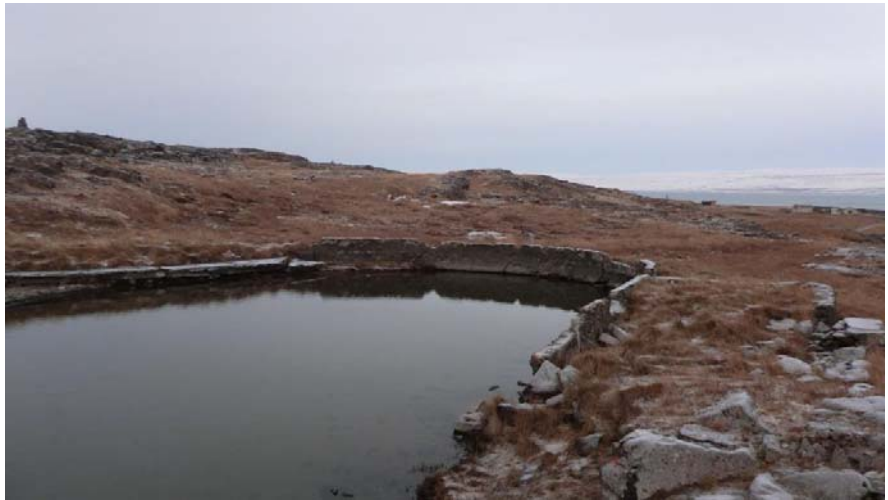
MYND 4. GAMLA SUNDLAUGIN Á REYKJANESI, HEFUR Í UPPHAFI VERIÐ TORFHLADIN EN AÐ LOKUM STEIPT. GRUNNUR HÚS SEM VAR BÚNINGSKLEFAR SÉRST Á MYDINN

grjóthleðslur. Húsið sem þarna stóð var flutt og stendur við höfnina í dag. Húsið er friðlýst bygging.