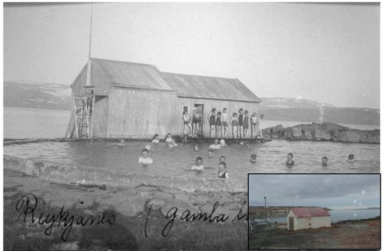
MYND 5. GÖMUL LJÓSMYND AF SUNDLAUGINI OG BÚNINGSHÚSI. Á INNFELDU MYNDINI SÉST SAMA HÚS SEM NÚ STENDUR VIÐ HÖFNINA Á REYKJANESI. ELDRI MYNDINN ER FRÁ HÚSAFRÍÐUN RÍKISINS