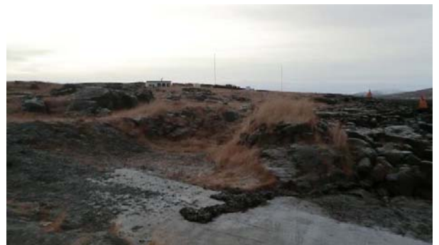
MYND 1. HLAÐIÐ NAUST. MYNDIN ER TEKIN Í SUÐUR

Minjalýsing Naustið er hlaðið út grjóti og er ekki mikið hrunið, Veggir eru hæstir um 1,30 m og rústin mælist 14 metrar á lengd og 9 metrar á breidd að utanmáli. Rústin er opin til norðurs.