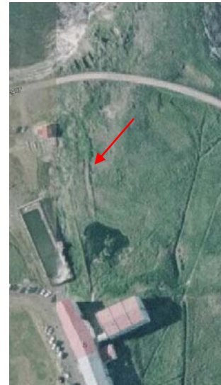
MYND 12. GARÐLAG Á HITASVÆÐINU

Minjalýsing Á svæðinu má greina garðlag sem jafnframt sést vel á loftmyndum. Garðurinn er 92 metrar á lengd og liggur frá hvernum við hlið núverandi sundlaugar og í átt að sjónum. Garðurinn er um 40-50 cm á hæð og gróinn.