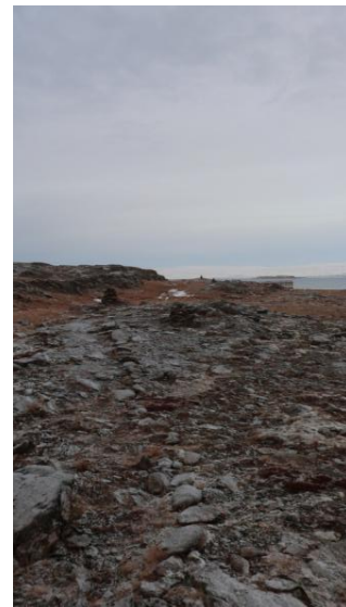
MYND 7. VÖRÐUR SEM LIGGJA Í ÁTT AÐ SKÓLAHÚSUNUM

Staðhættir Frá gömlu sundlauginni í suðurátt til skólahúsanna liggur stígur [005] þessi stígur er varðaður.