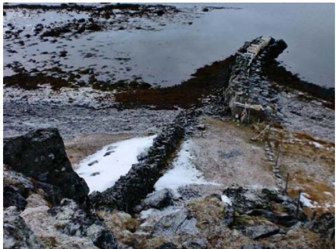
MYND 14. GAÐLAG HLUTI AF [038] NIÐUR Í FJÖRUBORDINU

Staðhættir Þar sem Reykjanesið byrjar um 3 km suður af skólahúsunum er garður sem er landamerkjagarður og liggur þvert yfir nesið [038]. Þar stoppar sá garður þar sem brattir klettur eru niður í fjöru. Við tekur garðbútur að fjörunni og er hluti af lengri garðinum [038] en er rofinn af klettum.