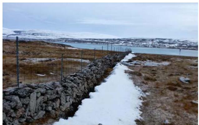
MYND 13. GARÐURINN SEM LIGGUR YFIR REYKJANES