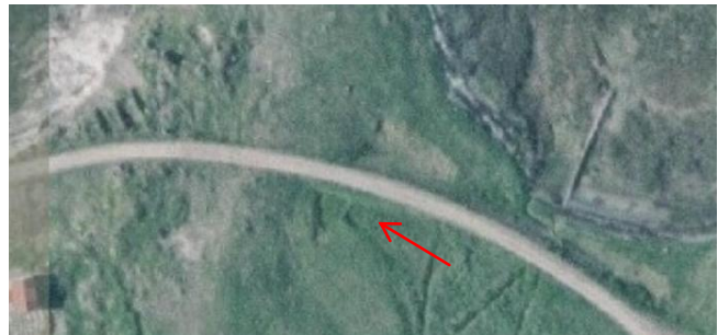
MYND 11. NIÐURGRÖFTUR HUGSANLEGA MINJAR EFTIR UMRÆDDAN KARTÖFLUGARÐ

Staðhættir á loftmynd sést ferkantaður niðurgröftur sem er skorinn af vegi.