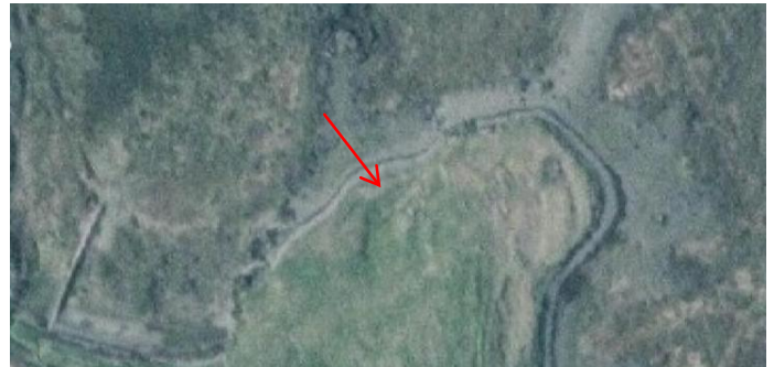
MYND 10. FERKANNTAÐUR NIÐURGRÖFTUR.

Staðhættir á loftmynd sést ferkantaður niðurgröftur.