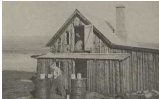
MYND 9. LJÓSMYND AF HÚSI Í ÆÐEY SEM TALID ER AÐ HAFI VERIÐ FLUTT FRÁ SALTVERKINU Á REYKJANESI.

stórt salthús og geymsluhús handa sjó. Þar var sjórinn geymdur í stóru trogi, það var 26 fet á lengd, 18 fet á breidd og 6 fet á dýpt 8 “.