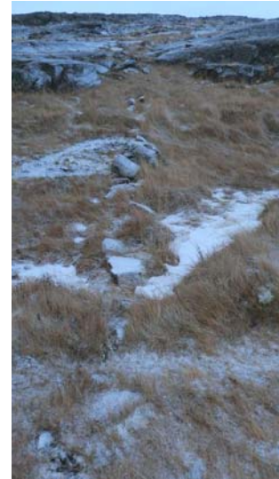
MYND 8. GARÐLAG SEM HUGSANLEGA ER UNÐAN GIRÐINGU

Minjalýsing Hleðslan er einföld grjótröð sem liggur þvert á stíginn og niður klettana í átt að sjónum, hugsanlega er þetta hleðsla undan girðingu, frekar en garður.