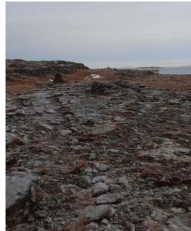
MYND 6. GARDUR OG VÖRÐUR SEM LIGGJA FRÁ GÖMLU LAUGINNI Í ÁTT AÐ SKÓLAHÚSUNUM

Gerðar hafa verið tröppur upp brekkuna með grjóti til að auðvelda uppgöngu og síðan tekur við stígur þar sem grjóti hefur verið raðað til þess að merkja leiðina en einnig er leiðin vörðuð. Stígurinn er um 300 metrar á lengd og liggur í áttina að skólahúsunum.