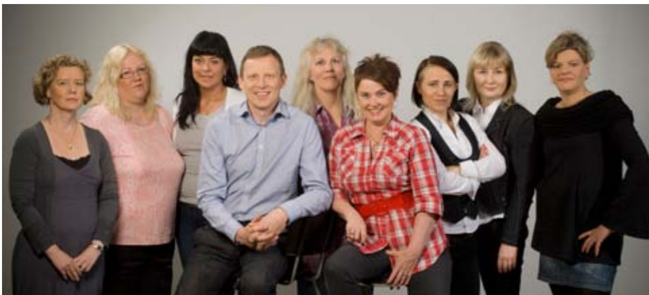
Stjórn og starfsmenn FÍ 2010 – 2011

okkar starf byggir á, nokkuð sem við þurfum að hafa í huga á hverjum degi núna þegar harðnar á dalnum hjá sveitarfélögum og ríki. Við þurfum að muna að félagsráðgjafar eiga að vinna gegn mannréttindabrotum hvar sem þau eiga sér stað og réttindi skjólstæðinga okkar eiga að vera mikilvægari heldur en fjárhagsstaða vinnuveitandans. Við erum umboðsmenn þeirra sem minna mega sín. En við þurfum einnig að hlúa að okkur, huga að vinnuálagi, fjölda mála og þyngd þeirra. Atvinnuumhverfið okkar má ekki vera þannig að við brennum upp, að okkar nýútskrifaða unga fólk hverfi á braut eftir skamma dvöl í faginu vegna þess að það gat ekki haldið þetta út, kannski vegna þess að það fékk ekki þann stuðning sem þurfti. Stjórn FÍ hefur farið ýmsar leiðir til að styðja ykkur, kærufélagsmenn. Við höfum reynt að virkja ykkur með því að finna þá samnefnara sem geta hjálpað ykkur að treysta böndin milli hvers annars og geta þannig stutt hvert annað. Fag- og landshlutadeildir félagsins eru ein leið til að finna þessa samnefnara. Þær eru eins og æðakerfi félagsins þar sem gróskumikið starf þessara deilda ber vitni um þann sprengikraft sem