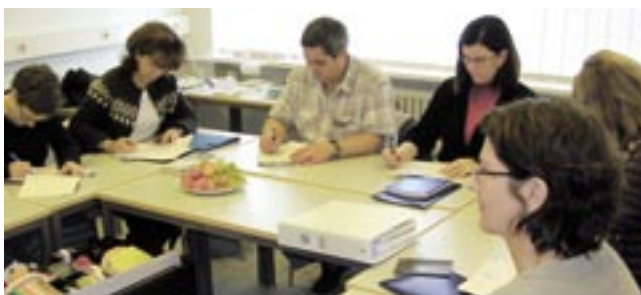
Önnum kafnir þátttakendur í verkstæðinu Verkfærakista háskólakennara

Í kjölfar námskeiðsdags var nýjum kennurum boðið að sækja námskeið og kynningar á vegum Kennslumiðstöðvar, en á hverju misseri stendur Kennslumiðstöð fyrir fjölmörgum námskeiðum sem tengjast kennslufræði háskólakennslu og notkun upplýsingatækni í kennslu. Slík námskeið eru mörg hver hagnýt og gefa góða innsýn í fjölbreytta kennsluhætti. Að auki var boðið upp á upptökur af kennslu, miðsvetrarmat og leiðsögn leiðbeinanda.