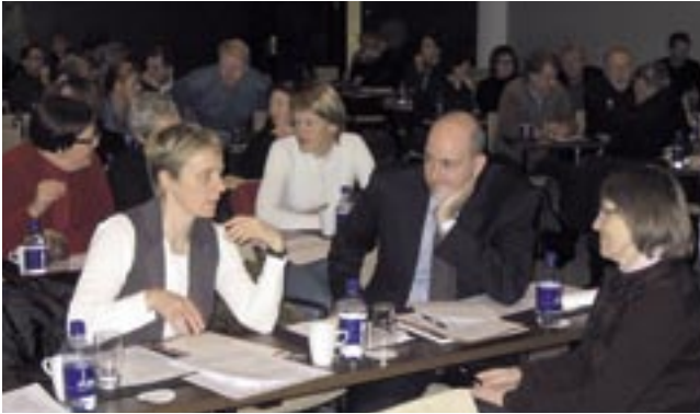
Umræður um námsmat

stigi. Þessar reglur gefa góðar vísbendingar um hvers er að gæta við mat á námi s.s. áhrif væntinga kennara til nemenda á námsgengi þeirra og mikilvægi þess að koma til móts við fjölbreyttan nemendahóp. Ein af meginreglum snýr að mikilvægi skjótrar endurgjafar og benti Rust á að það skipti engu máli hversu mikla alúð kennarar legðu í endurgjöf á verkefni nemenda ef nemendur fengju hana mjög seint væru allar líkur á því að þeir væru komnir í önnur verkefni. Endurgjöfin missir þá marks og leiðbeining kennara er unnin fyrir gíg.