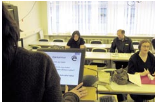
Upptaka á kennslu með notkun eMission