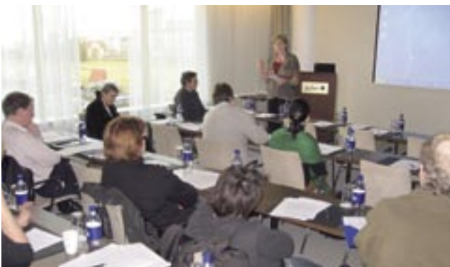
Þátttakendur á málstofunni Viðmið um prófgráður – leiðarljós við námsmat?

Að inngangserindum loknum hófust málstofur um námsmat sem skipulagðar voru af kennurum hinna ýmsu deilda. Málstofurnar voru hinar fjölbreytilegustu. Kynnt var reynsla af námsmati og kennsluáðferðum í lagadeild og í dæmisögukennslu í viðskipta- og hagfræðideild. Fjallað var um verkleg próf í klínísku námi í læknadeild og tilraunir til að leyfa valfrelsi í verkefnum í verkfræðideild. Skilgreiningar á einkunnakvarða í hugvísindadeild voru ræddar ásamt ýmsum álitamálum um námsmat á sviði uppeldis- og menntunar. Þá voru viðmið um prófgráður og námsmat í ljósi þeirra umfjöllunarefni í tveimur málstofum.