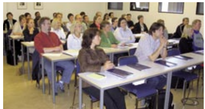
Góð þátttaka var á námskeiðinu

misserslangt námskeið fyrir nýja kennara. Námskeiðið var sérstaklega ætlað kennurum sem nýlega höfðu fengið fastráðningu sem og stundakennurum í fullu starfi við háskólakennslu. Helsta markmiðið með námskeiðinu var að styrkja nýja kennara í starfi og veita þeim innsýn í kennslufræði háskólakennslu. Námskeiðið var í umsjón Kennslumiðstöðvar í samstarfi við kennslusvið, kennslumálanefnd háskólaráðs og deildir.