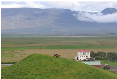
Mynd 4. Bjarnhöttur á Reynistað. Hólinn má flokka sem féþúfu, haug eða álagablett.

Á Reynistað má finna hólinn Bjarnhött. Um hólinn ganga þau munnmæli að þar sé grafið skip eða gullkista. Vestan í hólnum er brekka og sagan segir að þar hafi verið reynt að grafa og þá kom í ljós stór kista. Þeir sem grófu komu bandi í hring á kistulokinu en þegar þeir ætluðu að hífa kistuna upp sýndist þeim bærinn og kirkjan standa í ljósum logum. Þeir hlupu til, en þegar þeir sneru aftur á hólinn var