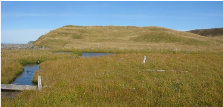
Mynd 1. Búðarhóll á Höfðastönd. Brekkuna sunnan við hólinn (sem liggur niður að fjöru) mátti ekki slá, því þá átti bóndi að verða fyrir skepnutjóni.