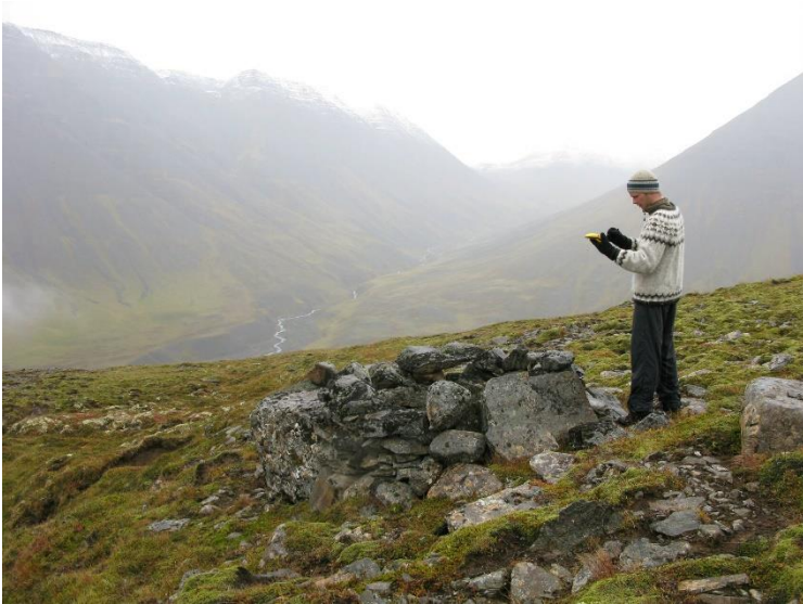
Mynd 6. Frá smalabyrginu á Akradal er víðsýnt, eins og fram kemur í næstu sögu. Á myndinni er horft fram Heimdal í þokumóðu. Tungufjall er til hægri og Tungufjallsáinn rennur eftir dalbotninum að ármótum við Djúpadalsá.