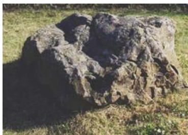
Mynd 5. Álfasteinn í Lyngholti. Steinninn var látinn í friði þegar nýtt hús var byggt í Lyngholti, til öryggis.

Af lýsingum að dæma þótti lítil munur á lifnaðarháttum huldufólks og manna. Huldufólk fæddist og dó, en taldist langlífara en menn. Dægradvöl þeirra var sú hin sama og í mannheimum, þeir stunduðu sinn búskap, borðuðu, drukku og