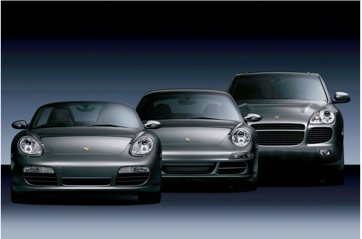
Porsche Boxster, 911 og Cayenne.