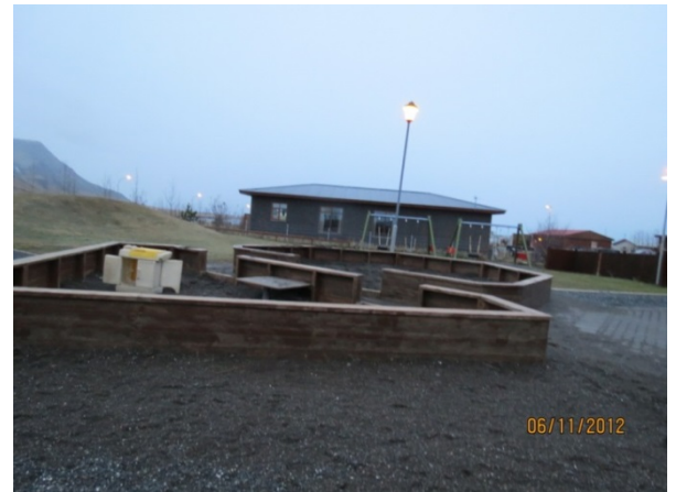
Mynd 2. Sandkassinn

Svipuð umræða átti sér stað um myndirnar sem teknar voru af leiktækjum sem börnin töldu að þyrftu ekki að vera á leikskólalóðinni. Börnin bentu á að rólurnar þyrftu ekki að vera vegna þess að þær væru leiðinlegar en þau vildu frekar hafa annars konar rólu. Börnunum þótti klifurgrindin einnig óþörf vegna þess að hún væri lítið notuð og það væri mjög erfitt að klifra í henni. Myndir 3 og 4 sýna dæmi um ljósmyndir sem börnin tóku af leiktækjum sem þeim þótti óþörf á leikskólalóðinni.