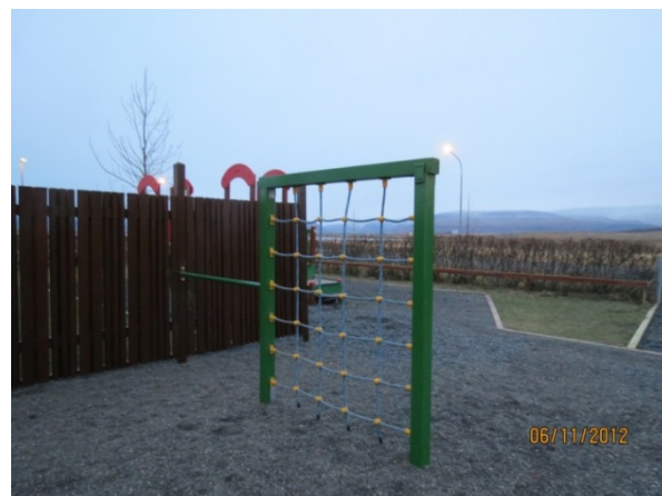
Mynd 4. Klifurgrindin

Þegar börnin höfðu tekið myndir af leikskólalóðinni var þeim boðið að koma með hugmyndir að því hvernig þau sæju fyrir sér nýja leikskólalóð. Til þess að koma hugmyndum sínum á framfæri teiknuðu börnin myndir af því sem þau sáu fyrir sér að gæti átt heima á lóðinni þeirra í framtíðinni. Tvö börn teiknuðu „kóngulóarólu“ og ein stúlknanna lýsti henni svona: „kóngulóaróla er ein stór róla sem margir geta setið ofan í“. Einn drengjanna teiknaði hjólastíg með beygju vegna þess að það var bara hægt að hjóla fram og tilbaka á hellulagðri stétt sem lá meðfram leikskólabyggingunni. Ein stúlknanna teiknaði leikskólaskóg og sagði: „það væri gaman að hafa mörg tré og gera leikskólaskóg, í einu trénu á að vera kofi. Það væri líka gaman að geta hjólað í gegnum skóginn.“ Myndir 5 og 6 sýna dæmi um teikningar barnanna.