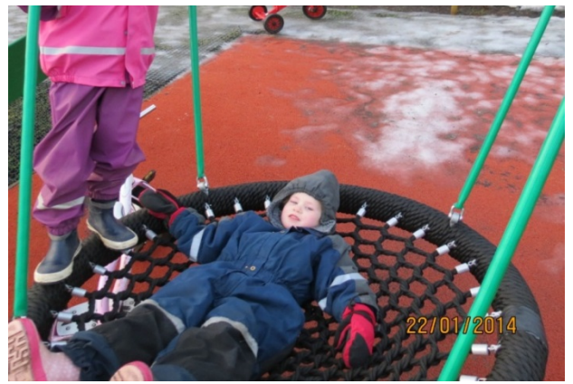
Mynd nr. 8 Kóngulóarála

Ekki var hægt að uppfylla allar óskir barnanna til dæmis höfðu þrjú þeirra teiknað svokallaða aparólu sem þótti ekki hentug á leikskólalóðina. En þegar lagðar voru saman hugmyndir barnanna, starfsfólks leikskólans og hönnunaraðila var niðurstaðan að þeirra mati vel heppnuð leikskólalóð þar sem börn og starfsfólk una sér vel í leik og starfi.