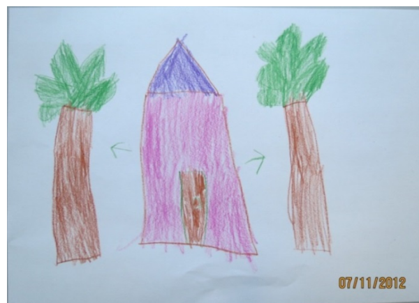
Mynd 6. Leikskólaskógur