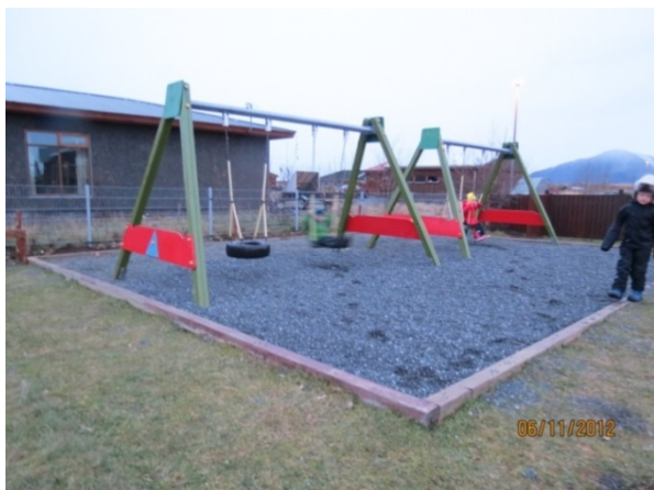
Mynd 3. Rólurnar