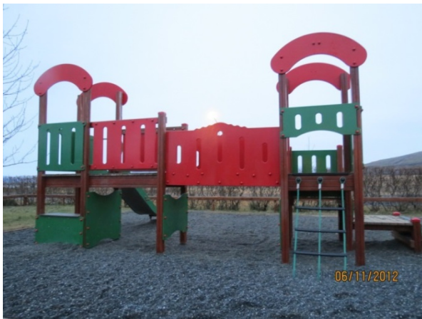
Mynd 1. Kastalinn

Myndirnar sem börnin tóku voru meðal annars af leiktækjum á leikskólalóðinni, öðrum börnum og moldarholu í jörðinni sem þeim fannst þurfa að laga. Á meðan börnin gengu um og tóku myndir ræddu þau hugmyndir sínar hvort við annað og leikskólakennarann. Þau sögðu frá myndunum sínum og af hverju þau tóku þær þannig rökstuddu þau oftast hugmyndir sínar. Til dæmis þegar börnin ræddu um mikilvægi þess að hafa kastalann á lóðinni (mynd 1) sagði önnur stúlkanna: „Við þurfum að hafa kastalann til þess að renna og leika Gulleyjuna”. Börnunum þótti einnig mikilvægt að hafa sandkassann (mynd 2) áfram þó að þau notuðu hann lítið eins og einn drengjanna benti á. Hann sagði að sér þætti leiðinlegt að leika sér í sandkassanum en hann þyrfti samt að vera áfram vegna þess að mörg önnur börn léku sér þar. Myndir 1 og 2 sýna dæmi um myndir sem börnin tóku af þeim leiktækjum sem voru á leikskólalóðinni og þau töldu mikilvægt að hafa þar áfram.