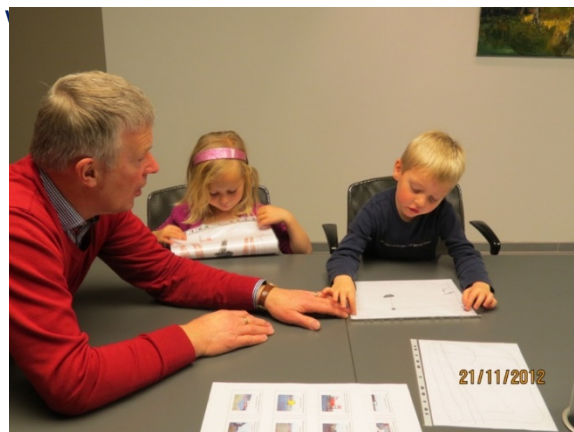
Mynd nr. 8 Drengur segir frá hugmynd sinni

Annar drengjanna var frekar óðruggur fyrir fundinn og baðst undan því að tala. Leikskólakennaranum þótti það sjálfsagt en þegar stelpurnar tvær höfðu lokið máli sínu sagði þessi sami drengur: „má ég tala núna?“ Hann vildi þá segja frá hugmyndinni sem hann hafði teiknað. Hann sýndi því skipulagsfulltrúanum myndina sína af aparólu og útskýrði hvernig hún virkar og virtist ánægður með að hafa tekið til máls. Þá átti einn drengur eftir að fá orðið en hann sýndi teikningar af hugmynd sinni um að gera hjólastíg með beygju. Skipulags-og byggingafulltrúinn hlustaði áfram af áhuga á börnin og gaf sér tíma til að hlusta á hvert og eitt þeirra og spurði þau alltaf nánar út í hugmyndir þeirra. Í lokin sagði hann: