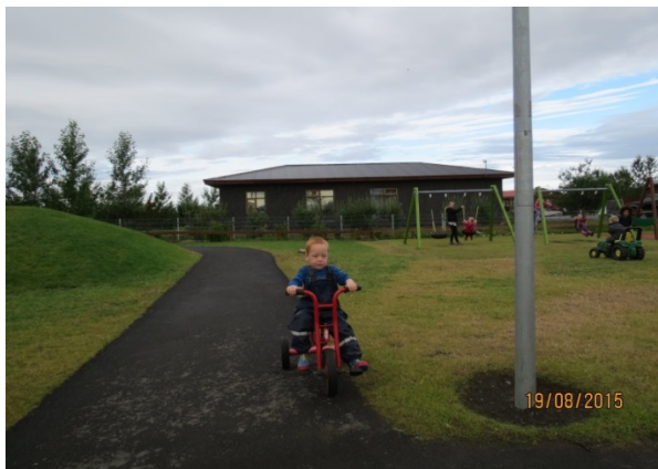
Mynd nr. 7 Hjólastígur með beygju

Leikskólalóðinni var breytt sumarið 2013 og margar af hugmyndum barnanna voru teknar til greina og nýttar við framkvæmdirnar. Meðal annars fengu börnin kóngulóarálu á leikskólalóðina sem hefur verið mikið notuð en gömlu rólurnar voru ekki fjarlægðar þrátt fyrir að börnunum fyndist þær leiðinlegar. Lagður var hjólastígur með beygju og fleiri tré voru gróðursett. Klifurgrindin sem börnunum þótti óþörf var tekin burt og aðrar minni klifurgrindur settar í staðinn. Myndir 7 og 8 sýna dæmi um hugmyndir barnanna sem teknar voru til greina og nýttar.