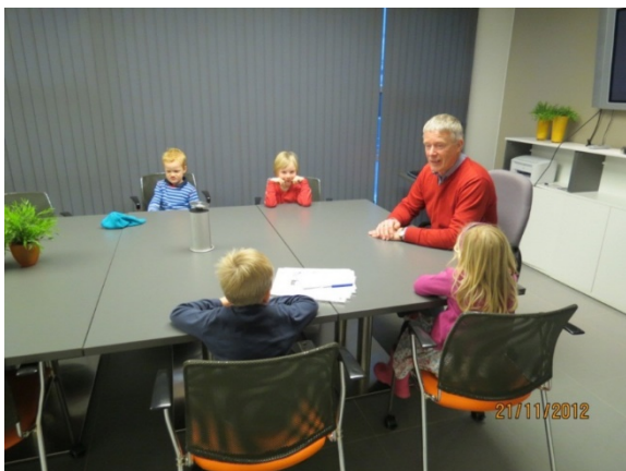
Mynd nr. 7 Fundur með skipulags-og byggingafulltrúa.

Í anda áherslunnar á að vinna frekar með hugmyndir barna og birta þær í samfélaginu, helst þannig að þær hafi áhrif, var pantaður fundur fyrir börnin með skipulags- og byggingafulltrúa sveitarfélagsins. Börnin fjögur, sem voru þátttakendur í verkefninu, ásamt leikskólakennara sínum voru boðuð á fund hans í nóvember 2012. Þau voru boðin velkomin í fundarsalinn og fengu sér sæti ásamt skipulags-og byggingafulltrúanum. Á meðan fundinum stóð fylgdist leikskólakennarinn með því sem fram fór, veitti börnunum stuðning þegar á þurfti að halda, skráði hjá sér það sem sagt var og tók myndir. Börnin voru búin að undirbúa sig þannig að þau skiptu með sér hlutverkum þar sem þau fóru yfir þarfagreininguna sína. Ein stúlkan ræddi meðal annars um og sýndi myndirnar af þeim hlutum sem voru á leikskólalóðinni og börnin töldu að ætti að vera þar áfram. Önnur stúlka gerði slíkt hið sama um það sem var á lóðinni og þyrfti ekki að vera þar. Skipulags- og byggingafulltrúinn hlustaði á stelpurnar af athygli og sýndi hugmyndum þeirra áhuga með því að svara þeim og spyrja nánar út í þær. Myndir 7 og 8 sýna börnin á fundinum.