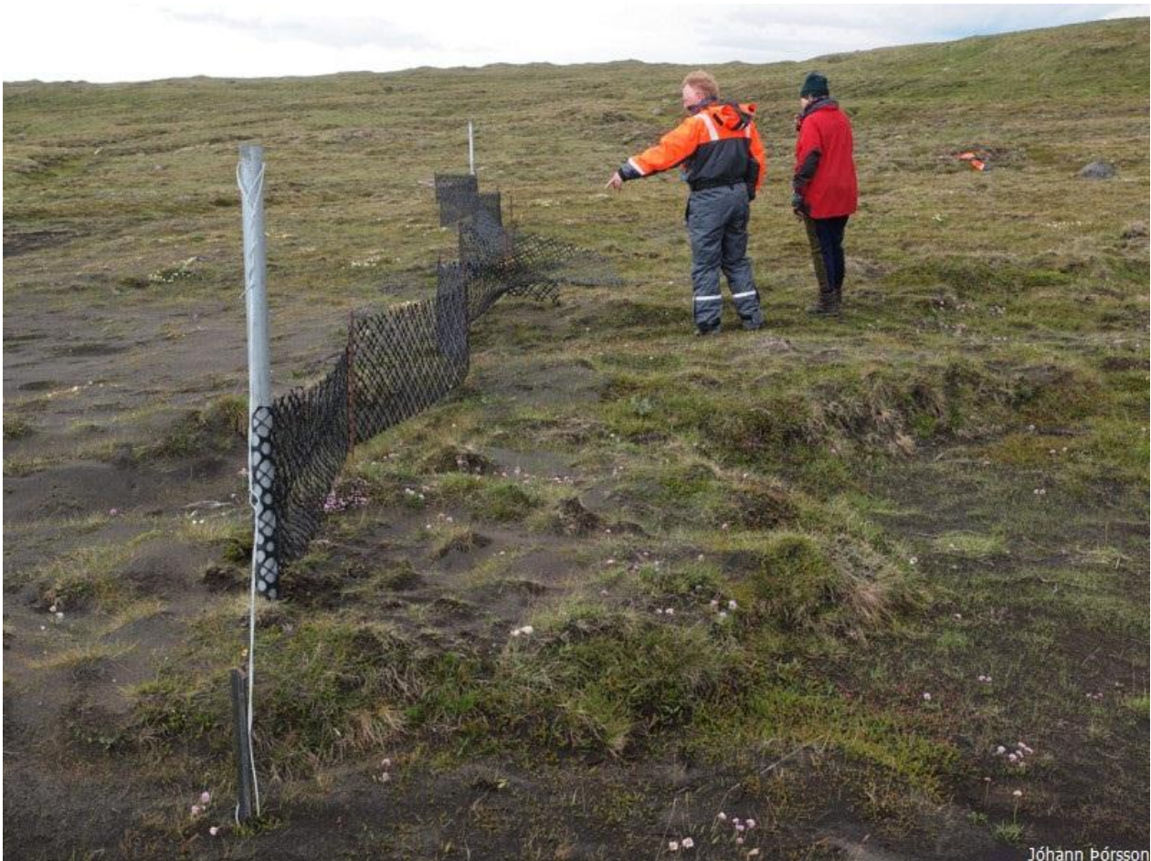
Mynd 1. Fokgirðing sunnan Hrauka

Farið var með öllum fokgirðingum í Kringilsárrana sem og norðan Kringilsár. Lítið sem ekkert þurfti að lagfæra girðingarnar að undanskilinni plastgirðingu sem sett var upp sunnan Hrauka sumarið 2013. Plastnetið hafði gefið sig á einum stað og var því skipt út fyrir nýtt net.