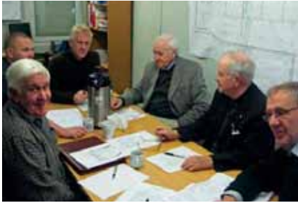
Byggingarnefnd Sléttuvegar 29-31 á fundi 2010.