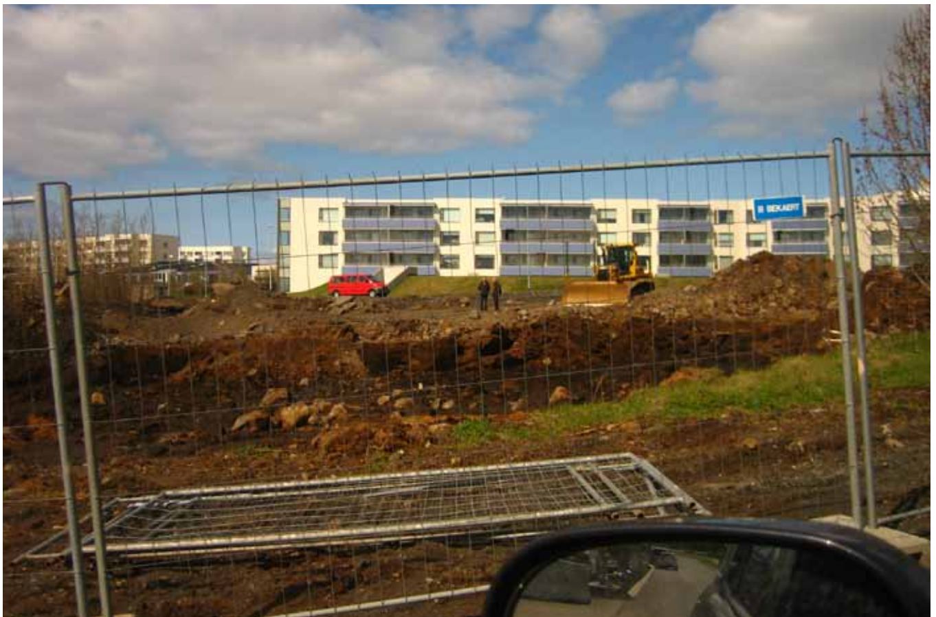
Upphaf framkvæmda á Sléttuvegi 29-31.

Samtök aldraðra þakka innilega fyrir gott samstarf um leið og þau vænta farsælli niðurstöðu lóðamála og að Samtök aldraðra eigi minnst önnur fjögurtíu ár lífvænleg í Reykjavík.