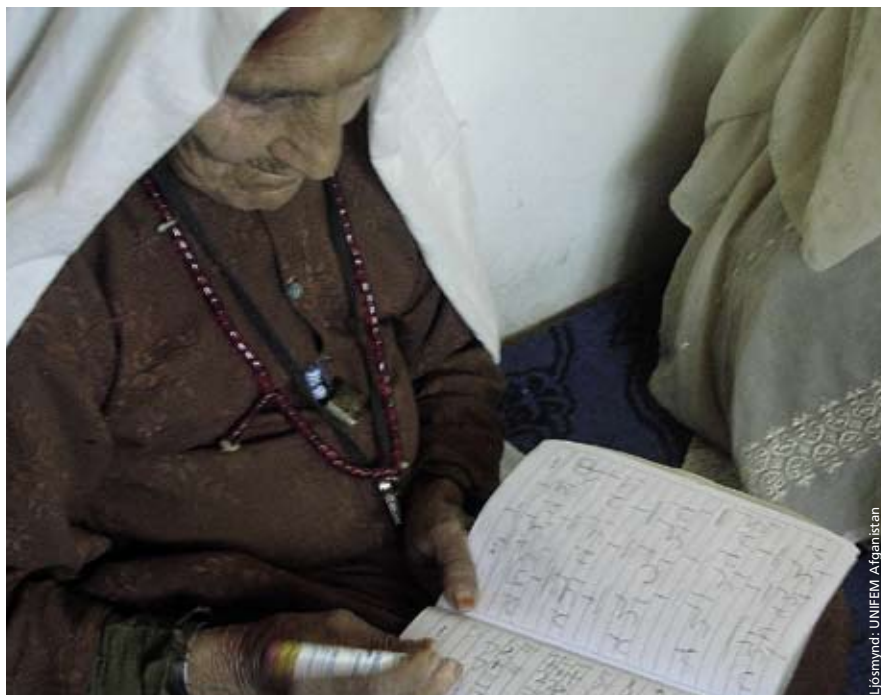
Aldrei of seint. Eldri kona í hreyfanlegu kvennamiðstöðinni í Hizatkhal.

UNIFEM leggur áherslu á að virkja þátttöku kvenna í efnahagslegri þróun í sveitum landsins í gegnum héraðsskrifstofur og kvennamiðstöðvar. Hluti af því er að styrkja vinnu afganska kvennamálaráðuneytisins og aðstoða við að útfæra aðgerðaáætlun fyrir konur í Afganistan. Aðgerðaáætlunin, sem er stefnumarkandi, hefur verið samþykkt og á að koma til framkvæmda snemma árs 2009. Þar eru sett fram heildstæð úrræði sem eiga að stuðla að bættri stöðu kvenna og munu koma afgönsku samfélagi til góða. Mikilvægt er að styrkja samstarf kvenna sem starfa að efnahagslegri framþróun í grasrótinni við stærri stofnanir og ríkisstjórnina. Auk þess er brýnt að fræða konur um borgaraleg réttindi sín og þörf á að styrkja verklag sem stuðlar að aukinni þátttöku kvenna í samfélags- og efnahagslegri friðaruppbyggingu.