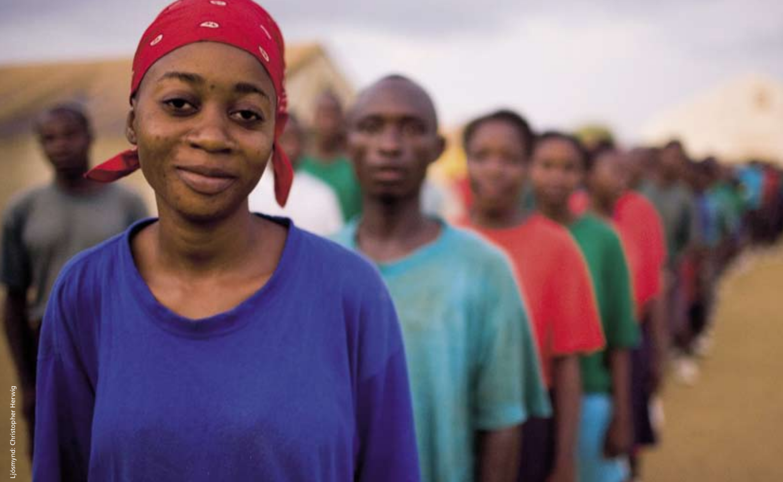
Ung kona og bekkjarfélagar hennar í Lögregluskólanum í Monróvíu hefja daginn á morgunæfingum.

fyrstu konuna til að gegna því embætti í sunnanverðri Afríku. Hvaða áhrif hefur staða hennar haft á konur og þá sem berjast fyrir bættum réttindum kvenna? „Það hefur augljóslega áunnist mikið við að fá fyrsta kvenforseta Afríku. Þrátt fyrir að Johnson-Sirleaf sé afar hæf og merk kona, held ég að hún geti algjörlega þakkað konum Líberíu og kvannahreyfingunni sem myndaðist í stríðinu fyrir stöðu sína í dag. Hún gerir sér líka fyllilega grein fyrir því og leggur áherslu á ofbeldismálin, sem og læsi kvenna, í sinni stefnuskrá. Konur hafa öðlast vissa virðingu eftir stríðið og trú á sjálfar sig sem stjórnendur. Hins vegar er það mótsagnakennt að tala um virðingu í garð kvenna þegar ofbeldi gegn þeim er jafn algengt og raunin er í Líberíu. Þess vegna vil ég leggja áherslu á að vald og stjórnun kvenna verður að byrja í grasrótinni og færast þaðan upp; því þarf nú að vinna hörðum höndum með grasrótinni.“