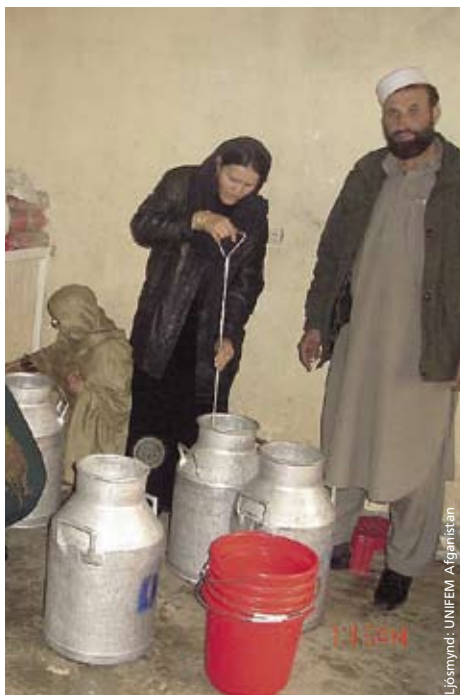
Jógúrtframleiðsla í Hizatkhal.