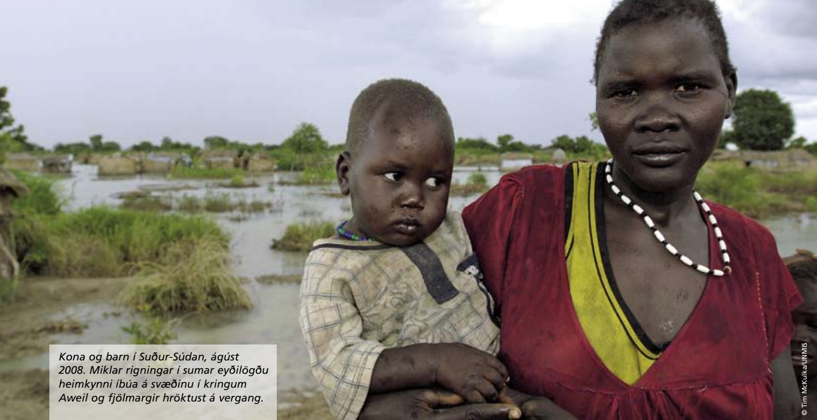
Kona og barn í Suður-Súdan, ágúst 2008. Miklar rigningar í sumar eyðilögðu heimkynni íbúa á svæðinu í kringum Aweil og fjölmargir hröktust á vangang.