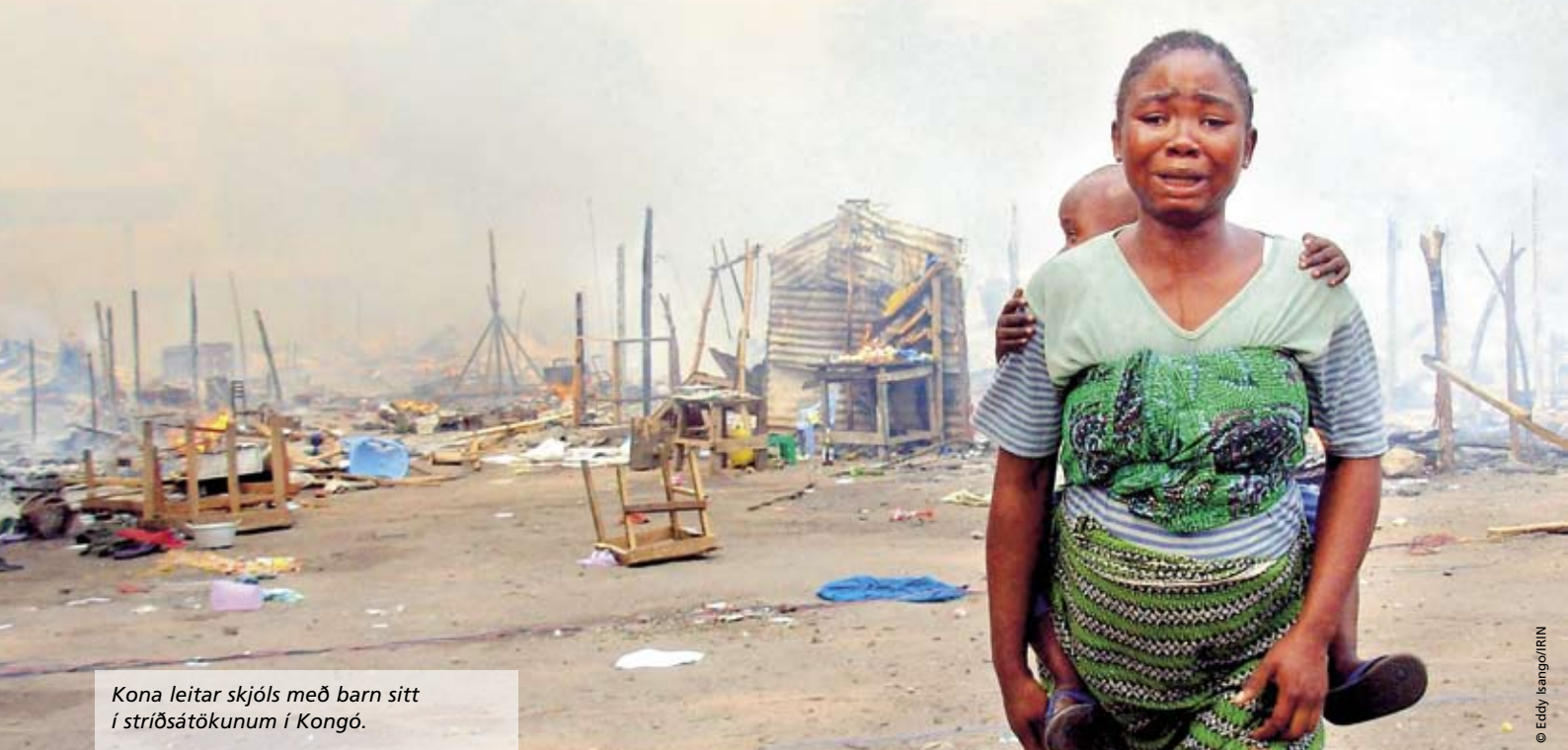
Kona leitar skjóls með barn sitt í stríðsátökunum í Kongó.