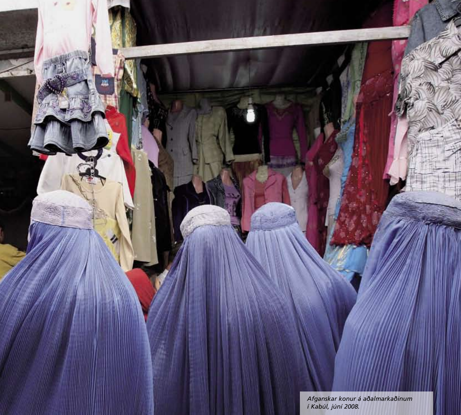
Afganskar konur á aðalmarkaðinum í Kabúl, júní 2008.

Þess að héraðsskrifstofurnar hafa nú enn meira svigrúm til að berjast fyrir og hafa almennt áhrif á bætt líf og rétt kvenna úti í héruðum. Þetta nýja fyrirkomulag auðveldar samþættingu aðgerða á héraðsstigi og styður þannig enn betur við samfélagslega og efnahagslega þróun og stöðu kvenna og kvennasamtaka í landinu.