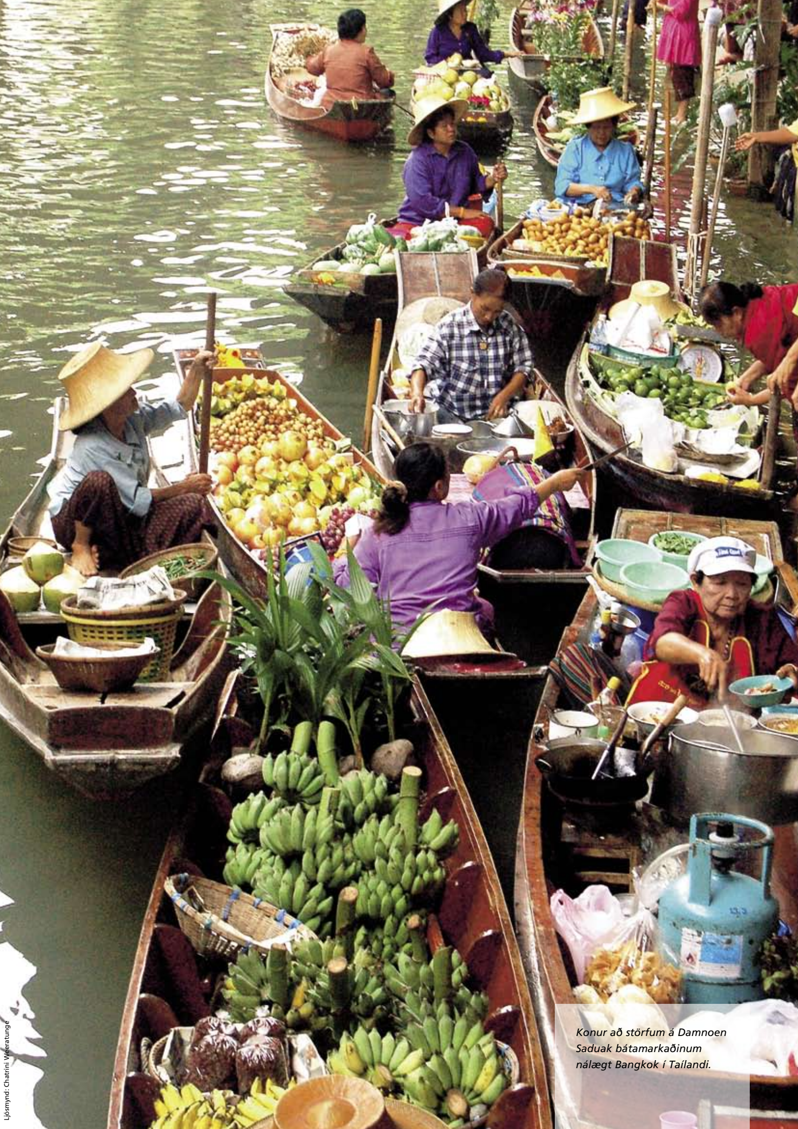
Konur að störfum á Damnoen Saduak bátamarkaðinum nálægt Bangkok í Taílandi.