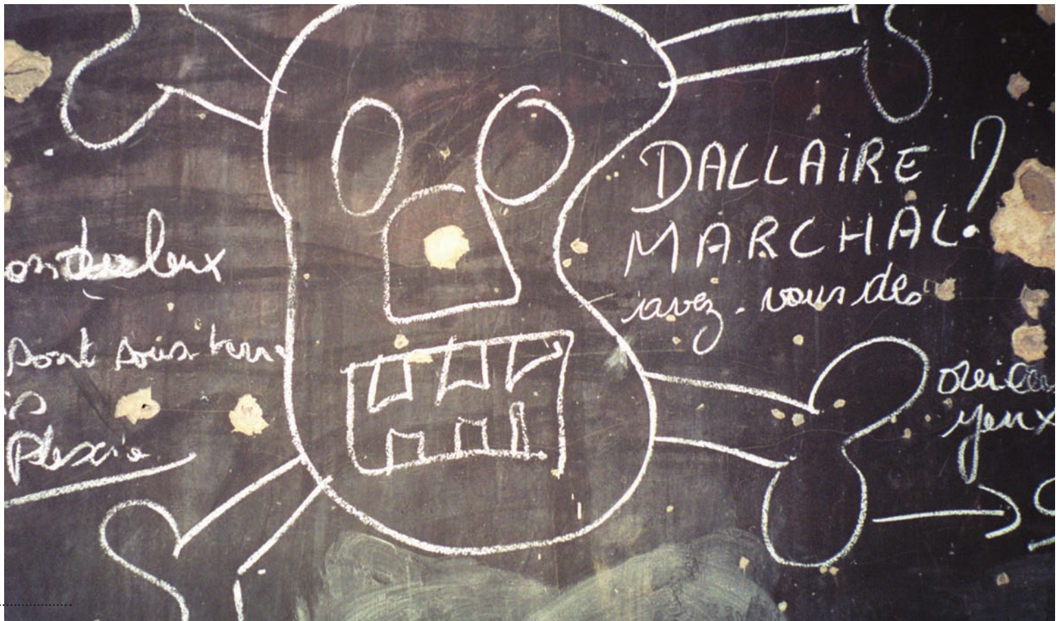
Hatursáróður á skólatöflu í Kigali höfuðborg Rúanda.

Hatursorðræða er tiltölulga auðgreinanleg þótt skilin milli venjulegra svíðvirðinga á opinberum vettvangi og hatursorðræðu séu stundu óljós.