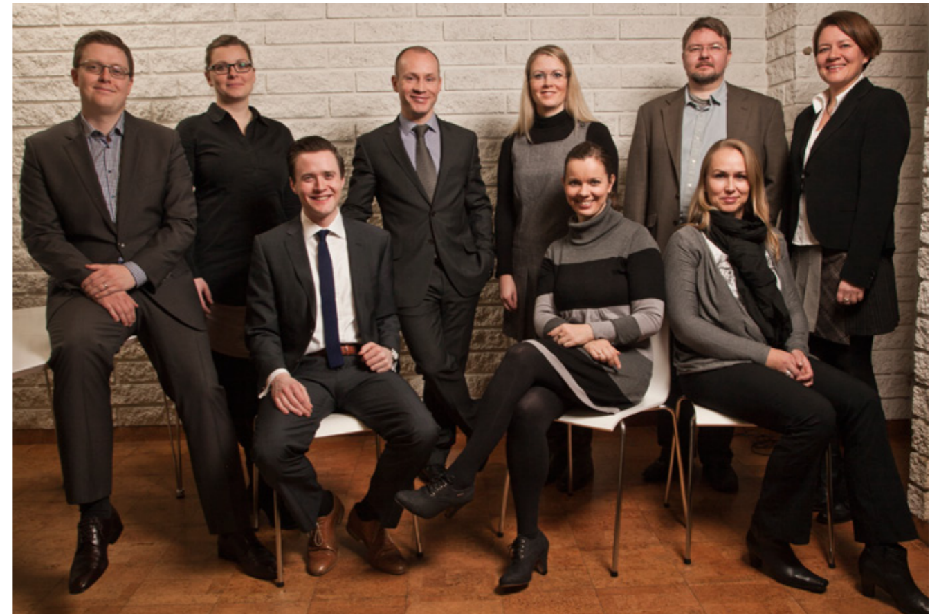
Starfsfólk Viðskiptaráðs febrúar 2012