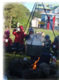
Drafnarstígur 4 101 Reykjavík Sími: 552 3727