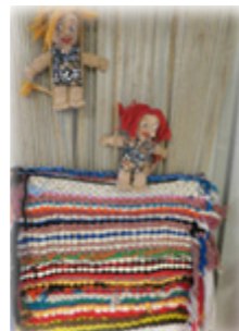
Seljavegur 12 101 Reykjavík Sími: 551 6312

Netfang: drafnarsteinn@reykjavik.is Vefsíða: www.drafnarsteinn.leikskolar.is