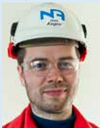
Ásgeir Sævarsson T&U svið Nei ekki sjálfur enn komst í egg Nr. 4 frá Nóa sem konan skildi eftir á glámbekk var of upp- tekin við þjófaðinn til að taka eftir málshætti