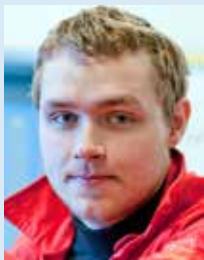
Ágúst Búason Aðalverkstæði hópur A Nr. 7 frá Nóa Sjaldan fellur eplið langt frá eikinni

Fékkst þú páskaegg og hver var málshátturinn?