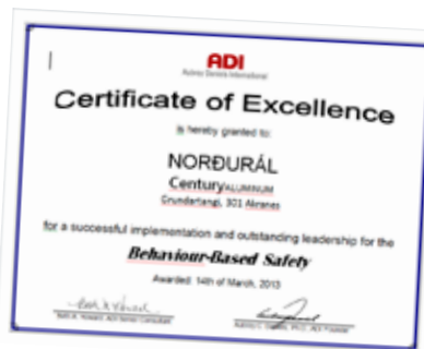
Viðurkenningarskjalíð frá Aubrey Daniels International.

Eins og áður sagði var 258 örugum venjum náð í lok mars og var meðaltal fjölda mældra daga 39. Tvö verkefni standa upp úr hvað lengd mælinganna varða en