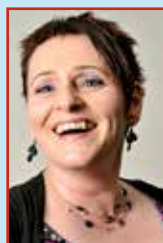
Ása Mýrdal Eldhús næturvakt