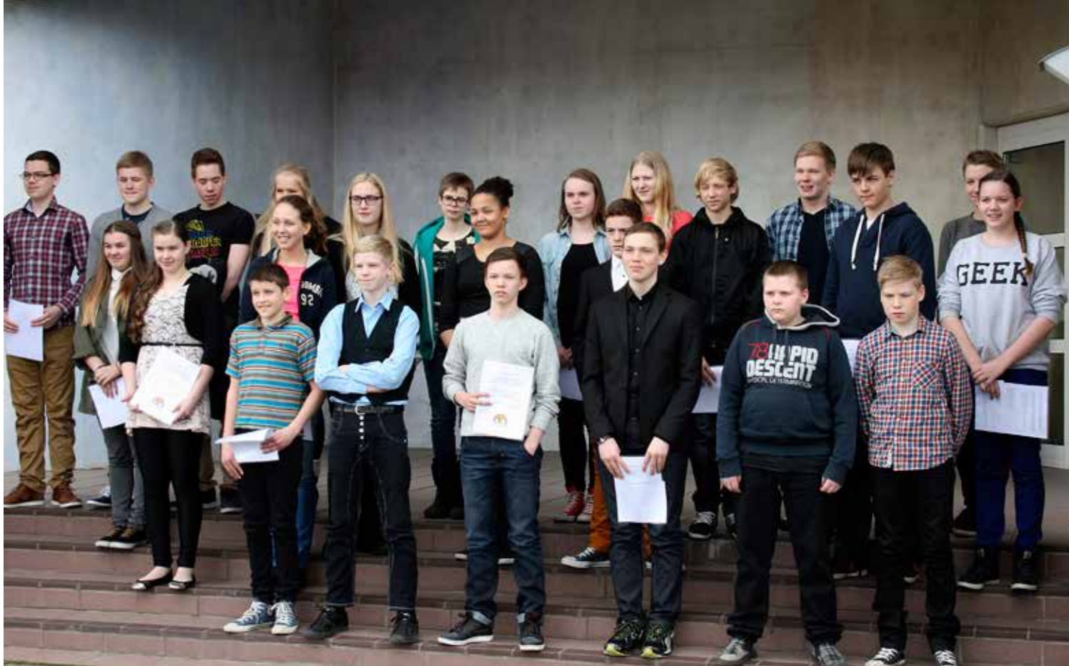
„Stærðfræðisjóni“ Vesturlands 2013