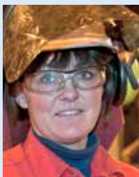
Belinda Kristinsdóttir Skautsmiðja Time c. Hálft Nr. 3 frá Nóa man ekkert eftir málshætti (má skálda?)