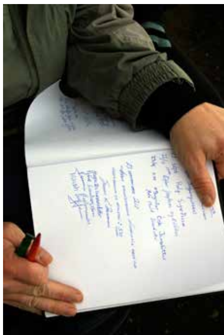
Bækur frá árinu 1997 eru varðveittar í Bókasafni Akraness.