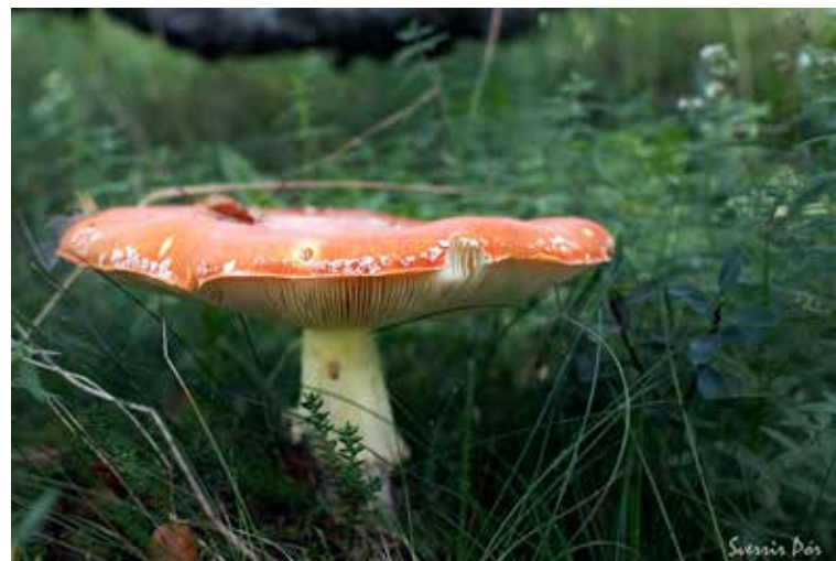
Landslagsmyndir eftir frístundaljósmyndarann Sverri.