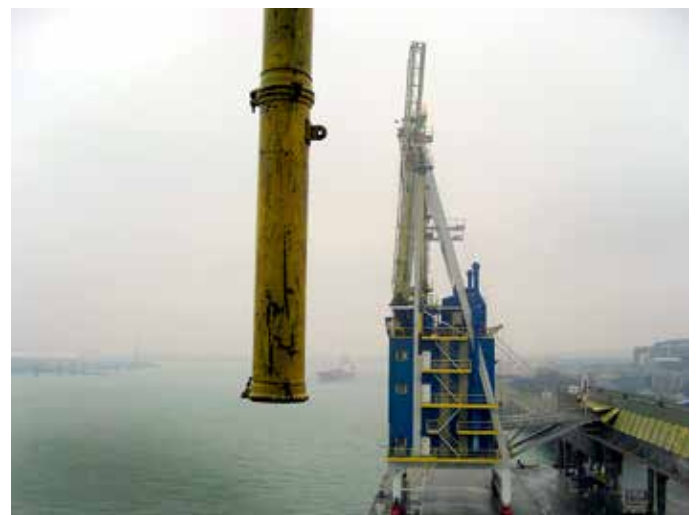
Hér sést annar tveggja löndunarkrana verksmiðjunnar. Myndin er tekin úr hinum löndunarkrananum. Þessir kranar voru notaðir til að losa súrál og koks úr skipum.