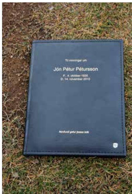
Norðurál gefur bækurnar á tindum Akrafjalls.