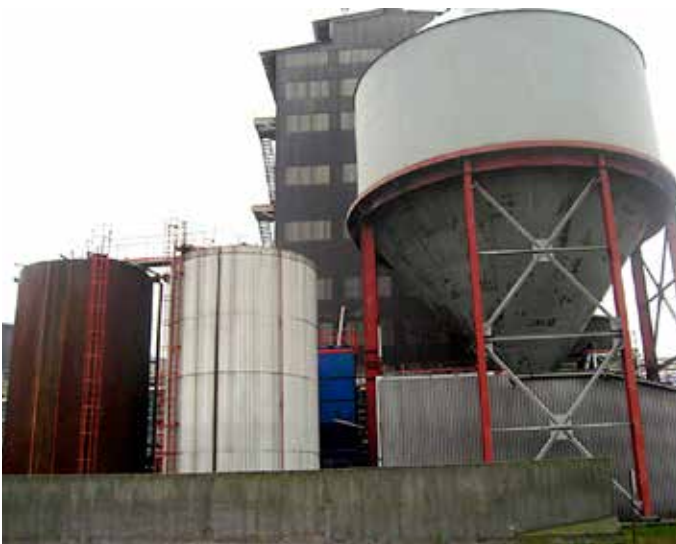
Hér sjást skautleifa- og bikgeymarnir. Framleiðsla á grænum skautum fer fram í byggingunni sem sést á bak við geymana.