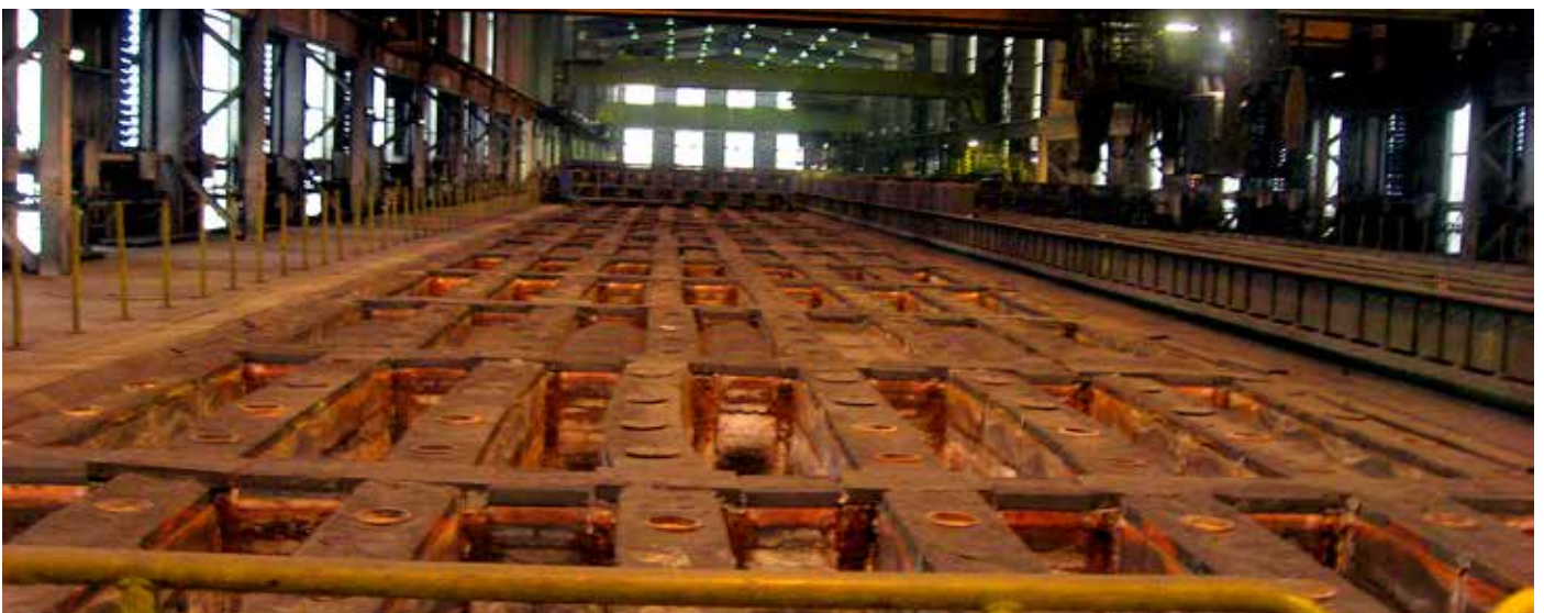
Hér sést annar tveggja bökunarofnana og einn brúkrananna sem notaður er til að hlaða og losa skaut úr bökunarofnunum.