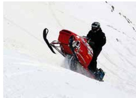
Sverrir og tækin sem nú hefur verið lagt.