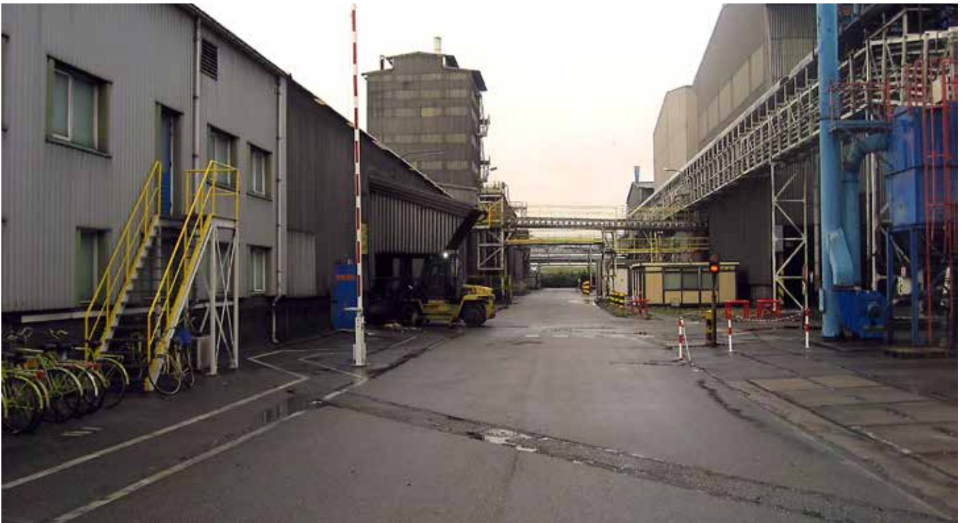
Vinstra megin götunnar er blöndunarstöðin þar sem græn forskaut eru framleidd og geymslur fyrir græn skaut. Hægra megin götunnar eru húsin sem hýsa bökunarofnana.