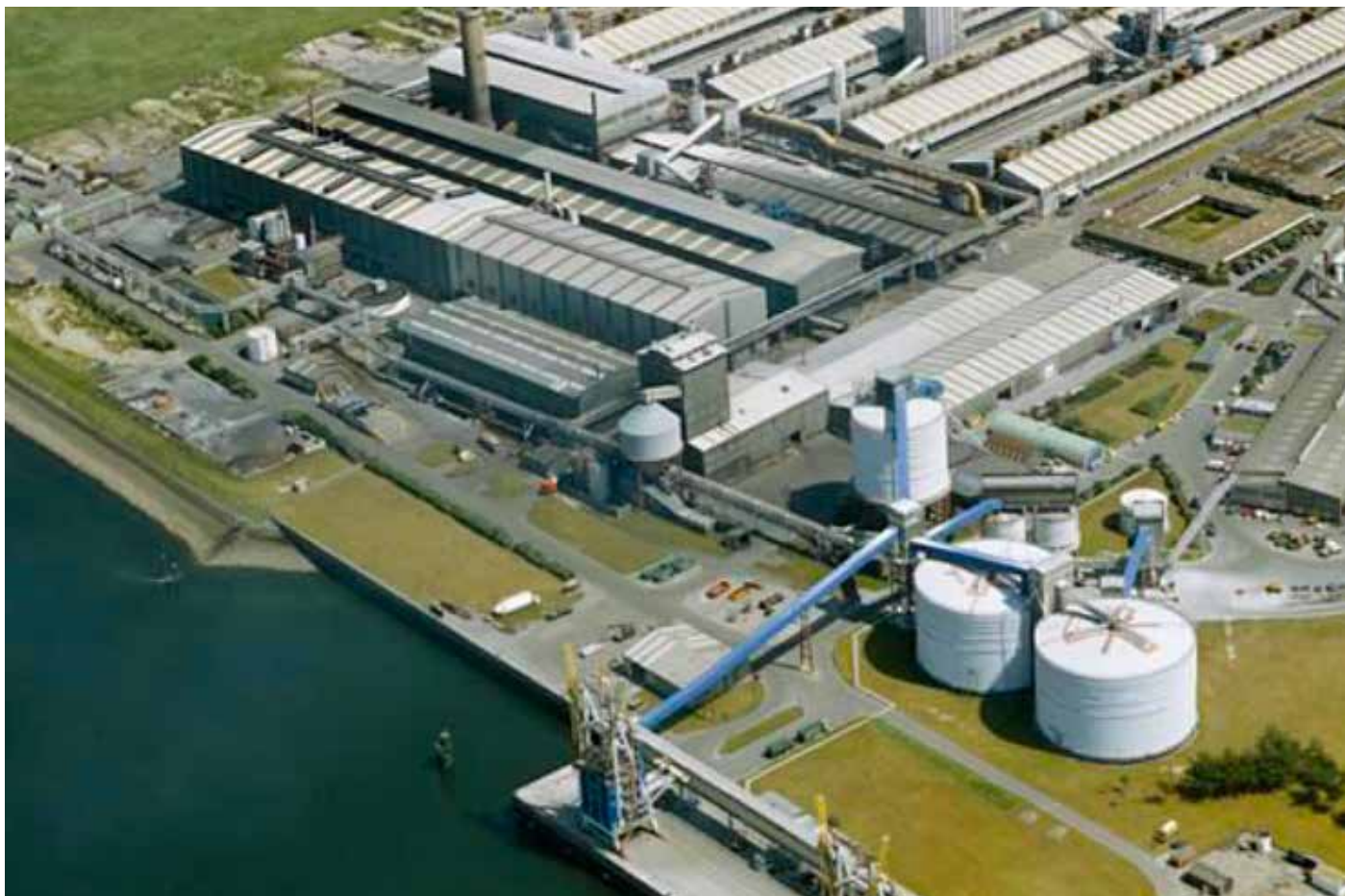
Yfirlitsmynd af Century Aluminum Vlissingen Operation. Kerskálarnir efst á myndinni tilheyra ekki forskautaverksmiðjunni.