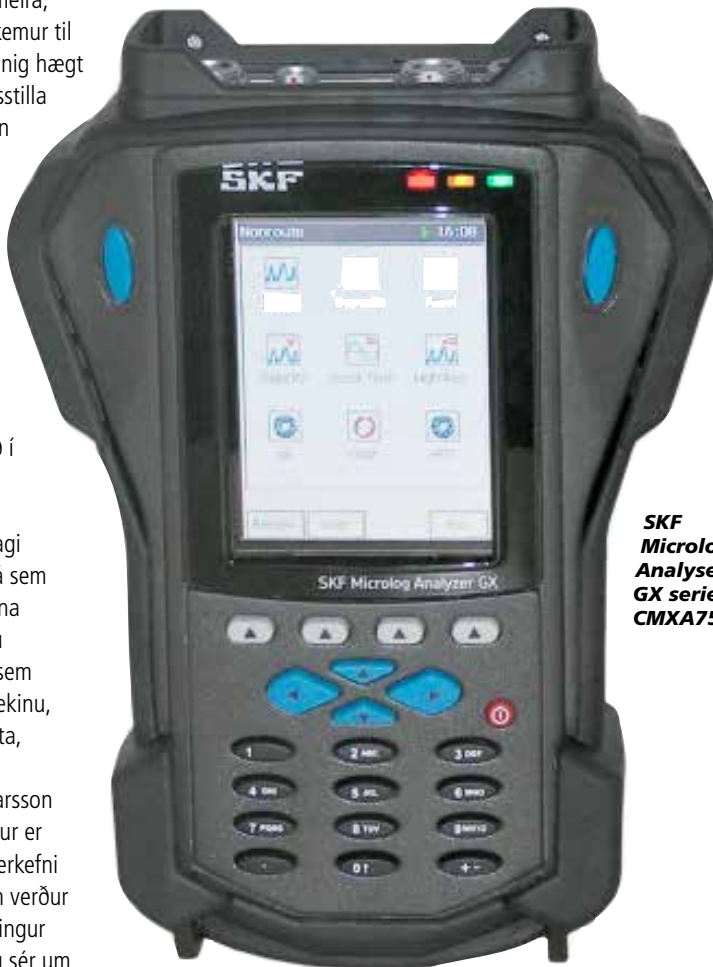
SKF Microlog Analyse GX series CMXA75