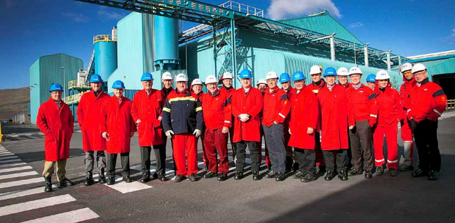
Helstu stjórnendur Century Aluminum og fylgdarlið tilbúin í vettvangsferð, eftir að hafa fengið hlífðarfatnað og fyrirlestur um öryggismál hjá Öryggiseildinni.