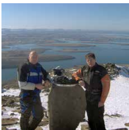
Aftur á toppnum.