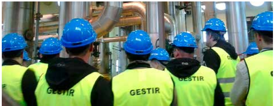
Í Orkuvirki 1 datt mönnum í hug að hlíðarbúgrein HS Orku væri bjórframleiðsla