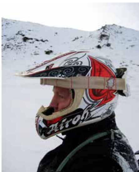
Með hjálm í vinnu og utan.