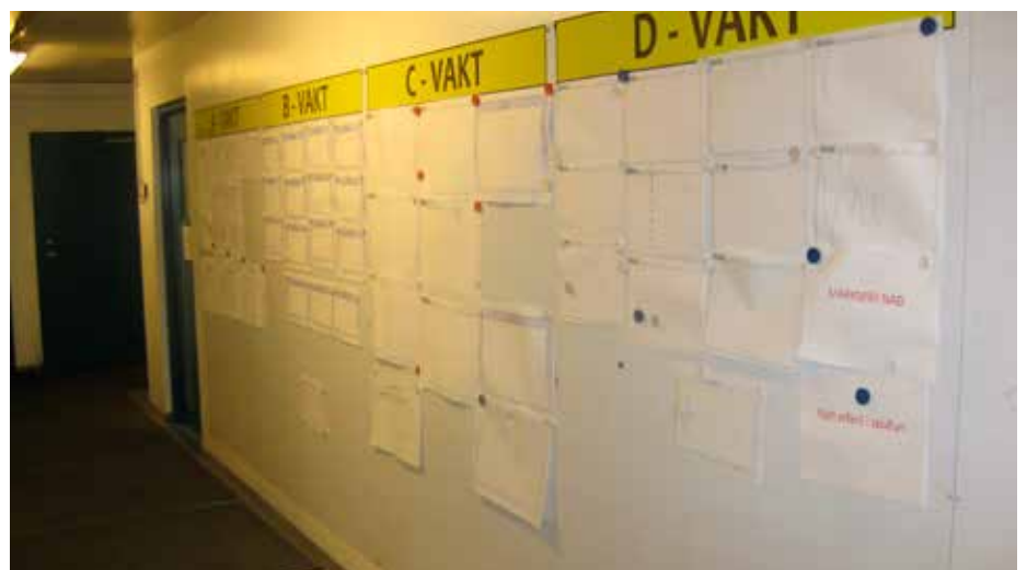
Línurit kjarnateyma kerskálanna á ganginum fyrir framan kaffistofu starfsmanna.

öruggu atferli á Hótel Glym í september fyrir þá starfsmenn sem hafa ekki þegar sótt námskeið. Fyrirkomulag þessara námskeiða og dagsetningar verður kynnt fyrir starfsmönnum