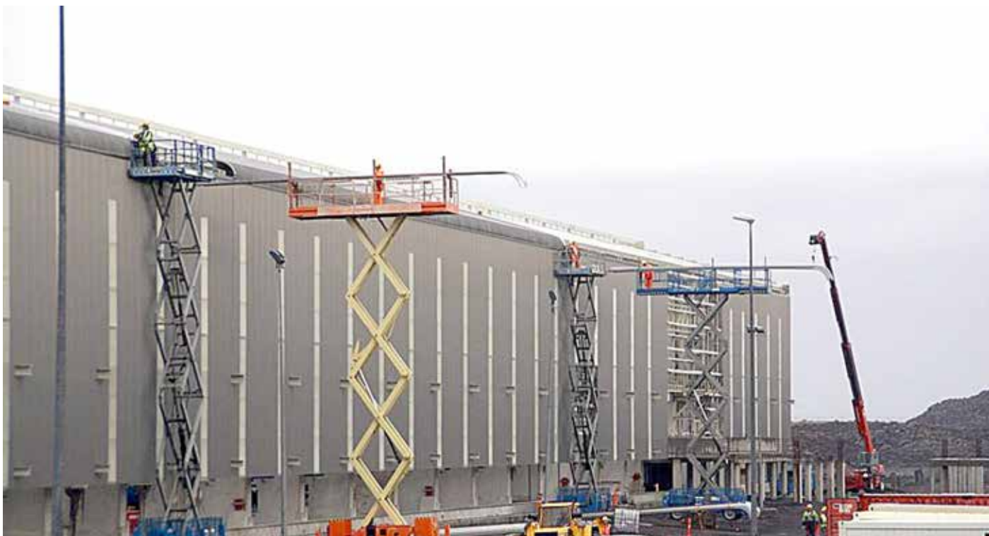
Örugg vinnubrögð eru höfð að leiðarljósi í Helguvík.