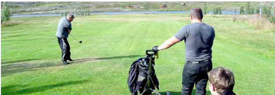
Slegið í átt að Þórisstaðavatni.