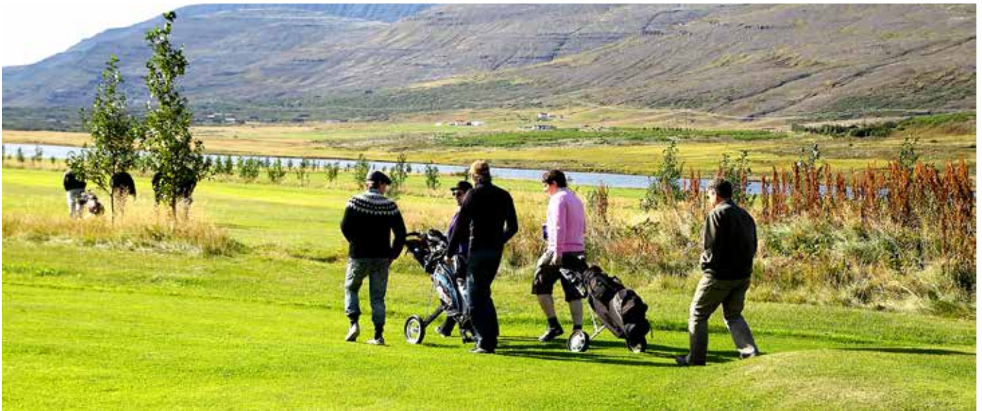
Veðrið lék um keppendur á Þórisstöðum.