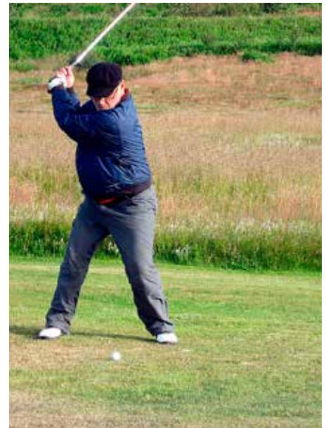
Lagt af stað í aftursveiflu.