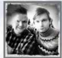
MATTI - HREIMUR & SYKURPÚÐARNIR HALDA UPPÍ FJÖRINU

VERÐUR HALDIN Í GULLHÖMRUM GRAFARHOLTI, 29. SEPTEMBER OG HEFST STUNDVÍSLEGA KL. 20:00 HÚSIÐ OPNAR KL. 19:30