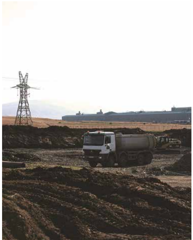
Frá framkvæmdum á Klafastöðum við Grundartanga í sumar.

Frá framkvæmdir eru hafnar á nýju launaflsvirki á Klafastöðum við Grundartanga. Það er Landsnet sem framkvæmir. Samkvæmt upplýsingum frá Landsneti er svo komið að flutningsgeta Brennimelslínu 1 og launaflsskortur á tengivirkinu á Brennimel eru farin að hafa takmarkandi áhrif á frekari álagsaukningu tengda Brennimel. Tveir stórnótendur eru tengdir við tengivirkið, Norðurál og Elkem. Einnig er á Brennimel tenging inn á dreifikerfi Rarik og annar af tveimur upphafspunktum 132 kV byggðalínunnar. Þá hafa orkukaupendur sýnt meiri áhuga, núverandi sem nýir, og því er fyrir séð álagsaukning. Með nýja launaflsvirkinu eykst áreiðanleiki í afhendingu rafmagns, hægt verður að bæta við nýjum notendum og ekki þarf að reisa nýjar flutningslínur. Búnaðurinn verður innanhúss og því varinn fyrir seltu og sjávarlöðri. Húsið sem reist verður utan um launaflsvirkið er 2.300 fermetrar að grunnfleti. Búist er við að framkvæmdum ljúki á næsta ári.