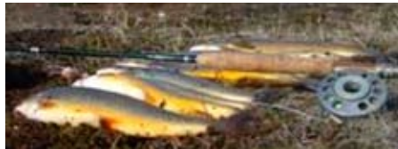
Góður morgunafli úr Hólmavatni.

Starfsmannafélag Norðurláls gerir starfsmönnum fyrirtækisins kleift að stunda stangveiði í þremur stöðuvötnum innan seilingar frá Grundartanga. Tvö vatnanna eru á Heydalsleið upp af Hnappadal, Svínavatn og Oddastaðavatn. Veiðin þar hefur verið ágæt að venju, töluvert veiðst af vænum urriða í Svínavatni. Þriðja vatnið er Hólmavatn upp af Hvítársíðu. Veiði hófst þar með látum laugardaginn 23. júní sl. Margir vænir silungar voru dregnir á land. Flestir