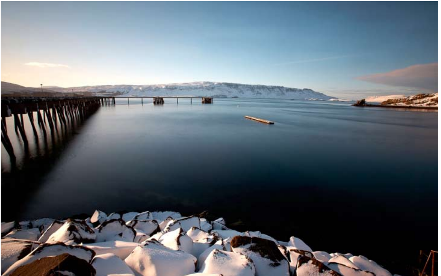
Hvalfjörður á stilltum vetrardegi. Séð yfir fjörðinn meðfram gömlu bryggjunni.

Ritnefnd: Aðalheiður Skarphéðinsdóttir, Ása Birna Viðarsdóttir, Ásmundur Jónsson, Birna Björnsdóttir, Bjarni I. Björnsson og Sverrir Guðmundsson.