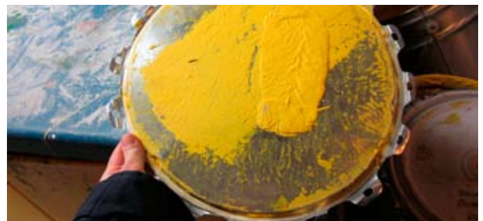
Lokið sem viðkomandi skar sig á en fliparnir geta haft egg hvassar brúnir.