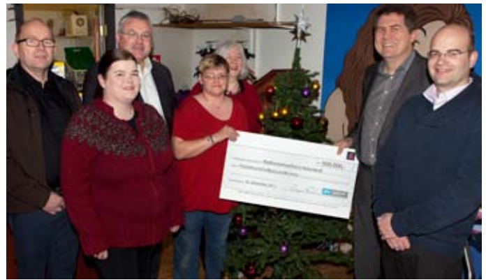
Frá afhendingu styrksins til Mæðrastyrksnefndar Vesturlands.