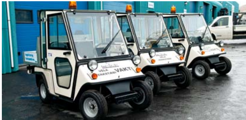
Nýju bílarnir sem viðhaldssvið var að fá afhenta.