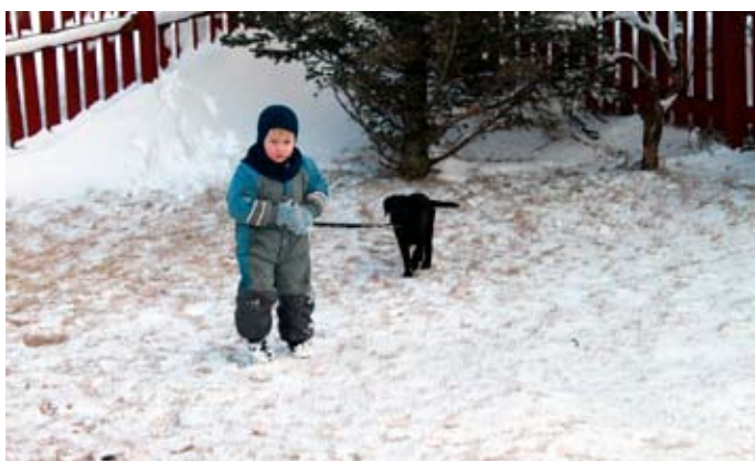
Úti með hundinn.