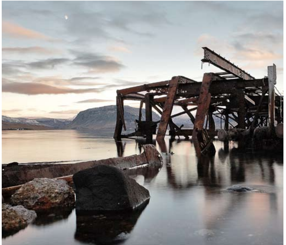
Hvítanes í Hvalfirði. Sverrir Þór Guðmundsson tók þessa fallegu mynd. Myndasýrpa er úr Hvalfirði í opnu blaðsins.