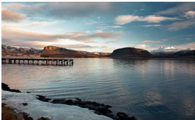
Hvítanes á kyrrum vetrardegi.