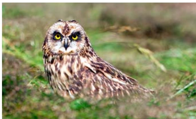
Ugla á Hvalfjarðarströnd.