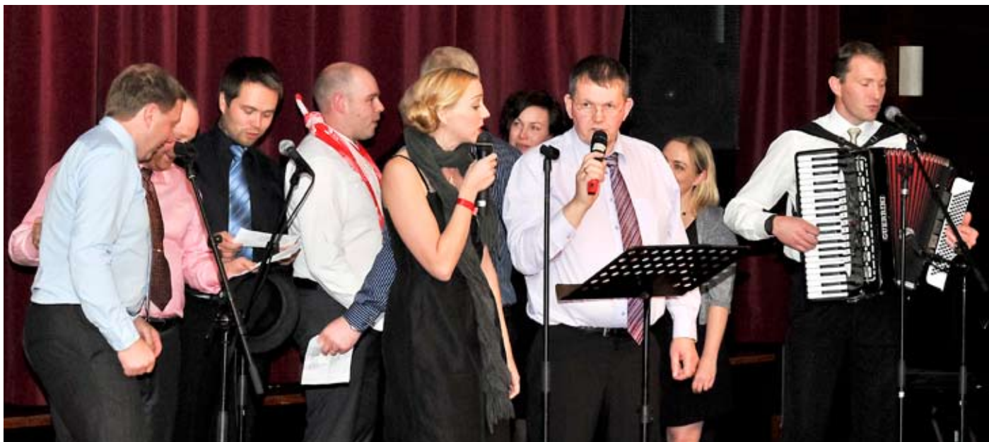
Umhverfis- og verkfræðideild slær í gegn með alíslenska kjötsúpu.