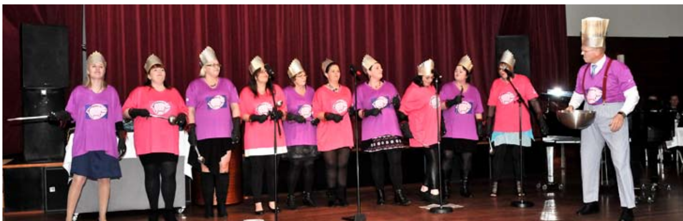
Starfsmenn mótuneytis með frábæran flutning á laginu Tvær úr Tungunum.