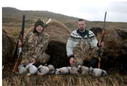
Að loknum fengsælum degi við gæsaveiðar.