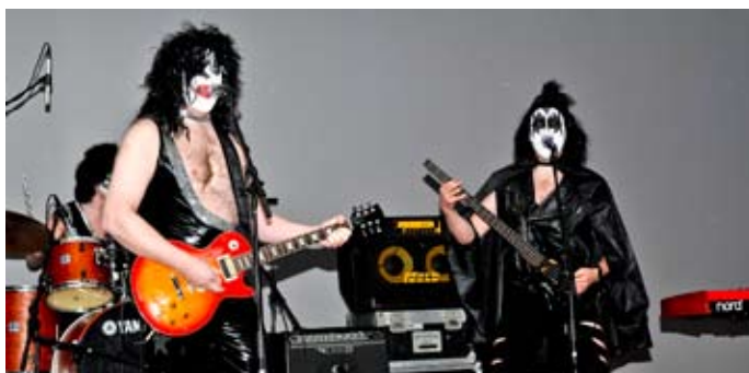
Komu, sáu og sigruðu, starfsmenn steypuskála D-vakt.