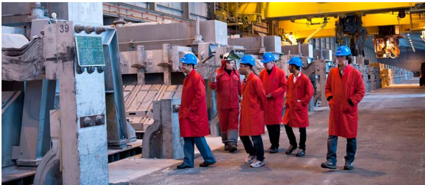
Pátttakendur á námskeiðinu í heimsókn hjá Norðuráli á Grundartanga.