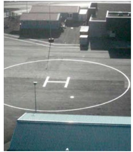
Lendingastaður fyrir þyrlu hefur verið merktur upp fyrir framan mótuneytið.