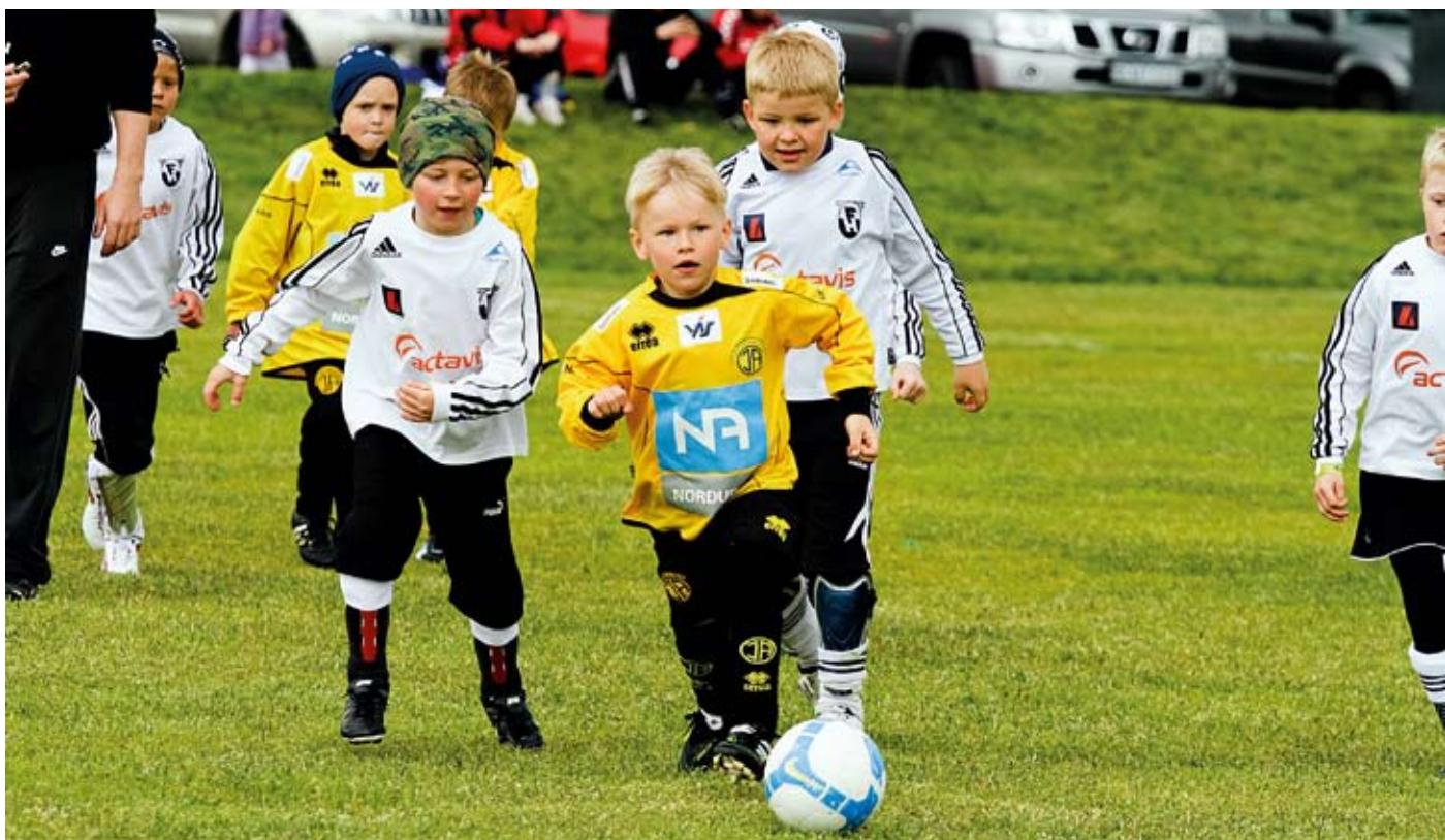
Skagamaðurinn leitar að næsta liðsfélaga umkringdur FH-ingum.