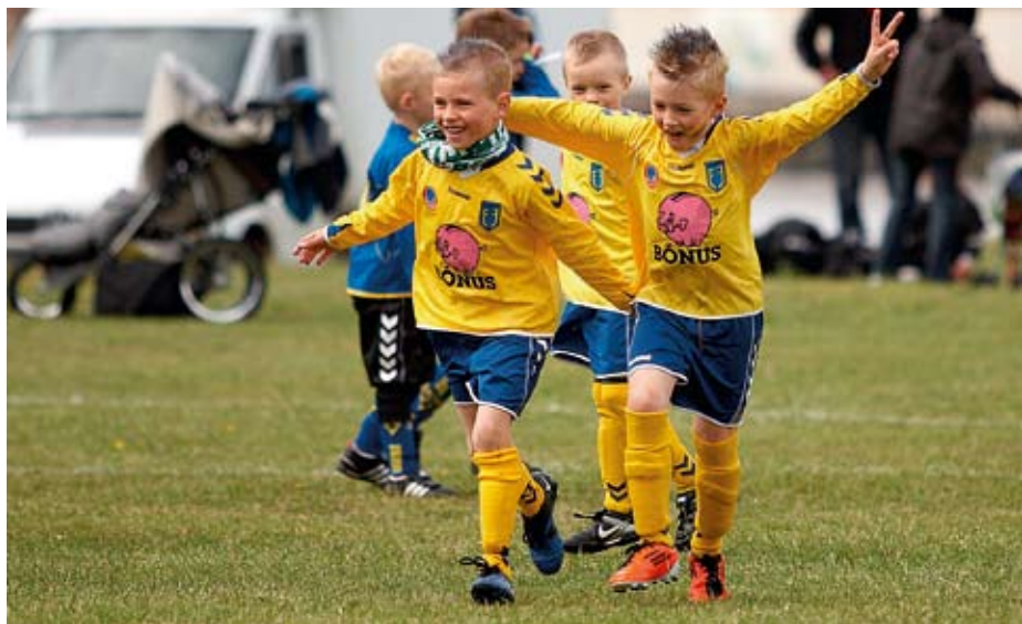
Hárprúðir Fjölnismenn fagna marki.