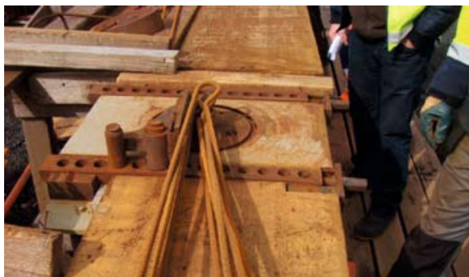
Starfsmaður var með hægri hönd á efsta járn af fimm sem hann beygði í einu.

Í apríl urðu tvö skráningarskyld slys við störf verktaka í Helguvík. Aðhlyningarslys varð 4. apríl er þrjú starfsmenn verktaka voru að losa klæðningu af flutningsvögnum. Klæðningin var skorðuð af á vögunum með timbri sem neglt var niður í gólf vagnsins. Starfsmennirnir tóku þá ákvörðun að reyna að losa þetta með göfflum á lyftara sem þeir voru með í stað þess að nota kúbein eins og upphaflega var áætlað. Einn starfsmannanna stóð fyrir framan lyftarann en með vagninn á milli. Þegar timbrið losnaði var það mikill þrýstingur á því að það skaust í átt að starfsmanninum og í andlit hans. Sauma þurfti tvö spor í hægri augabráun en hann hélt áfram vinnu eftir rannsókn málsins á svæðinu. Hjálmur og öryggisgleraugu björguðu að ekki fór verr. Fjarveruslys varð 28. apríl er starfsmaður var að beygja