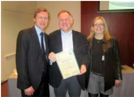
Forráðamenn KFÍA taka á móti viðurkenningunni.

heldur einnig menningar- og íþróttaviðburður á landsvísi. Þúsundir barna og foreldra þeirra koma til Akraness til að njóta hollrar íþróttaiðkunar og útiveru og bæjarfélagið nýtur þessarar vinnu einnig í ríku mæli. Ekki er öllum ljós sú mikla vinna sem þessu fylgir og mikilvægi þessa verkefnis, en viðurkenningin varpar einmitt góðu ljósi á hversu gott starf