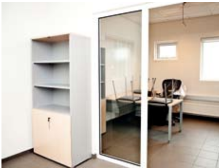
Eins og sjá má eru skrifstofu- og starfsmannarýmiin björt og snyrtileg.

Framkvæmdir byrjuðu við stækkun verkstæðis sem og skrifstofurými á efri hæð í lok árs 2008 og hafa staðið fram á þennan dag. Með þessari nýbyggingu stækkar vélaverkstæðið um þriðjung við bætast 300 fermetrar. Á neðri hæð eru einnig rafmagnsverkstæði í 200 fermetra rými sem eru starfsstöðvar rafvirkja, rafeindavirkja og iðntölvuþjónustu. Þá eru einnig skrifstofur, hvíldarherbergi, snyrtingar og verkfæralager í alls 150 fermetra rými