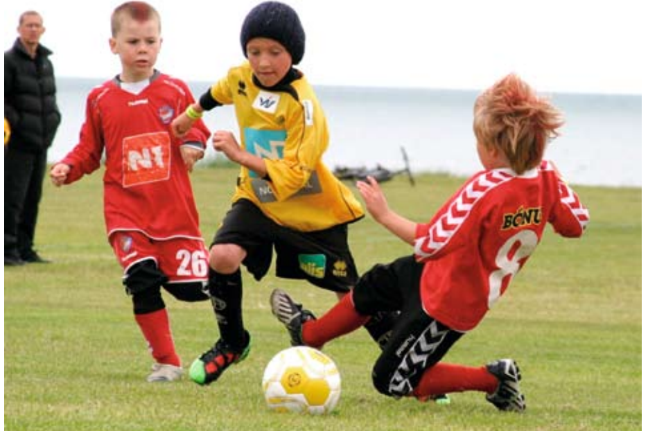
Frá Norðurlásmótinu síðasta sumar.