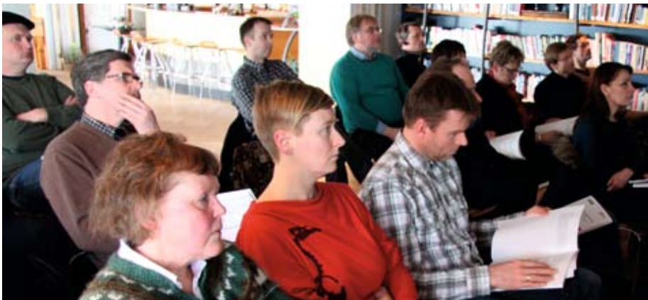
Nokkrir bændur og fulltrúar umhverfisnefnda voru meðal þeirra sem sóttu kynninguna.

birgjum en ónóg gæði þeirra geta aukið losun lofttegunda frá verksmiðjunni. Þar næst voru kynntar niðurstöður umhverfisvöktunar á Hvalfjarðarsvæðinu fyrir síðasta ár, 2010. Verkfræðistofan Efla tók saman ársskýrslu umhverfivöktunarinnar og kynnti niðurstöður hennar. Í umhverfinu eru gerðar ítarlegar mælingar á flúor, brennisteinsdíoxíði og ryki innan og utan þýnningarsvæðis verksmiðjanna á Grundartanga; í gróðri, vatni og uppsöfnun á flúor í beinum sauðfjár sem dvelur og elst upp í nærsveitinni. Niðurstöður mælinga leiða í ljós að losun Norðuráls er innan marka í allri starfsleyfistengdri starfsemi. Í fyrirspurnartíma eftir kynningarnar var meðal annars fjallað um staðsetninga loftgæðamælistöðva og hvort hugsanlega mætti fjölga þeim.