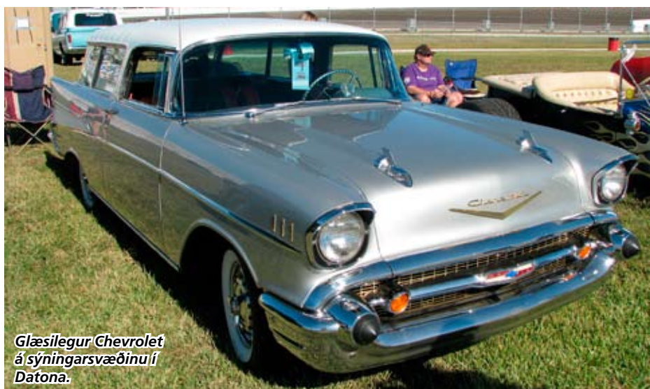
Glæsilegur Chevrolet á sýningarsvæðinu í Datona.

Bræðurnir og Hrólfur voru 13 daga í ferðinni, fóru út 19. nóvember og komu heim 2. desember. Fjóra daga í ferðinni voru þeir í Orlando á bílasýningu þar