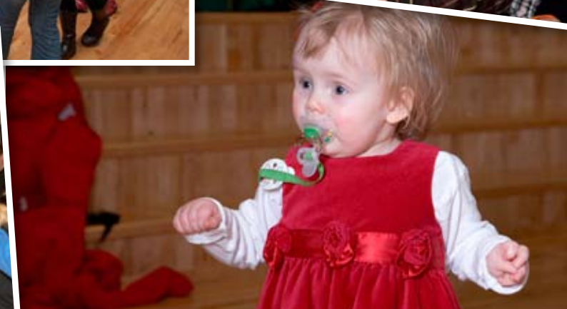
Jólatrésskemmtun Norðuráls var haldin í Grundaskóla á Akranesi sunnudaginn 19. desember.