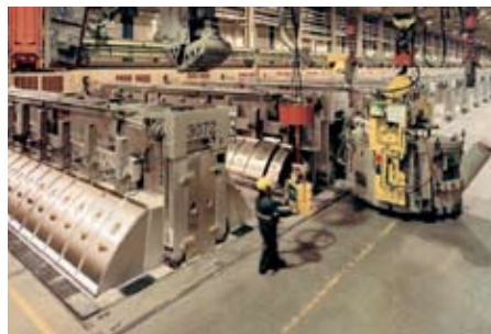
Frá kerskála með AP3X tækni.

Kerskálastraumur í byrjun í Helguvík er áætlaður 360 kA, en til samanburðar var byrjað á Grundartanga á 180 kA. Áætlað er að hægt verði að fara með strauminn upp í 380 til 385 kA án þess að gera breytingar eða endurbætur á rekstrarbúnaði. Nýjustu upplýsingar frá RTA eru að líklega verði hægt að fara upp í 405 kA, en þá með smávægilegum breytingum og endurbótum á rekstrarbúnaði. Helstu rekstratölur fyrir AP3X tæknina eru: orkuþörfin er 13.000 kWh/t og ristiðni er lægri en 0,03/ker/dag.