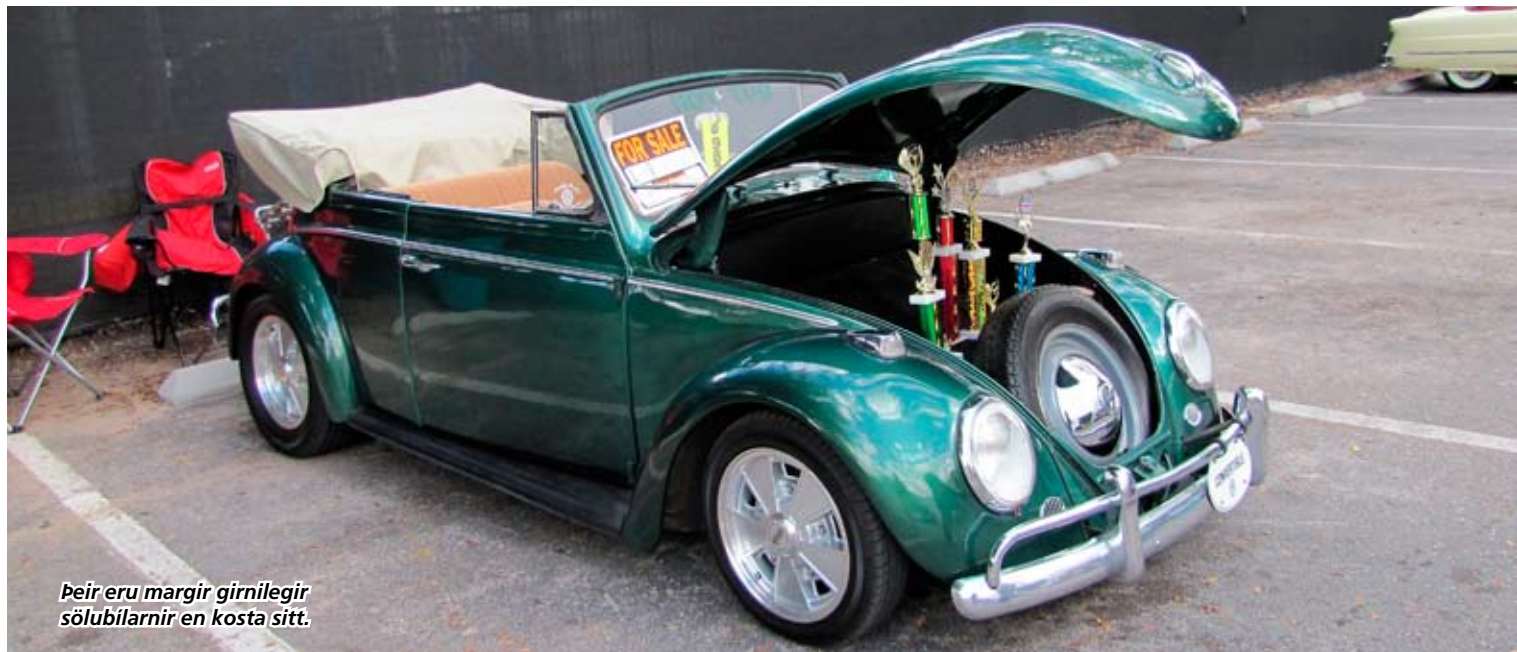
Þeir eru margir girnilegir sölubílarirnir en kosta sitt.