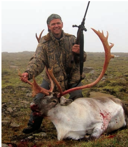
Sigbór með vænan hreindýrstarf á veiðum austur á Héraði.

kemur að því að laga sósuna eru meiri serimoniur. Þá koma fleiri að og vilja smakka og leggja sitt að mörkum.