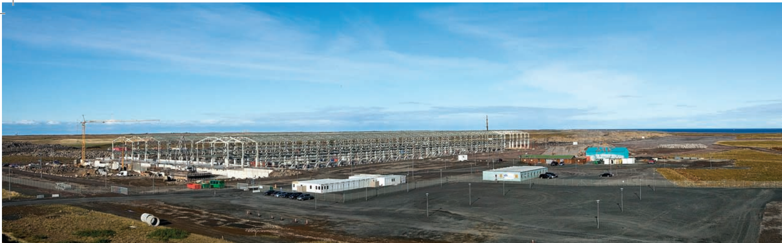
Pannig er staðan í Helguvík í dag. Neðri myndin var tekin fyrir ári.