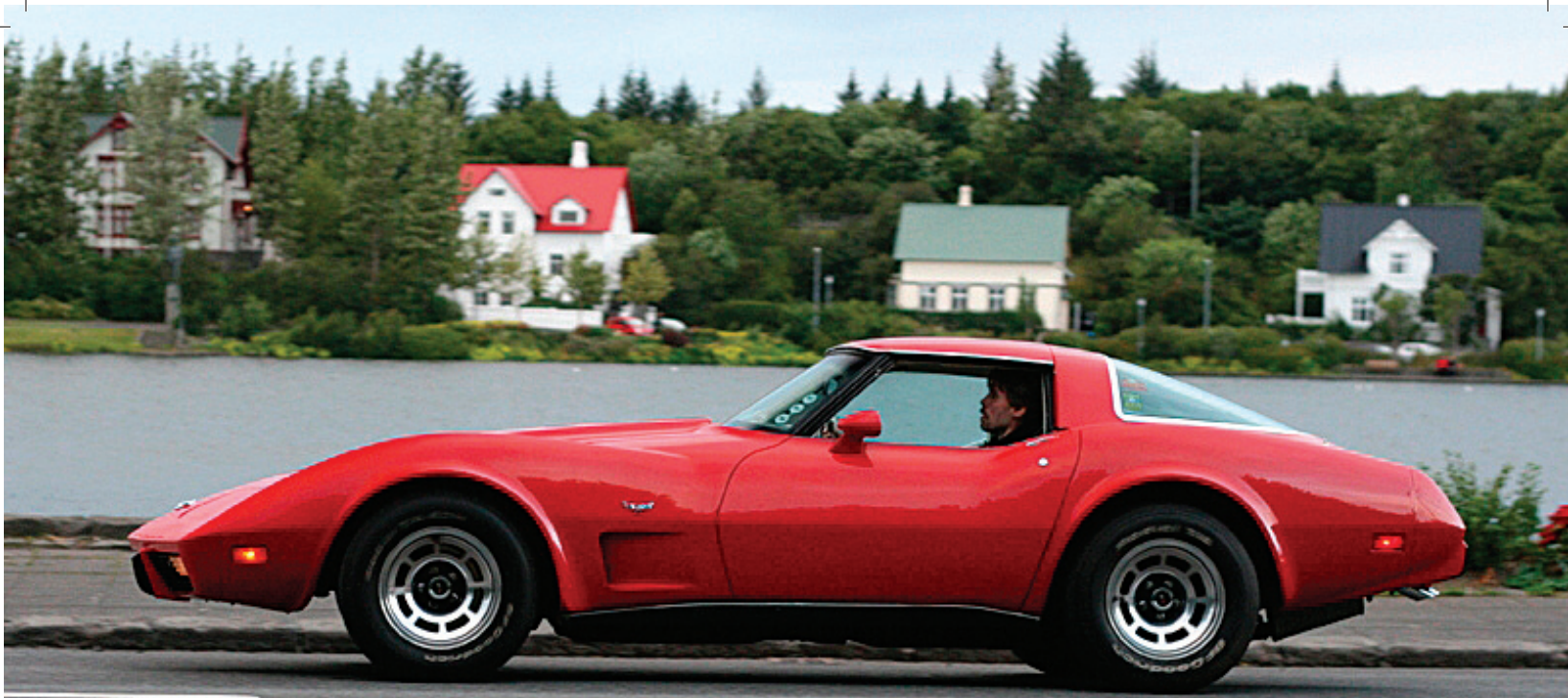
Magnús í góðum gir á Chevrolet Corvette árgerð '78.