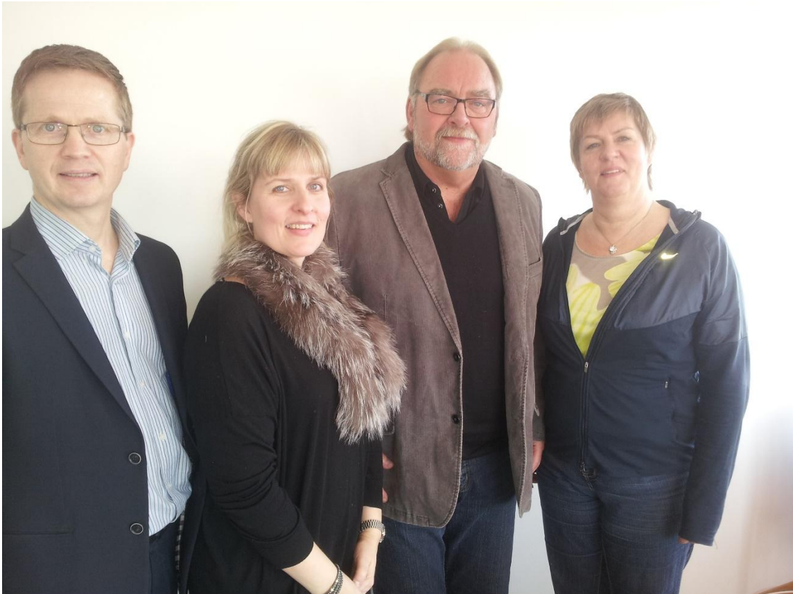
Jólagjafavalnefnd 2013 (frá vinstri á mynd):