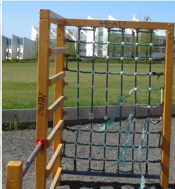
Ekki glæsileg, skoðum fleiri.