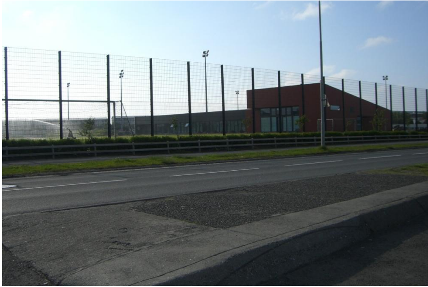
Stolt Efra-Breiðholtsins „Ghetto Ground“ aðsetur Leiknis

Til þess að enda frekar skjóta yfirferð mína yfir það sem fyrir augu bar í Fellunum langar mig að sýna hérna sjón sem mér fannst æði algeng og það er eiginlega sama um hvaða hverfi ræðir í Breiðholtiinu. Hvað eiga krakkarnir að gera við járnverkið vinstra megin á þessari mynd? Naga það?