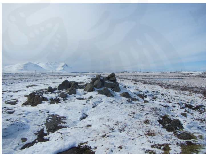
Varðan á Prestholti, MH-102:058. Horft til suðurs

MH-102:058 Prestholt varða hlutverk óþekkt 64°35.998N 21°46.424V „Börðin milli Dagmálamels og Vakarholts, sem fyrr er getið, og hallinn þar upp af, heitir Börð, er nú orðinn að túni. Norður af Vörðuholti er Prestholt, holt með vörðu á; þar varð úti prestur frá Ferjubakka,“ segir í örnefnaskrá AG. Klapparholt með vörðu á er tæpan 1,5km vest-norðvestan við íbúðarhúsin