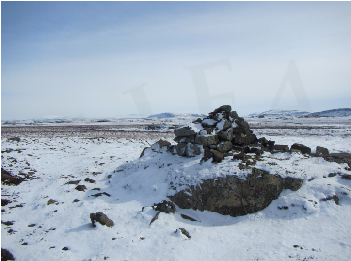
Varða MH-102:091, horft til austurs

á; þar varð úti prestur frá Ferjubakka,“ segir í örnefnaskrá AG. Rúma 80m vestan við Prestholt og rúma 100m vestan við vörðuna á Prestholti er önnur varða á öðru klapparholti. Þetta holt er eiginlega stærra en Prestholtið en virðist ekki bera neitt örnefni. Þetta ónefnda holt er norð-norðvestan við Vörðuholt og tæpa 50m utan við úttektarsvæðið.