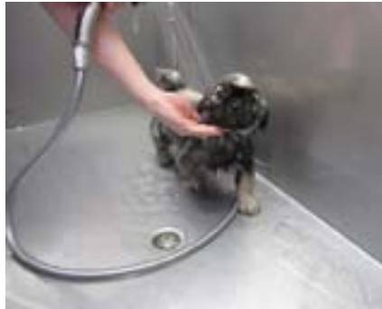
Mikilvægt er að upplifun hvolpsins sé jákvæð í baðinu.

Þegar búíð er að venja hvolpinn við blástur, burstun og snyrtiborð er kominn tími til að venja hann á baðið. Hvolpurinn ætti að fá að skoða baðið og kanna það áður en skrúfað er frá vatninu. Gætið þess að nota aðeins lítinn kraft til að byrja með og hafið hitastig vatnsins notalega volgt. Ekki er nauðsynlegt að nota sjampó í feldinn til að byrja með en gott er að nudda hvolpinn á meðan hann er baðaður. Ef hann er órólegur er mikilvægt að róa hann með rólegri, lágstemmdri rödd. Það sem skiptir öllu máli er að upp-