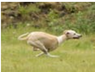
Whippet í beituhaupi.