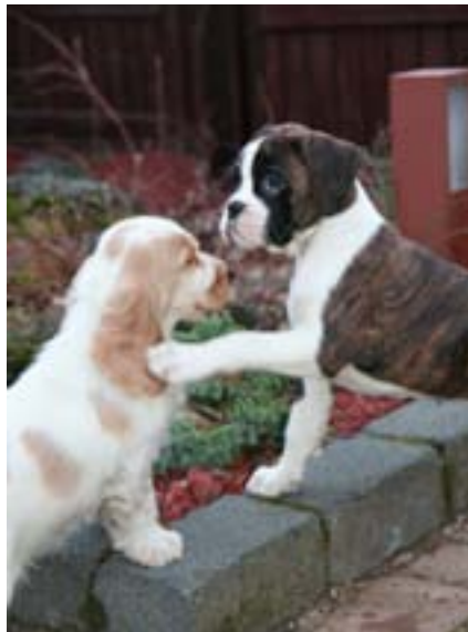
Reynsla höfundar er að auðvelt er að lækna niðurgang í hvolpum með gjöf meltingargerla.

Mín reynsla er að auðvelt er að lækna niðurgang í hvolpum með gjöf meltingargerla og við gerð greinarninnar rakst ég að dæmi um golden retriever sem var búinn að vera með niðurgang í sex ár en læknaðist með viðbættum meltingargerlum.