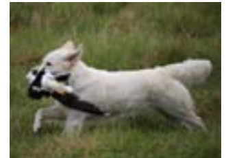
Great North Golden Aurora Boralis „Grace“ í veiðiprófi.