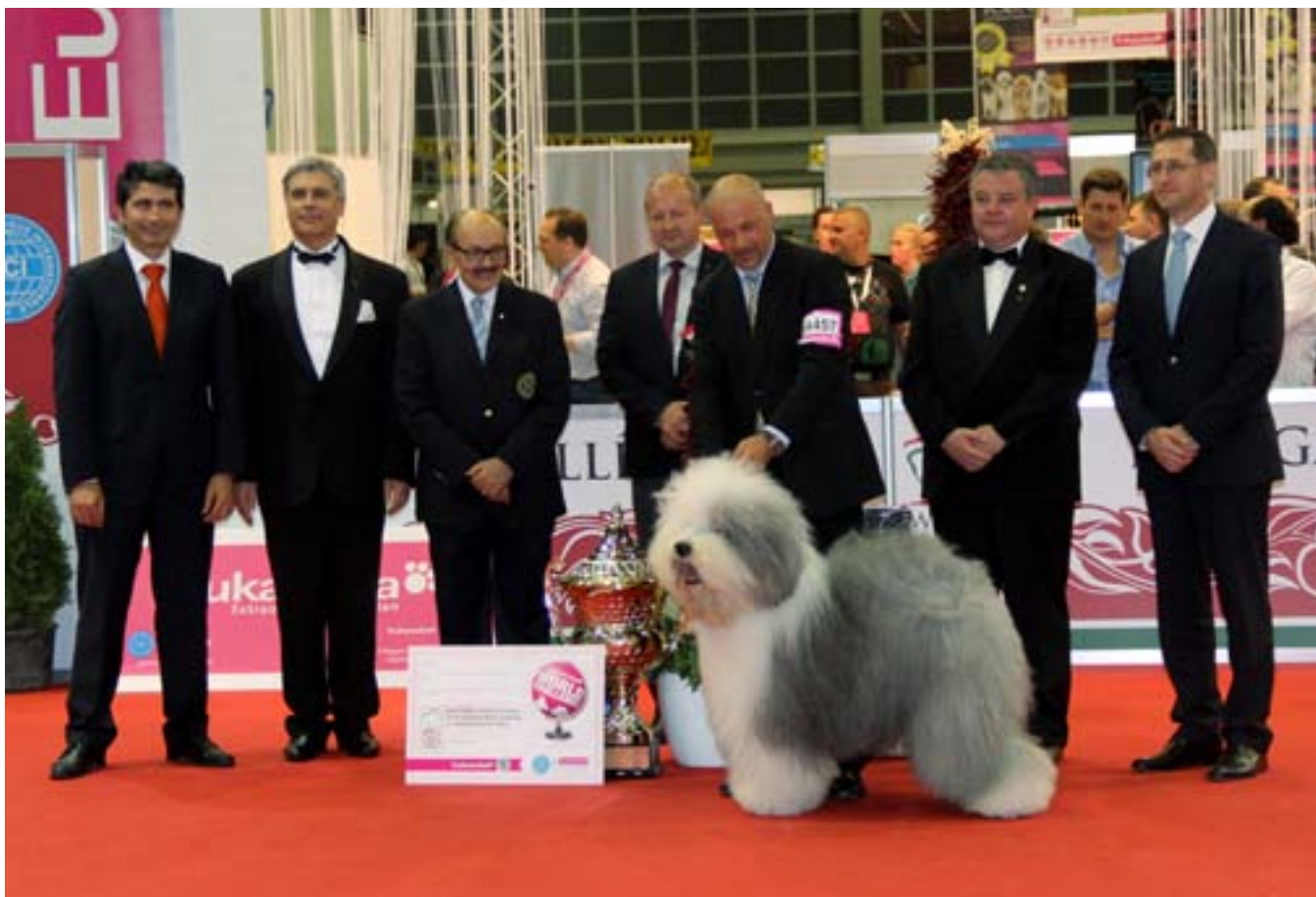
Besti hundur sýningar var hinn stórglæsilegi old english sheepdog-rakki, Bottom Shaker My Secret.