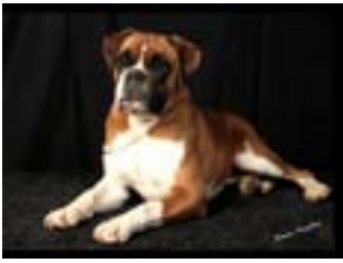
RW-13 ISShCh Bjarkeyjar Meant To Be.