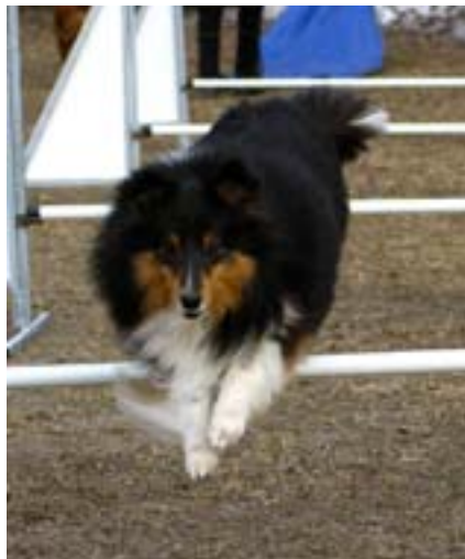
C.I.B. ISCh Moorwood Follow the Fashion (Viska) á flejgiferð í hundafimbraut.

Árið 1908 voru fyrstu Hjaltlandseyjahundarnir sýndir á hundasýn-