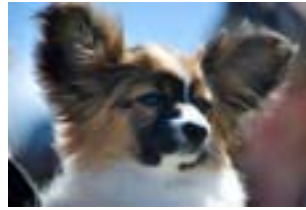
Höfðaborgar Let Me Entertain You.