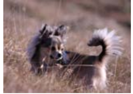
Himna Sól hefur verið stigahæsti loðni chihuahua árin 2011 og 2012 ásamt að vera stigahæsti öldungur bæði árin!

Mér finnst góðum frampörtum vera ábótavant í tegundinni, þá á ég aðallega við framstæðar axlir og stutta hálsa. Þetta hefur verið það sem hefur reynst mér erfiðast í gegnum tíðina.