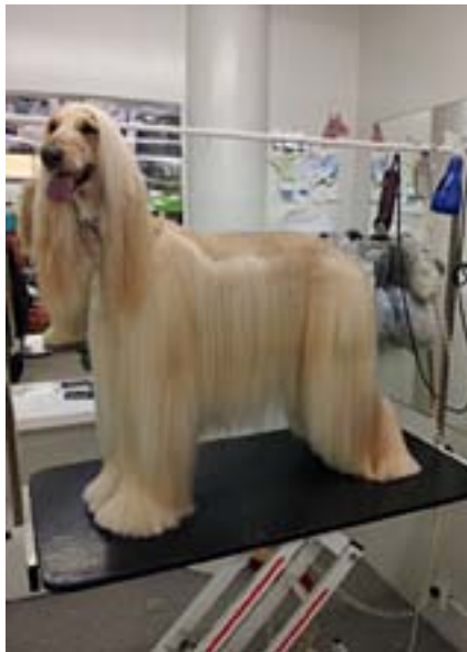
Afghan hound er þekktur fyrir fallegan, síðan og silkikenndan feld. Borðþjálfun er gríðarlega mikilvæg fyrir feldhunda sem þarf að snyrta reglulega.

Tilgangurinn með þessari grein er að gefa ræktendum og nýjum eigendum feldhunda góð ráð til að venja