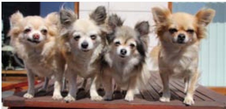
Fjórir ætliðir í beinan kvenlegg.

Mér finnst að ræktendur verði að hafa í huga að missa ekki niður týpuna. Í ræktunarmarkmiði segir að þetta eigi að vera vökull, þéttvaxinn hundur með eplalagð höfuð. Gott væri að hafa í huga að leggja meiri áherslu á byggingu en höfuð, því hægt er að fá gott höfuð með einni kynslóð en byggingin krefst vinnu, þolinmæði og meiri tíma.