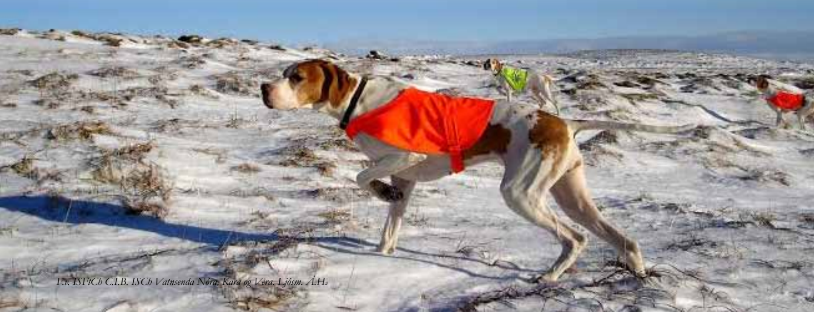
F.v. ISFtCh C.I.B. ISCh Vatnsenda Nóra, Kara og Véra.

Það er án efa ISFtCh C.I.B. ISCh Karacanis Donna. Hún var sá fallegasti og besti fuglahundur sem ég hef séð. Ég flutti hana inn sem hvolp frá Noregi og