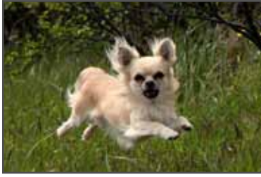
Hrimmis Litli Vargur. Ljós. Sveinn Magnússon.