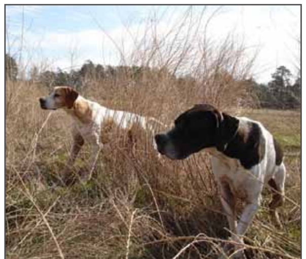
F.v. Vatnsenda Dylan og Byron. Ljós. Á.H.