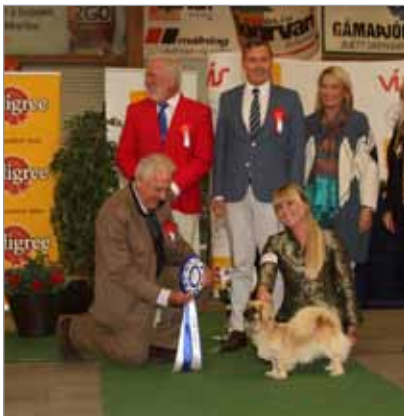
Besti hundur sýningar 2. sæti