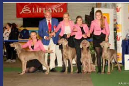
Besti afkvæmahópur laugardags Weimaraner RW-13 C.I.E. ISShCh Trubon Cino Trounce & afkvæmi

Nánari úrslit sýningarinnar má finna á heimasíðu HRFÍ, www.hrfi.is