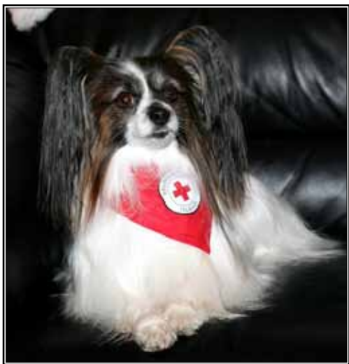
Heimsóknarvinurinn Phoebe með rauða klútinn sinn.

Höfundur og ljósmyndir: Anja Björg Kristinsdóttir