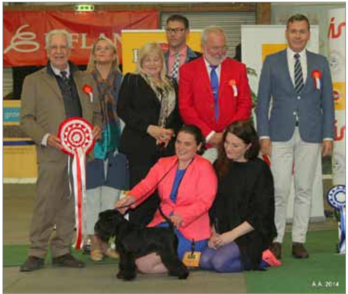
Besti hundur sýningar 1. sæti