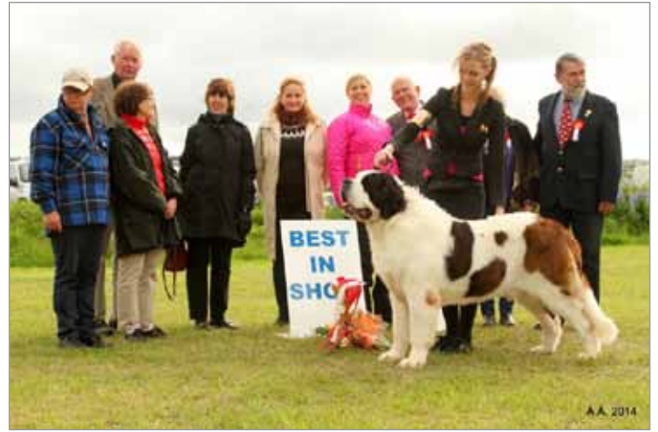
Alþjóðleg sýning Besti hundur sýningar 1. sæti

Eigendur: Guðríður Þorbjörg Valgeirsdóttir & Þorbjörg Ásta Leifsdóttir Ræktandi: Guðríður Þorbjörg Valgeirsdóttir