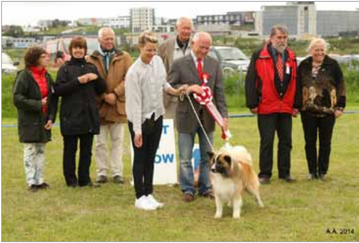
Reykjavík winner Besti hundur sýningar 1. sæti ISCh Arnarstaða Nagli Íslenskur fjárhundur