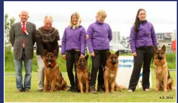
Besti afkvæmahópur sýningar Schäfer RW-13 C.I.B. ISCh Welincha's Yasko & afkvæmi