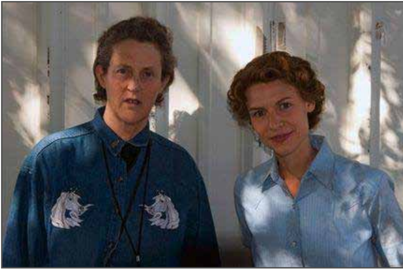
Leikkonan Claire Danes lék Temple Grandin í kvikmynd sem gerð var um hana.

á hverjum degi, fara með hann út, láta hann vera reglulega innan um góða hunda og fólk og vinna í hlutum sem þurfa að vera í lagi hvað þjálfun varðar. Þeir hundar, sem fá að vera frjálsari, fá að vera í hóp og eru agaðir af eldri hundum, eru oft ánægðari og minna er um vandamál hjá þeim. Temple segir margt hafa breyst frá því hún var yngri og þá sérstaklega varðandi heimilishunda. Hundar þrífist ekki inni á heimilum fólks nema með mikilli vinnu enda séu þeir ekki jafn frjálsir í dag og þeir voru þegar hún var ung.