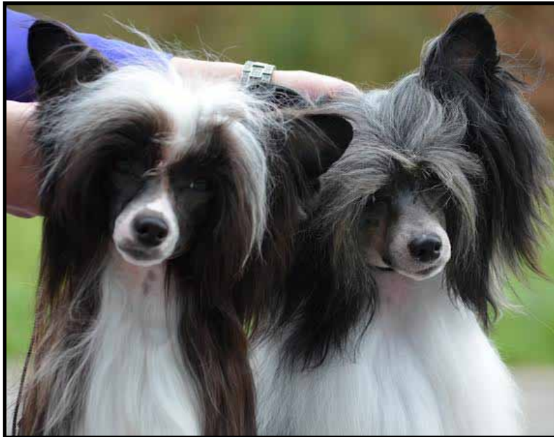
Á alþjóðlegri sýningu í Lúxemborg öðluðust chinese crested-féðgarnir, Inya Dreams Not Just a Pretty Face og faðir hans, SECh LUCH USCh Curlious Cache Is King meistaranafubátunar Lux. Jr. Ch (Lúxemborgar unglíða-meistari) og LUCH (Lúxemborgar meistari).