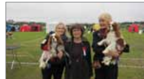
BOB og BOS á Reykjavík Winner-sýningunni.

Á sumar- og afmælisýningu HRFÍ 21.-22. júní voru skráðir 50 cavalierar.