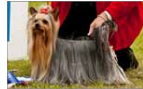
FINCh ISCh Narcissus Majesty of Rock „Leevi“.

Haldin var ganga í Sólheimakoti þar sem mæting var sú besta hingað til og endaði með kaffi í boði deildarinnar, öllum til ánægju.