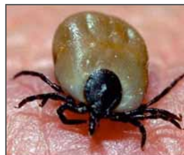
Mynd 1 - Blóðmíttill

Töluverð fjölgun hefur orðið á tilfellum á Íslandi þar sem blóðmítlar (e. ticks) hafa fundist á hundum. Í langflestum tilvikum hefur verið um ixodes ricinus að ræða sem þó hefur ekki verið talinn landlægur á Íslandi heldur hefur hann borist hingað með farfuglum. Hér á landi er hins vegar náskyld tegund landlæg, þ.e. lundalúsin svokallaða, (ixodes uriae) sem lifir á sjófuglum. Lundalúsin hefur einnig fundist á hundum en erfitt getur verið að þekkja tegundirnar í sundur. Þessari grein er ætlað að fræða hundeigendur örlítið um þennan „vágest“, mögulega smithættu af honum og hvernig megi forðast hann.