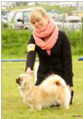
ISCh RW-13 RW-14 Tíbráar Tinda Pink Lotus varð í 2. sæti í tegundahópi 9.