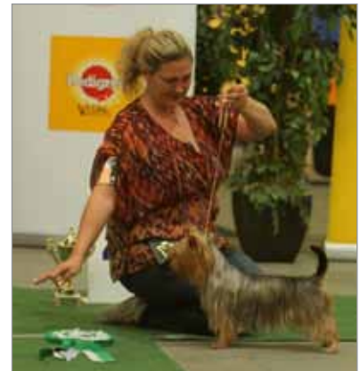
Besti hundur sýningar 4. sæti