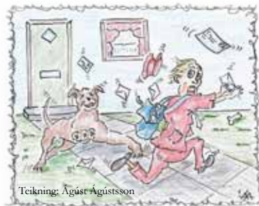
Teikning: Agúst Agústsson

Önnur leið er að tala einfaldlega við pósturmanneskjuna og fá hann/hana til að heilsa upp á loðna óargardýrið þitt. Leyfa þeim að kynna og mynda vináttusamband sín á milli. Stundum er það hægt. Stundum ekki.