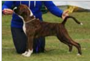
Hagalíns Master of Puppets sem varð besti hvolpur sýningar á sunnudeginum og í 2. sæti á laugardegnum.