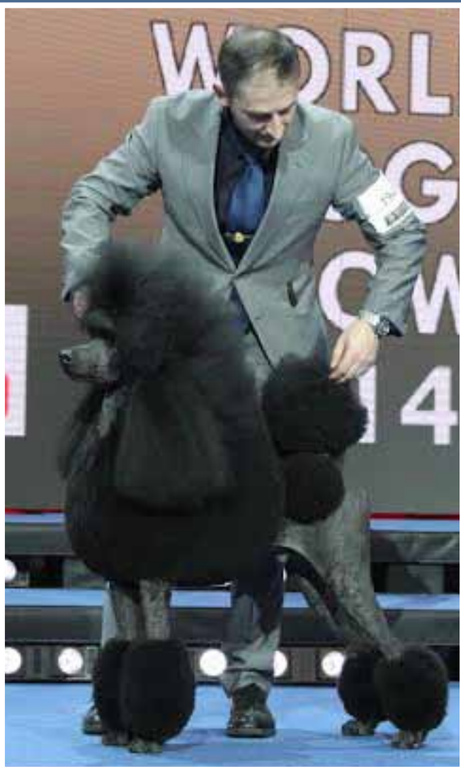
Sigurvegari Crufts 2014, standard poodle rakkinn, SHCh AM Ch Afterglow Maverick Sabre, er eflaust gott dami um vinsalan rakka enda mjög sigursall.

Fyrir ræktendur, sem eru að hefja leit að besta hugsanlega undaneldisrakkanum, eru nokkur atriði sem allir ættu að hafa í huga, sama hver tegundin er.