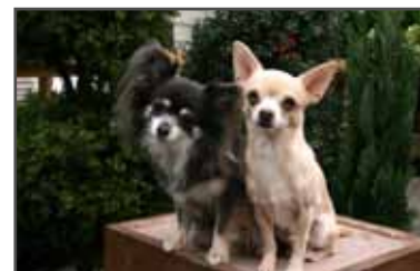
Íslands-Ísafoldar Kolka og Perluskins Casper Dínó. Ljós. Klara Simonardóttir.

Innan HRFÍ hefur verið haldið vel utan um ræktun á tegundinni og hefur verið gott samstarf milli Chihuahua-deildarinnar og stjórnar HRFÍ um kröfur um heilsufarskoðanir sem nauðsynlegar eru fyrir þörun. Einnig hefur deildin verið í samstarfi við chihuahua klúbba Norðurlandanna, sótt sameiginlega stefnumótunarfundi og verið með þeim fyrstu til að innleiða nýjar reglur í ræktun og reglulega eru gerðar kannanir á heilsufari.