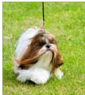
Gin Gin von Savaredo sigraði tegundahóp 9 á sunnudeginum. Ljós. Sóley Ragna Ragnarsdóttir.

20. janúar fæddust 5 hvolpar hjá Gullroðaræktun, 3 rakkar og 2 tíkur.