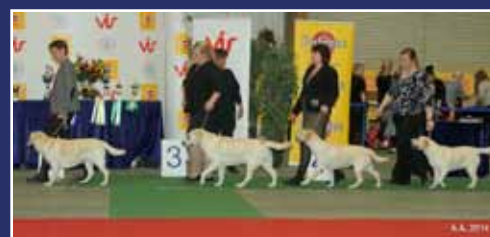
Besti afkvæmahópur sunnudags Labrador retriever Leynigarðs Lexía & afkvæmi