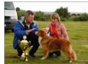
Besti hundur sýningar á deildarsýningu Retrierverdeildar, nova scotia duck tolling retriever-hundurinn, USCh CANCh Pikkinokka's Nice Try Avatar.