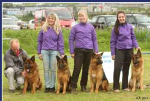
Besti afkvæmahópur sýningar Schäfer, snögghærður RW-13 C.I.B. ISCh Welincha's Yasko & afkvæmi