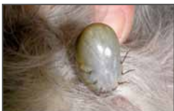
Mynd 2 - Blódmítill á hundi ( ixodes ricinus )

Já, til dæmis eru til hálsbönd (flóahálsbönd) sem innihalda efni sem fæla mítólan frá og eins eru svokölluð spotonlyf notuð, til dæmis stronghold®, front line® og fleiri tegundir.