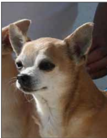
C.I.B. ISCb Íslands Ísafoldar Angantýr.

tímabilinu 1930-1950 fluttu nokkrir frumkvöðlar tegundina til Bretlands og Bretar hafa síðan þá verið leiðandi í ræktun á tegundinni ásamt Ítölum og Skandinöfum síðustu ár. Það var svo ekki fyrr en upp úr 1960 sem chihuahua náði almennum vinsældum og komu þær í kjölfar sjónvarpsumfjöllunar um tegundina. Vinsældirnar hafa aukist gífurlega síðustu ár og stundum á kostnað góðrar ræktunar. Það var svo sérstaklega þegar chihuahua fór að birtast reglulega í sjónvarpi sem fylgihlutur stjarnanna að tegundin fór sumsstaðar að verða líkt og fjöldaframleidd og markaðssetningin var sú að ekkert þyrfti að hafa fyrir þeim og að þeir væru hin fínustu töskudýr. Chihuahua hefur breyst nokkuð í útliti síðustu áratugi en í upphafi voru hundarnir háfettari og ekki eins þéttbyggðir og þeir eru í dag en alltaf hefur aðalsmerki tegundarinnar verið eplalagað höfuð, reist eyru og skottið borið í boga eða hálfhring yfir baki.