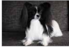
Sigurmyndin í ljósmyndasamkeppni deildarinnar.