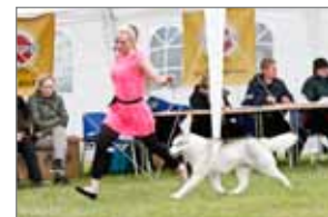
ISCh RW-14 Múla Hríma