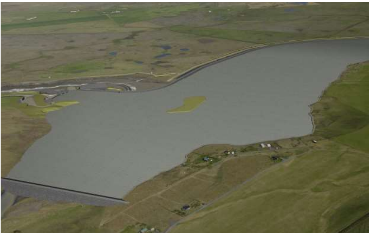
Mynd 5.2 Horft að inntaksmannvirk, lokumannvirkjum og stíflu á vesturbakka.