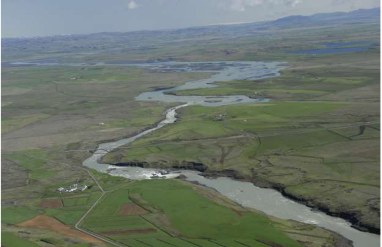
Mynd 5.3 Horft að Urriðafossi og upp farveg Þjórsár á fyrirhuguðu virkjunarsvði.