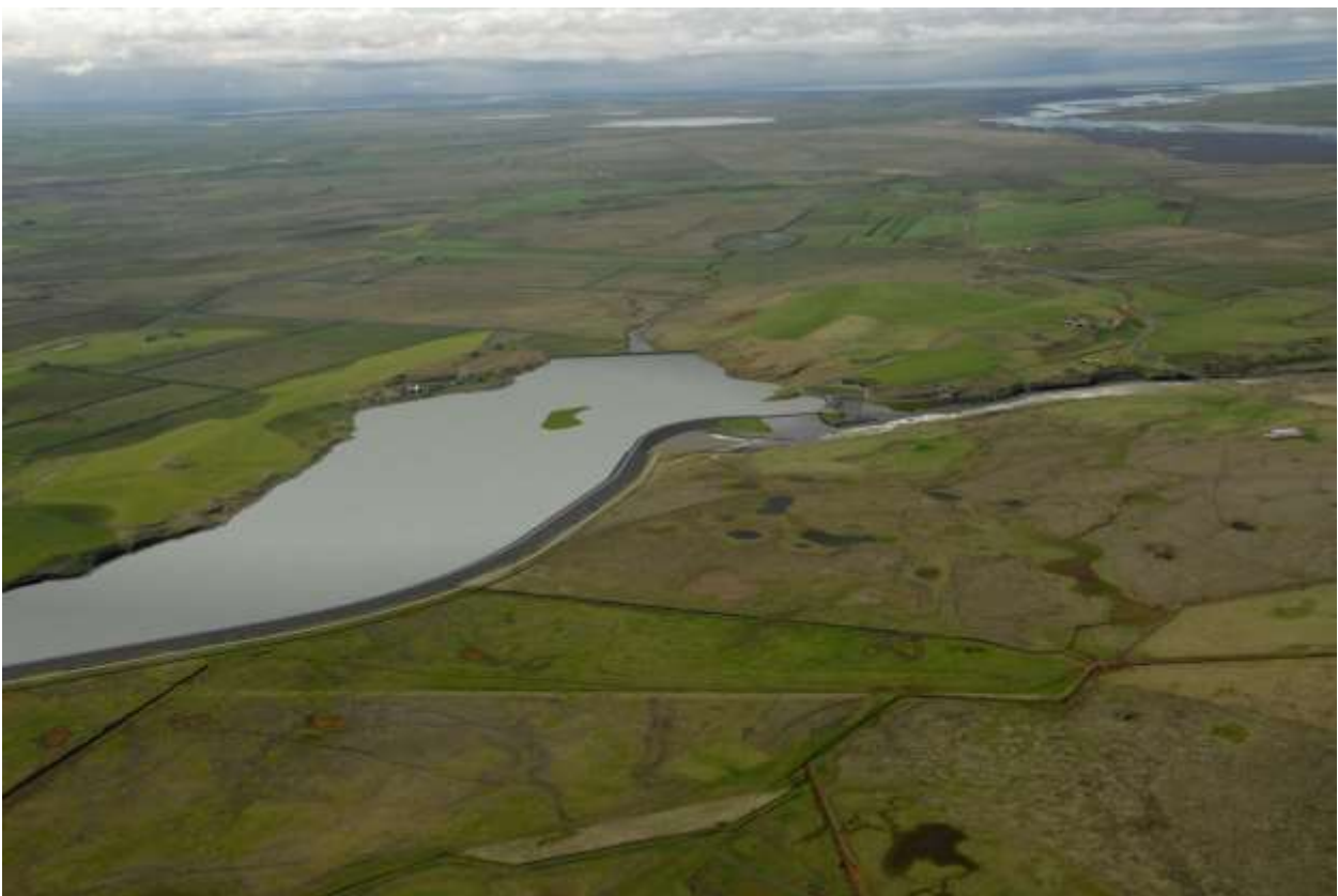
Mynd 5.6 Fyrirhugaður stíflugarður, Heiðarlón, flóðvirki og inntak virkjunar.