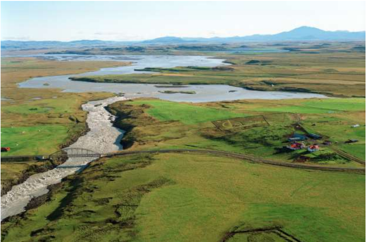
Mynd 1 Horft upp eftir farvegi Þjórsár yfir fyrirhugaðan virkjunarstað og lónstæði.

Virkjunin er inni á aðalskipulagi sveitastjórna Rangárbings ytra, Skeiða og Gnúpverjahrepps Ásahrepps og Flóahrepps.