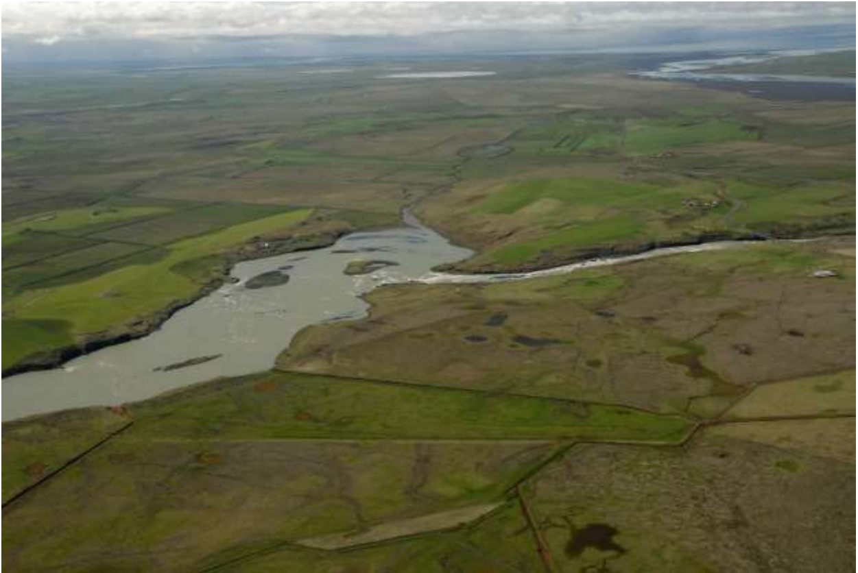
Mynd 5.5 Horft að Heiðartanga og Lónsmýri að fyrirhuguðu virkjunarsvæði.