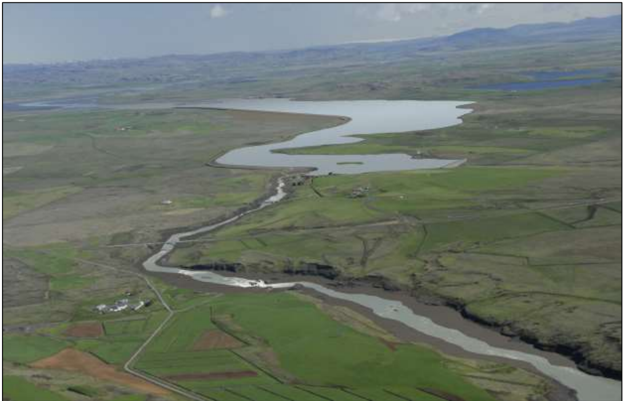
Mynd 5.4 Horft yfir Heiðarlón, frárennslisgöng opnast út í farveg árinna neðst til hægri á myndinni.