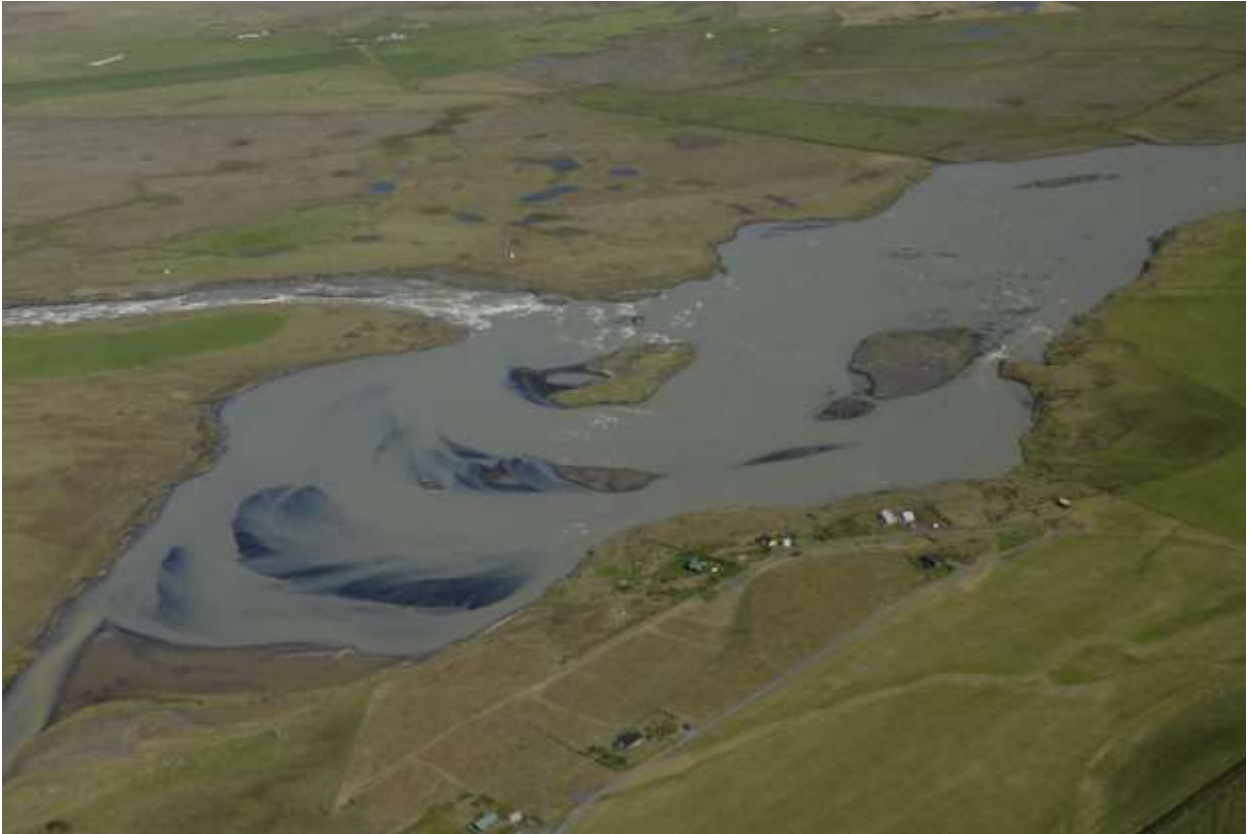
Mynd 5.1 Horft yfir að Heiðartanga og að fyrirhuguðu stíflustæði.