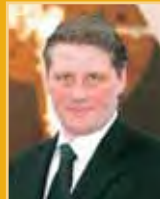
Svafar Magnússon útfararþjónusta