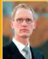
Frímánn Andrésson útfararþjónusta