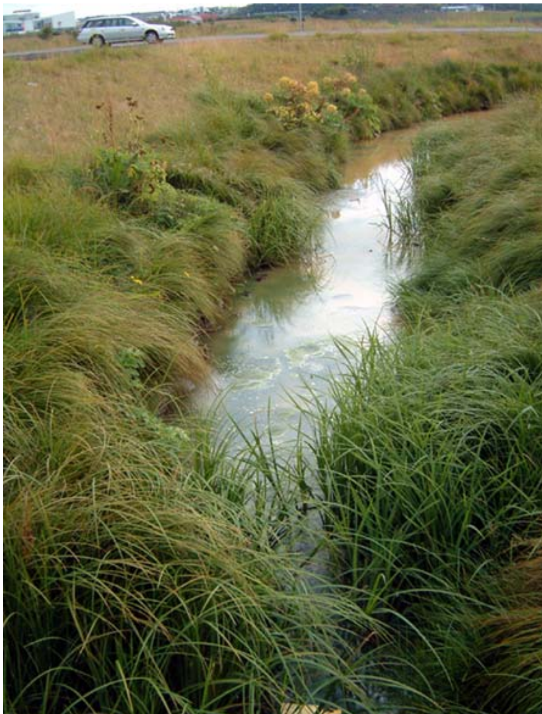
2. mynd. Í ágúst 2003. Starir hafa myndað vöxtulegan mýrargróður á síkisbökkunum.